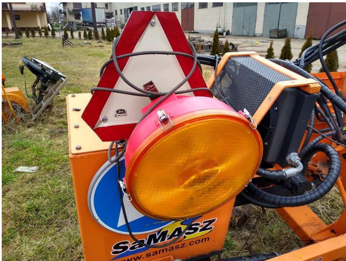
Fot. nr 16