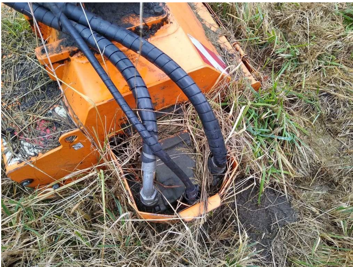
Fot. nr 22

Dokument wystawiony elektronicznie, w a ny bez podpisu