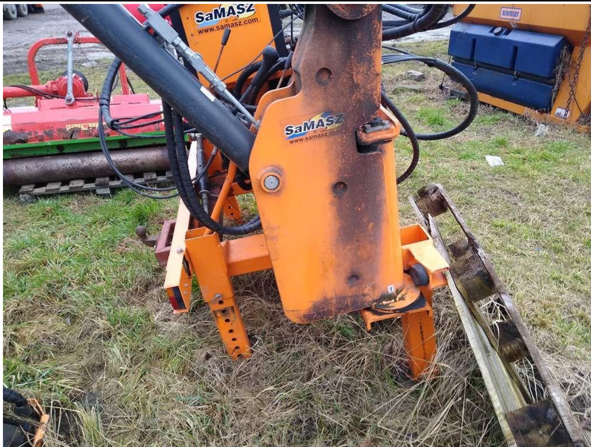
Fot. nr 7