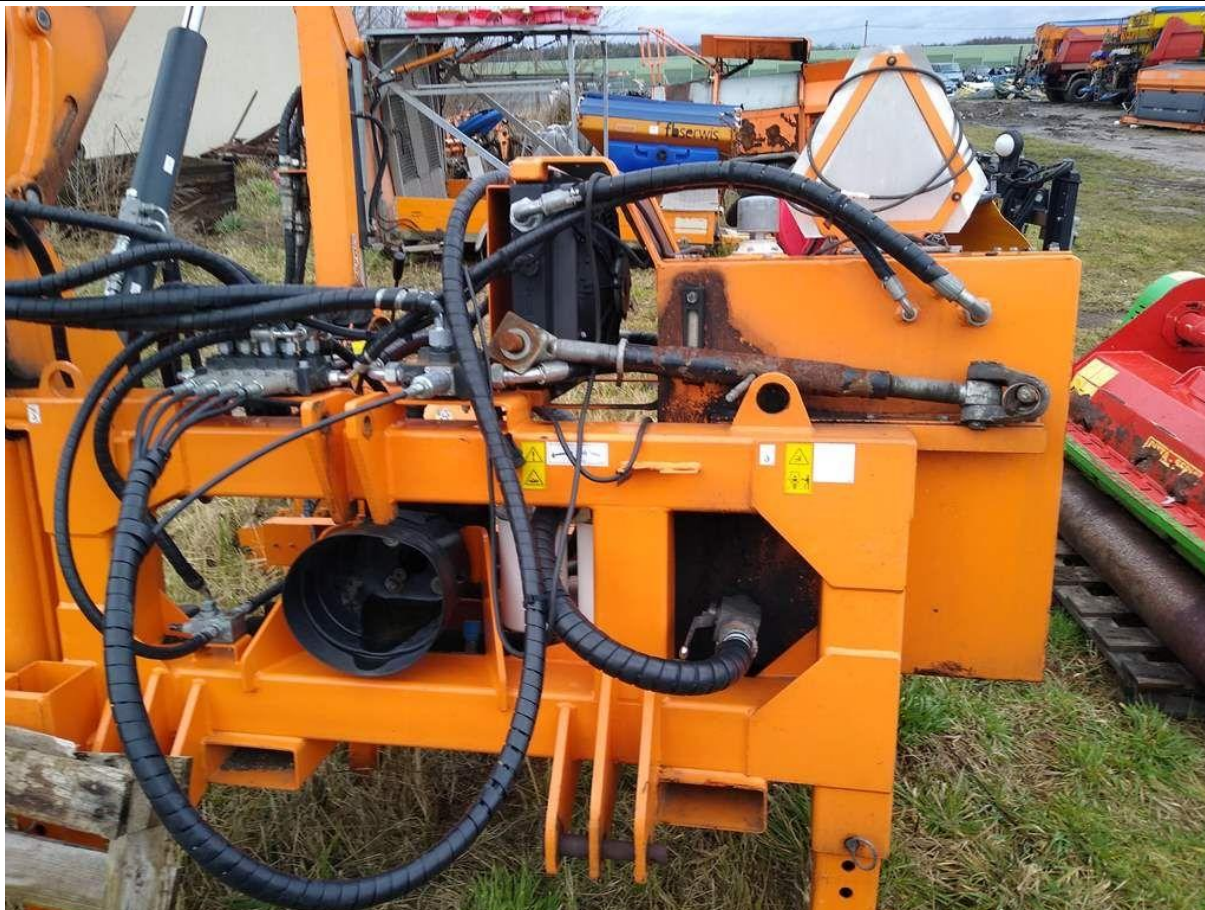
Fot. nr 5