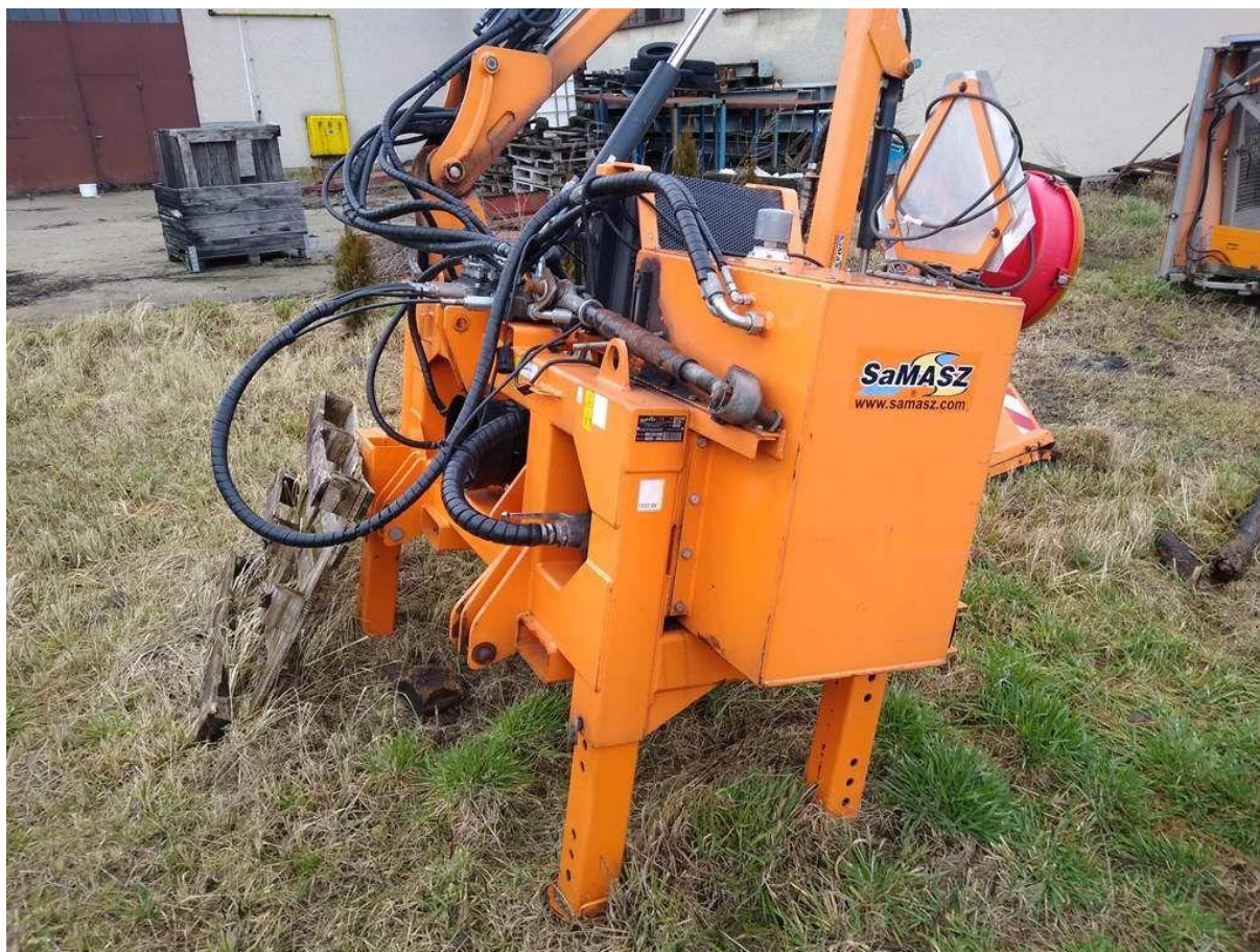
Fot. nr 4