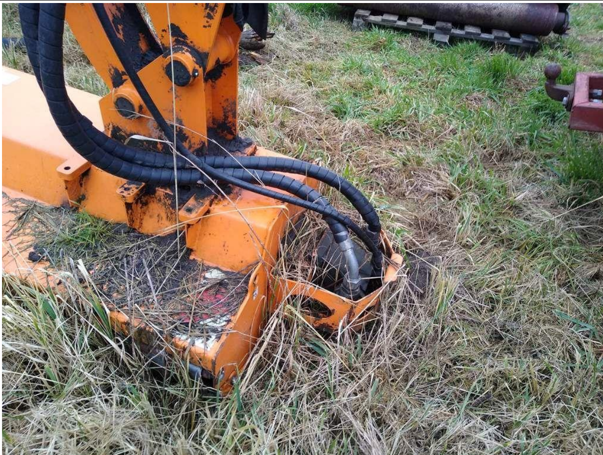
Fot. nr 21