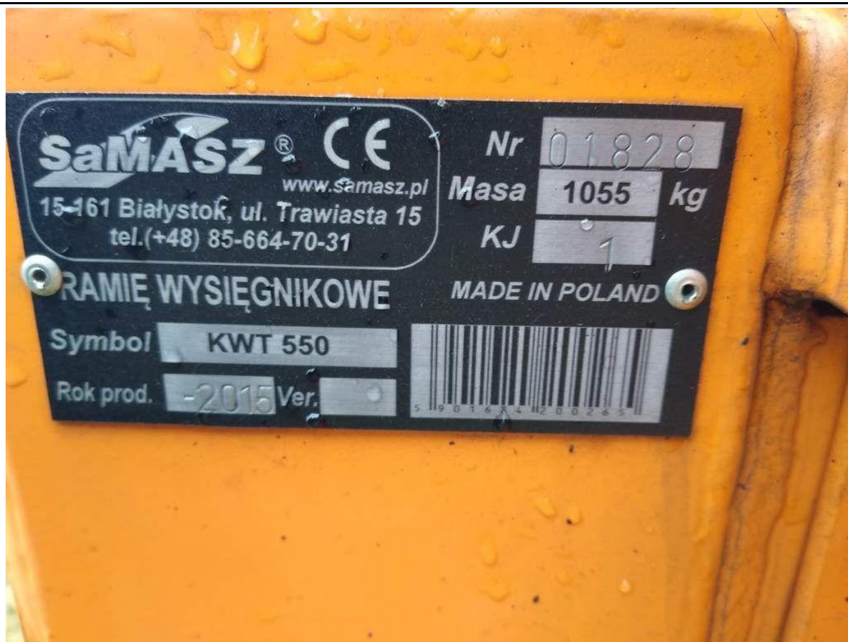
Fot. nr 3