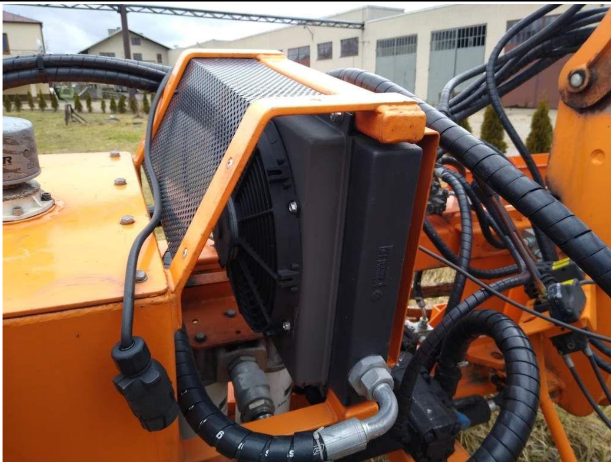
Fot. nr 11