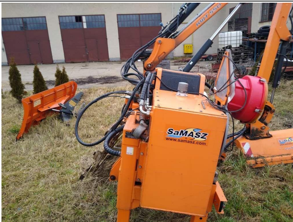
Fot. nr 1