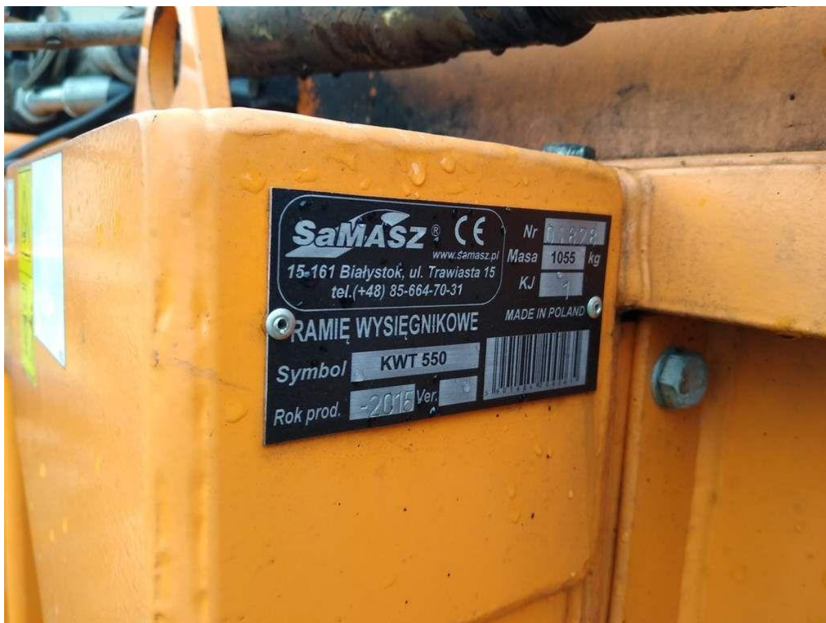
Fot. nr 2