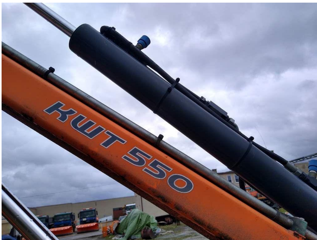
Fot. nr 8