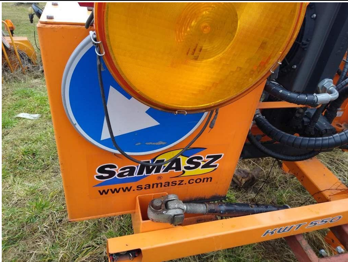
Fot. nr 15