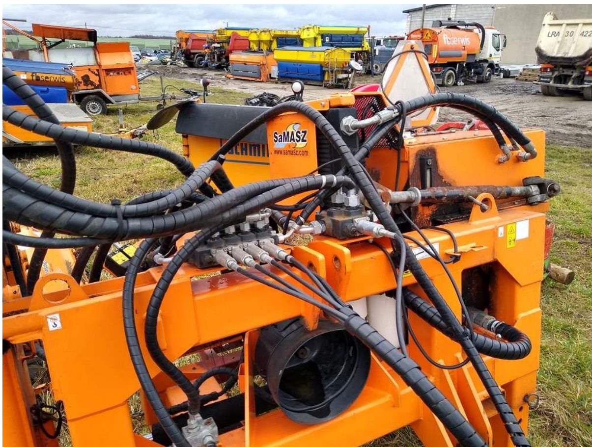
Fot. nr 6