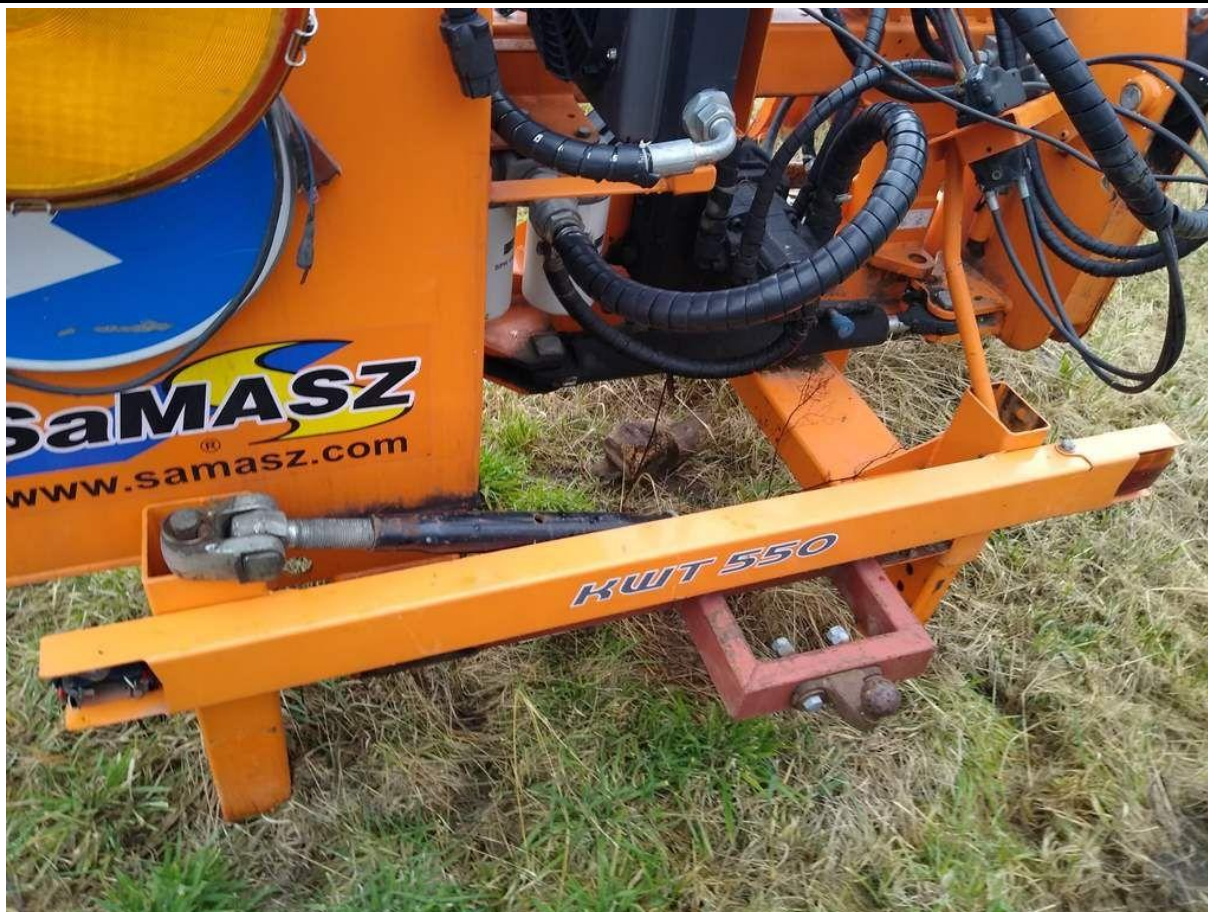
Fot. nr 13