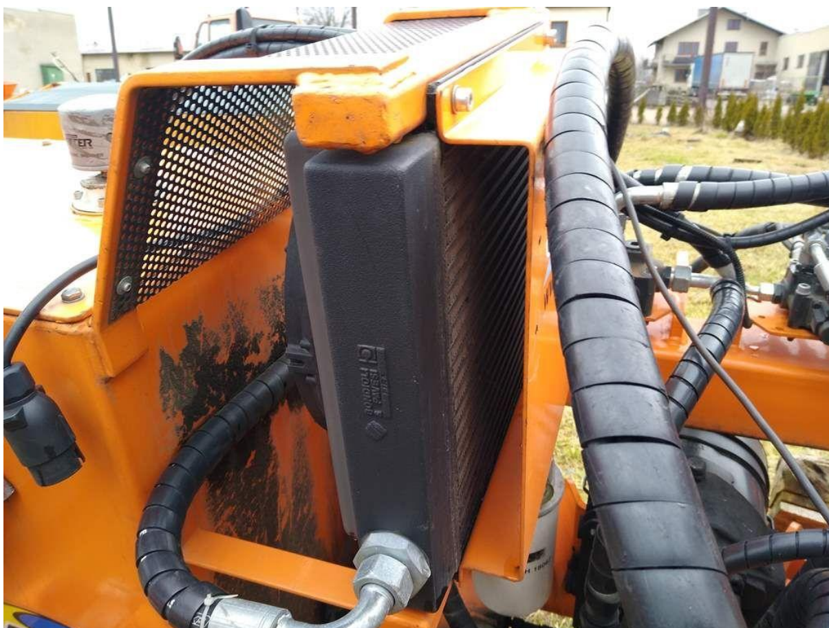
Fot. nr 12