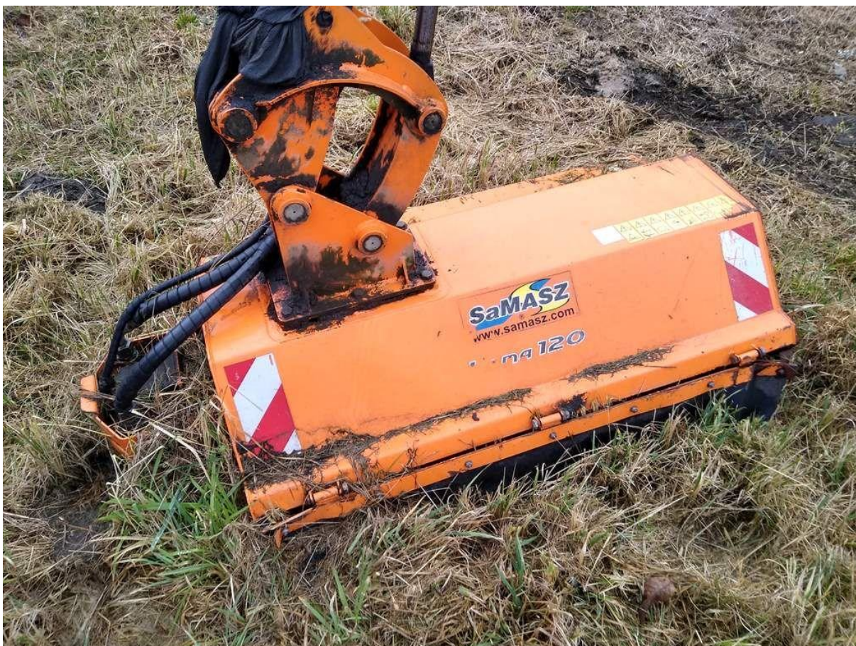
Fot. nr 18