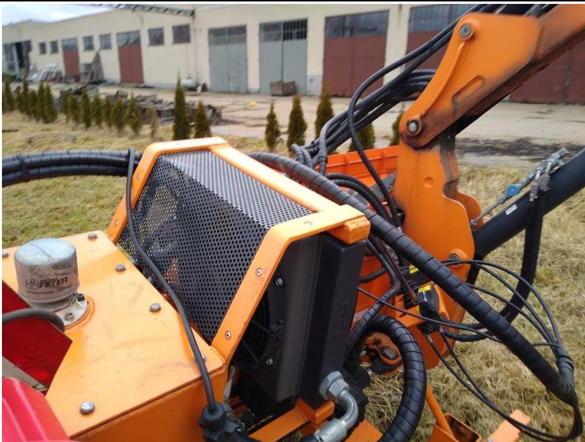
Fot. nr 17