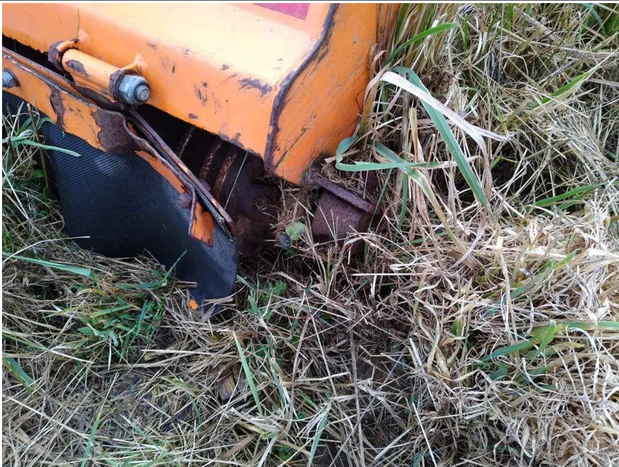
Fot. nr 19