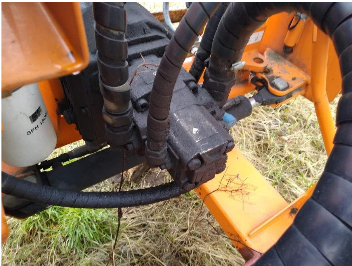
Fot. nr 10