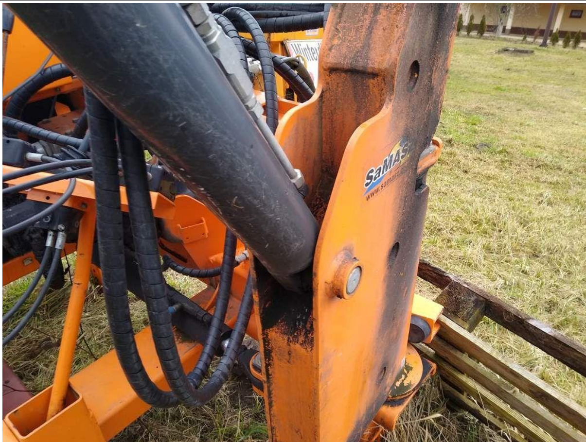
Fot. nr 9