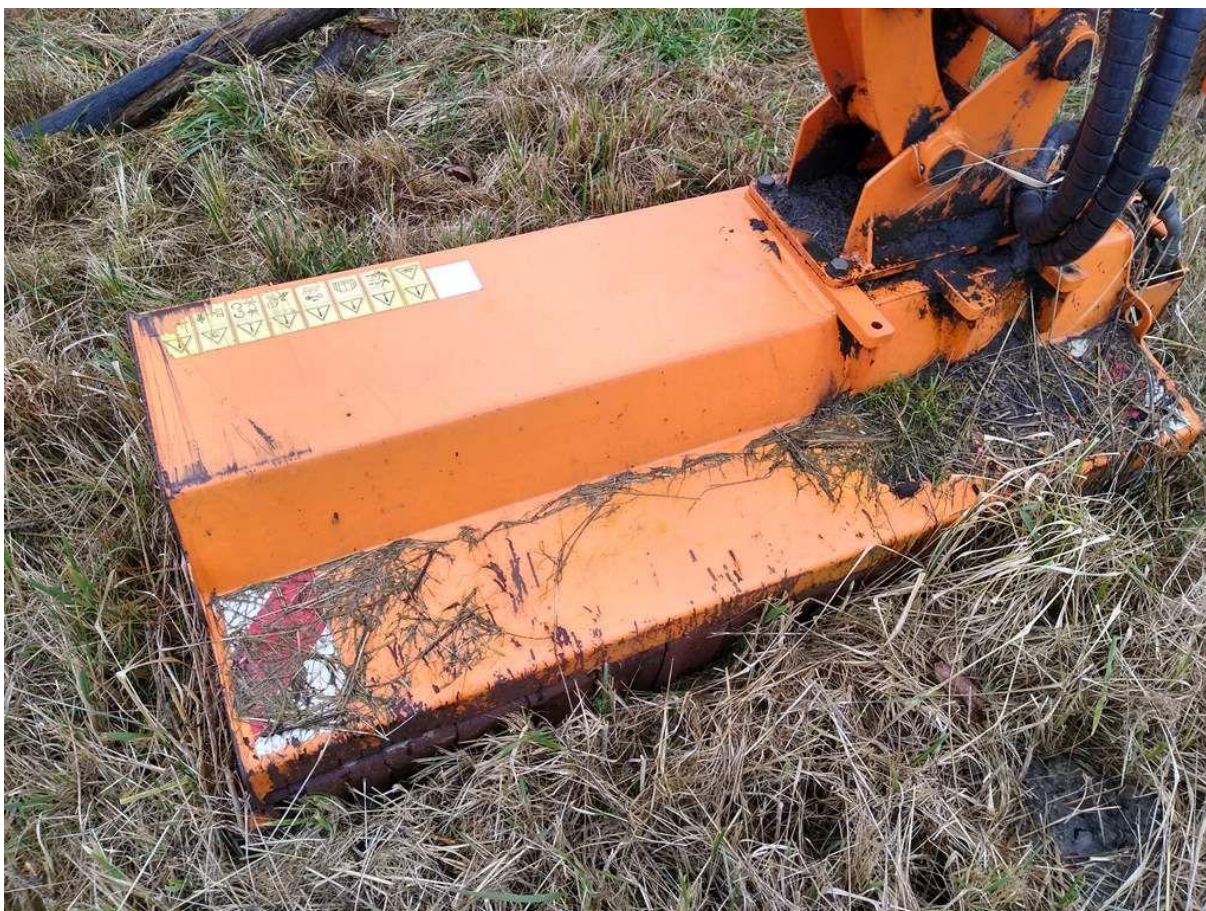
Fot. nr 20