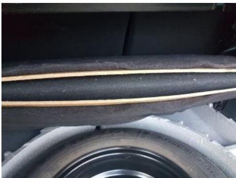
Fot. 37 Wykładzina podłogi bagażnika (rozerwanie)