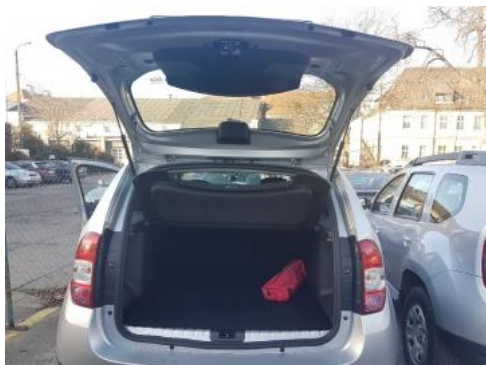
Fot. 17 Bagażnik