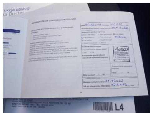
Fot. 24 Książka serwisowa - ostatni przegląd