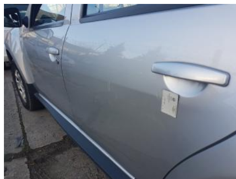
Fot. 30 Drzwi tylne lewe (Zdjęcie poglądowe 1)