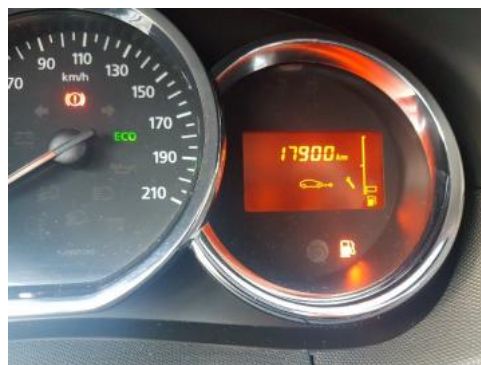
Fot. 26 Zdjęcie do protokołu