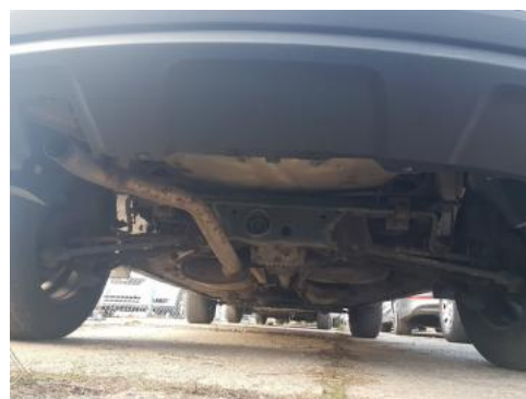
Fot. 20 Spód pojazdu tył