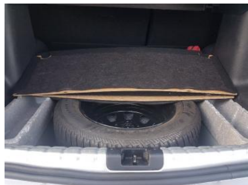
Fot. 36 Wykładzina podłogi bagażnika (Zdjęcie poglądowe 1)