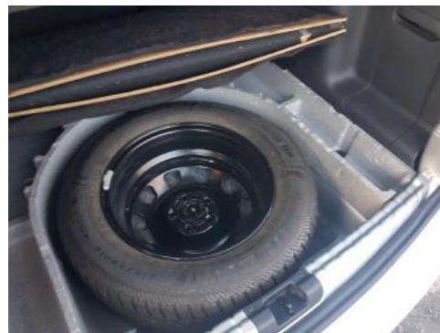
Fot. 18 Koło zapasowe/trójkąt/gaśnica