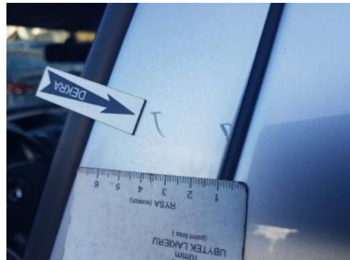
Fot. 34 Drzwi przednie lewe (Rysa/Odprysk)