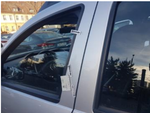
Fot. 33 Drzwi przednie lewe (Zdjęcie poglądowe 1)