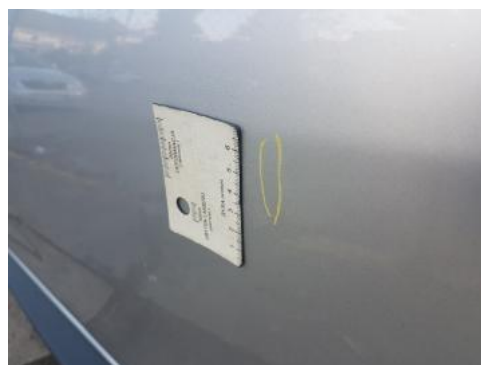
Fot. 32 Drzwi tylne lewe (Wgniecie./Odkształ. 2)