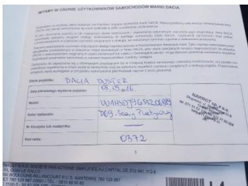
Fot. 23 Książka serwisowa (dane pojazdu)