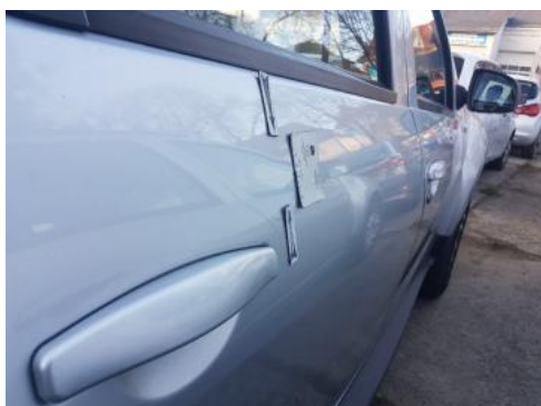
Fot. 27 Drzwi tylne prawe (Zdjęcie poglądowe 1)