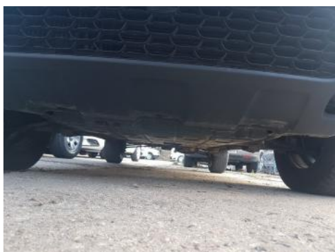
Fot. 19 Spód pojazdu przód