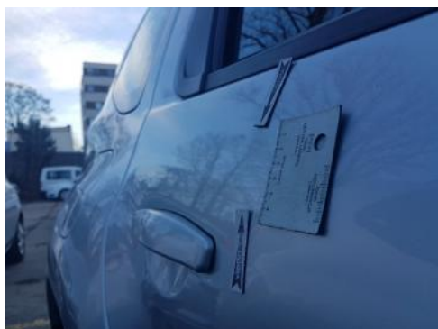
Fot. 29 Drzwi tylne prawe (Wgniecie./Odkształ. 2)