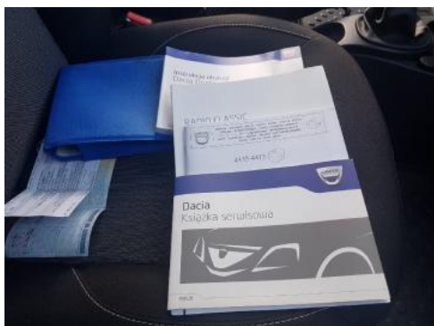
Fot. 25 Instrukcja obsługi