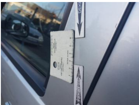
Fot. 35 Drzwi przednie lewe (Wgniecie./Odształ.)