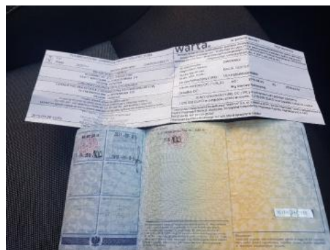
Fot. 22 Dowód rejestracyjny 2. strona / klucze