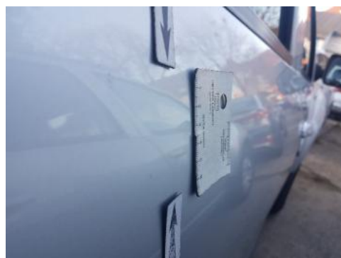
Fot. 28 Drzwi tylne prawe (Wgniecie./Odkształ.)