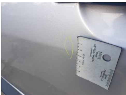
Fot. 31 Drzwi tylne lewe (Wgniecie./Odkształ.)