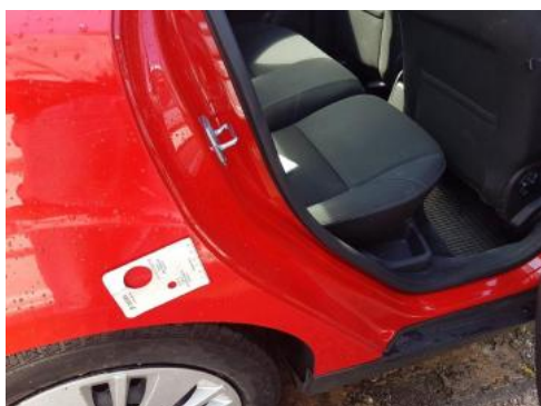
Fot. 27 Błotnik tylny prawy/ściana boczna prawa (Zdjęcie pogładowe 1)