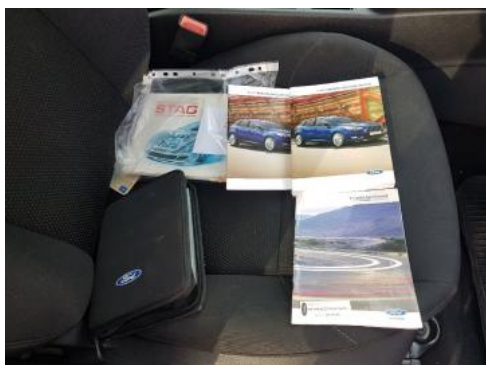
Fot. 25 Instrukcja obsługi