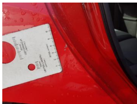
Fot. 28 Błotnik tylny prawy/ściana boczna prawa (Rysa/Odprysk)