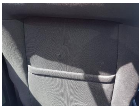
Fot. 32 Fotel lewy (Zdjęcie pogładowe 1)