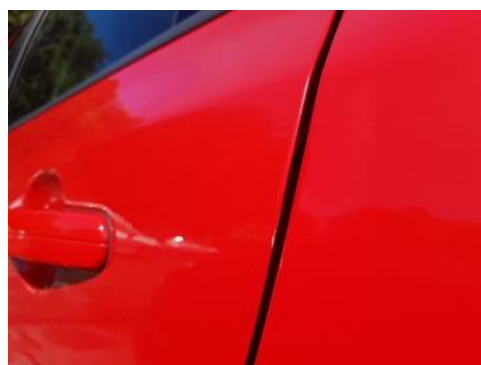
Fot. 30 Drzwi tylne lewe (Rysa/Odprysk)