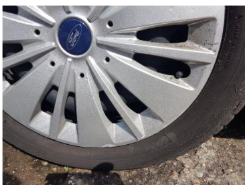
Fot. 31 Kołpak przedni lewy (Rysa/Odprysk)