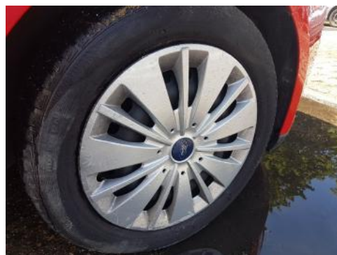
Fot. 26 Kołpak przedni prawy (Rysa/Odprysk)