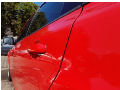
Fot. 29 Drzwi tylne lewe (Zdjęcie pogładowe 1)