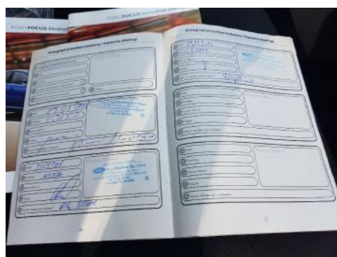
Fot. 24 Książka serwisowa - ostatni przegląd