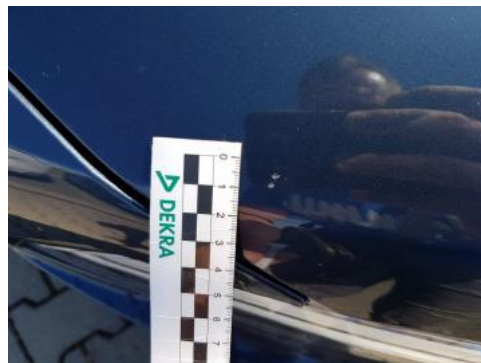
Fot. 26 Pokrywa komory silnika (Rysa/Odprysk)