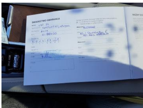
Fot. 23 Książka serwisowa (dane pojazdu)