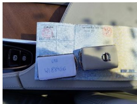
Fot. 22 Dowód rejestracyjny 2. strona / klucze