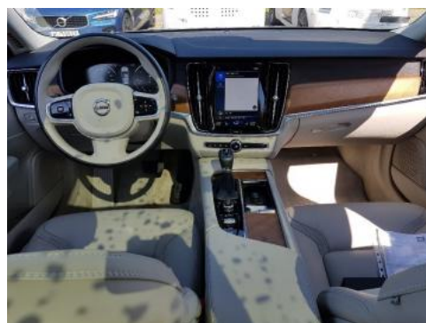
Fot. 12 Widok z tylnego siedzenia