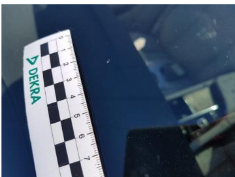
Fot. 27 Szyba czołowa (Rysa/Odprysk)