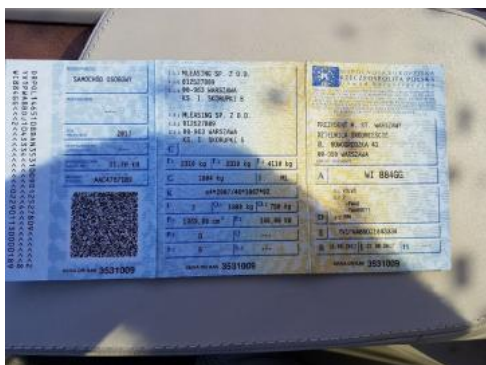
Fot. 21 Dowód rejestracyjny 1. strona