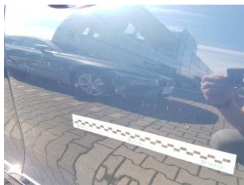
Fot. 32 Drzwi przednie prawe (Rysa/Odprysk)