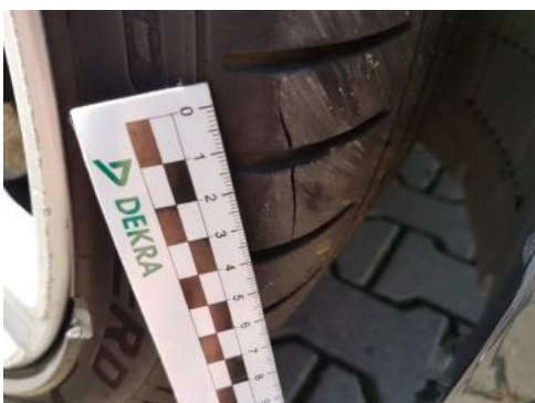
Fot. 31 Opona przednia prawa (Wgniecie./Odkształ. 1)