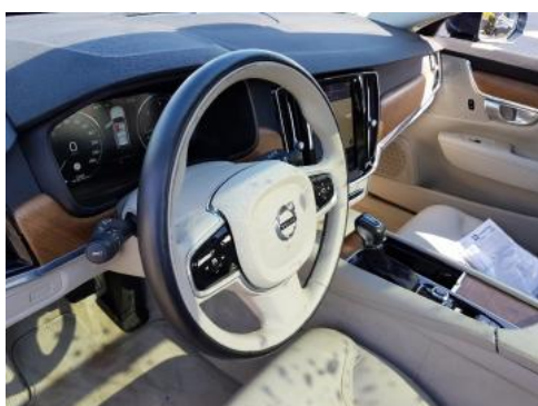
Fot. 15 Kierownica widok z lewej strony (widoczne przełączniki)