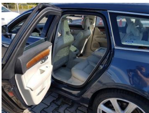
Fot. 11 Widok przez lewe tylne drzwi