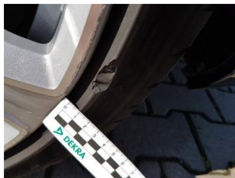
Fot. 30 Opona przednia prawa (Wgniecie./Odkształ.)