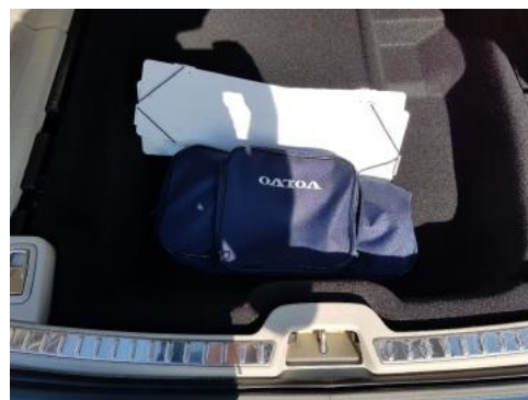
Fot. 18 Koło zapasowe/trójkąt/gaśnica