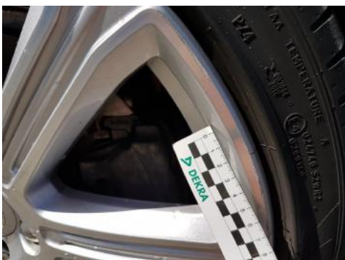
Fot. 29 Felga przednia prawa (Rysa/Odprysk 1)