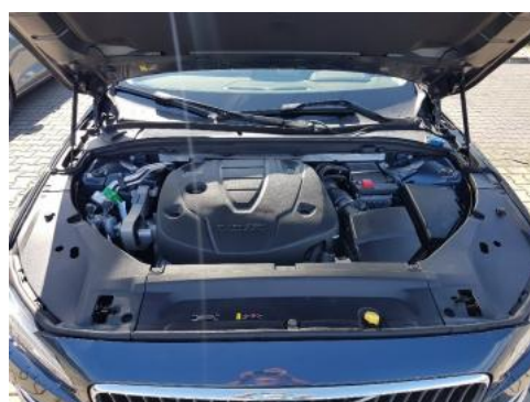
Fot. 16 Komora silnika