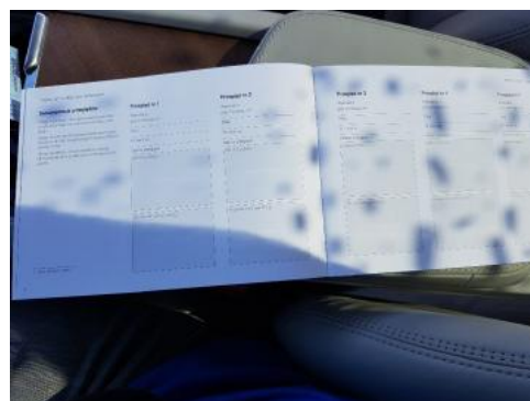
Fot. 24 Książka serwisowa - ostatni przegląd