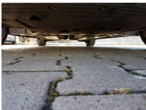
Fot. 19 Spód pojazdu przód