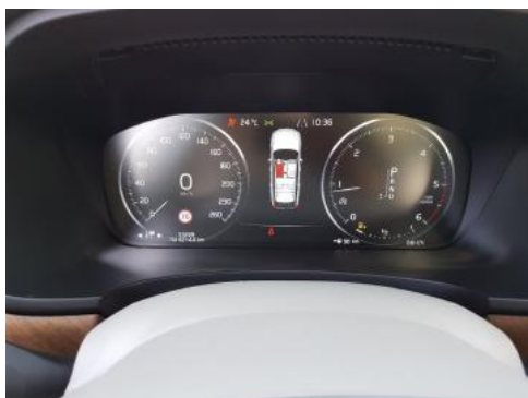
Fot. 9 Wskaźniki /przebieg/paliwo