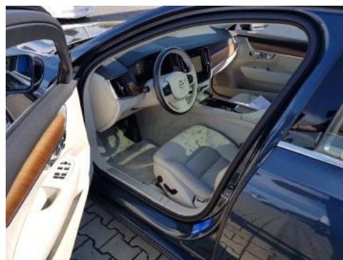
Fot. 10 Widok przez lewe przednie drzwi