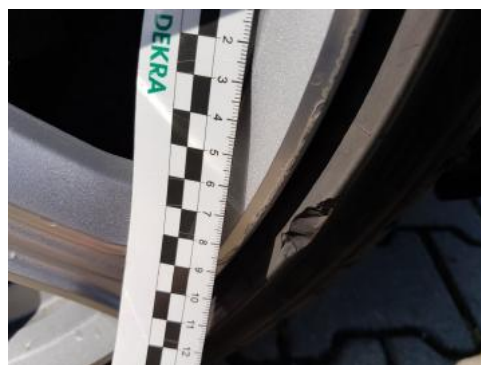
Fot. 28 Felga przednia prawa (Rysa/Odprysk)