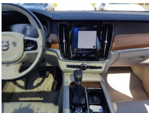
Fot. 13 Konsola środkowa