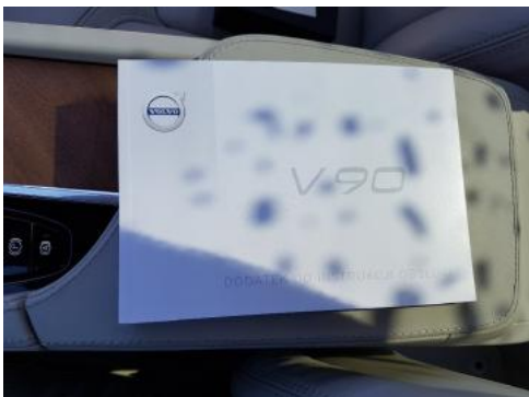
Fot. 25 Instrukcja obsługi