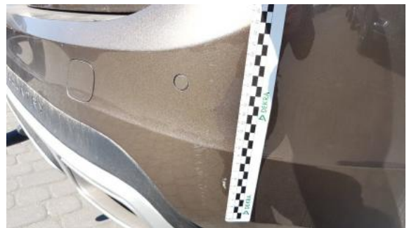
Fot. 28 Zderzak tylny (Rysa/Odprysk)