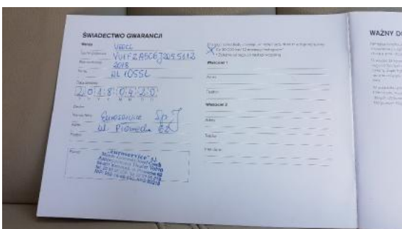
Fot. 23 Książka serwisowa (dane pojazdu)