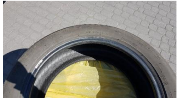
Fot. 26 Zdjęcie do protokołu