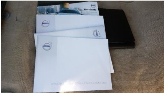
Fot. 25 Instrukcja obsługi