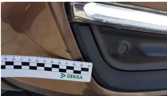
Fot. 27 Zderzak (Rysa/Odprysk)