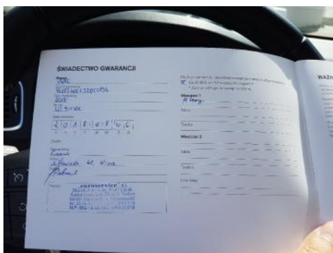
Fot. 23 Książka serwisowa (dane pojazdu)