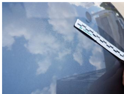
Fot. 26 Pokrywa komory silnika (Wgniecie./Odształ.)