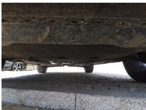
Fot. 19 Spód pojazdu przód