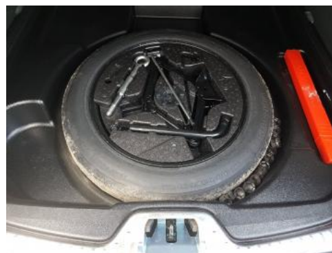
Fot. 18 Koło zapasowe/trójkąt/gaśnica