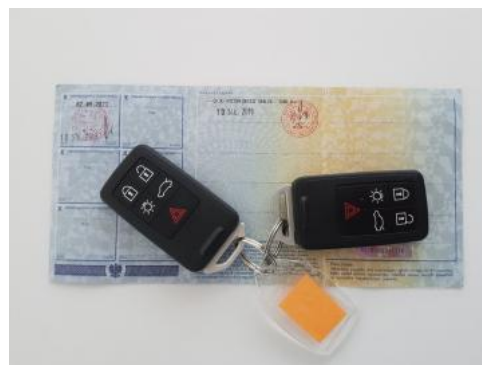
Fot. 22 Dowód rejestracyjny 2. strona / klucze