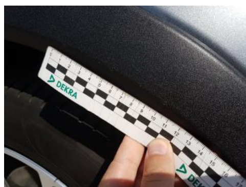
Fot. 28 Błotnik przedni prawy (Rysa/Odprysk)