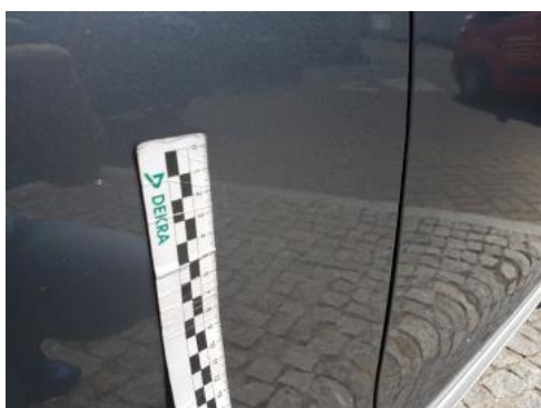
Fot. 29 Drzwi tylne prawe (Rysa/Odprysk)