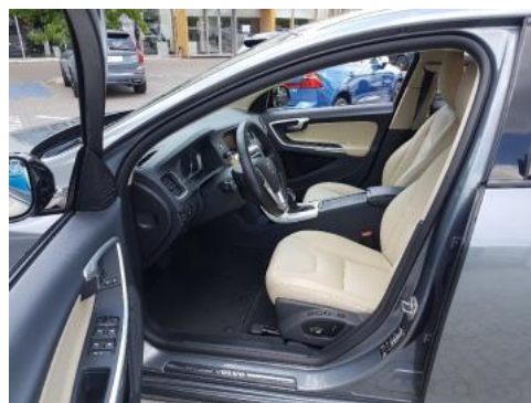
Fot. 10 Widok przez lewe przednie drzwi