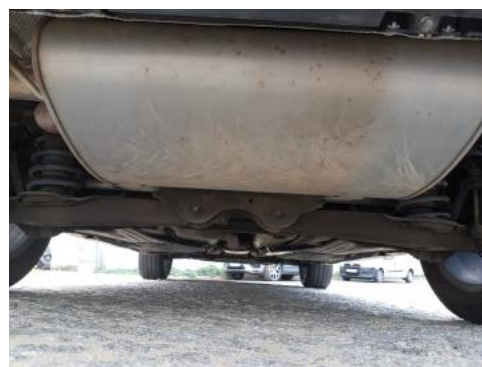
Fot. 20 Spód pojazdu tył