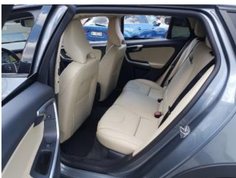
Fot. 11 Widok przez lewe tylne drzwi