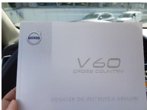
Fot. 25 Instrukcja obsługi