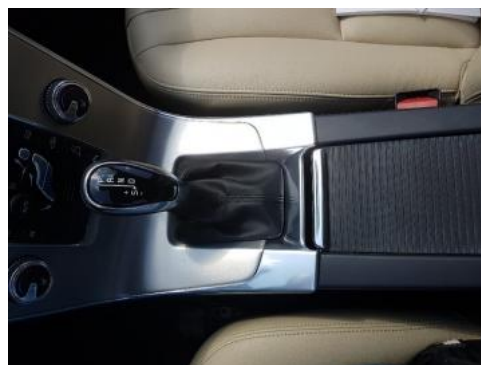
Fot. 14 Tunel środkowy