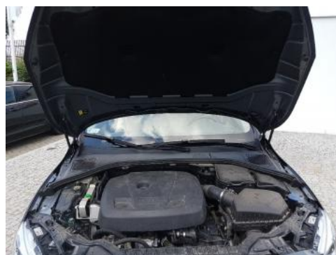
Fot. 16 Komora silnika