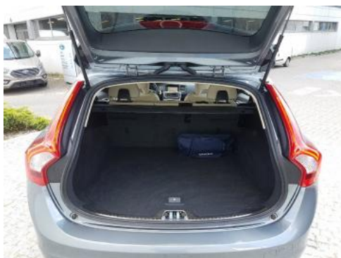
Fot. 17 Bagażnik