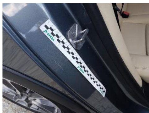
Fot. 30 Błotnik tylny prawy/ściana boczna prawa (Rysa/Odprysk)