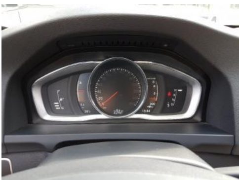
Fot. 9 Wskaźniki /przebieg/paliwo