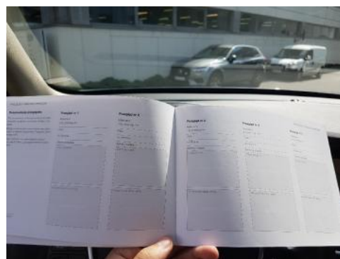
Fot. 24 Książka serwisowa - ostatni przegląd