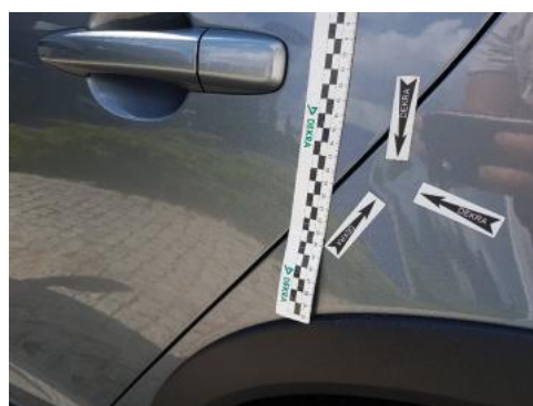
Fot. 32 Błotnik tylny lewy/ściana boczna lewa (Wgniecie./Odształ.)