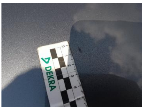
Fot. 27 Pokrywa komory silnika (Wgniecie./Odształ. 1)