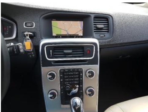
Fot. 13 Konsola środkowa