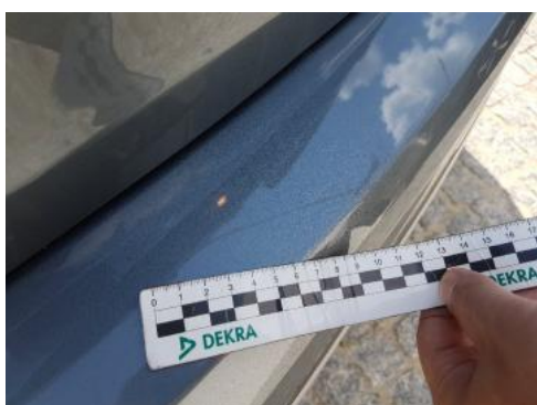
Fot. 31 Zderzak tylny (Rysa/Odprysk)