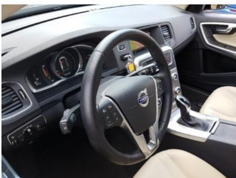
Fot. 15 Kierownica widok z lewej strony (widoczne przełączniki)