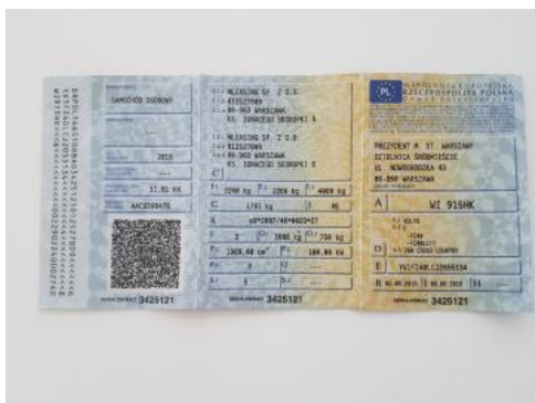
Fot. 21 Dowód rejestracyjny 1. strona