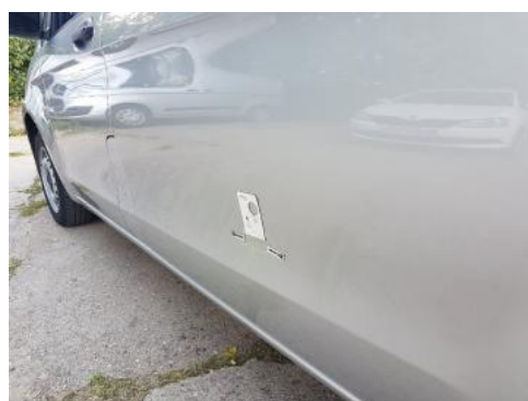
Fot. 32 Błotnik tylny lewy/ściana boczna lewa (Zdjęcie pogładowe 1)