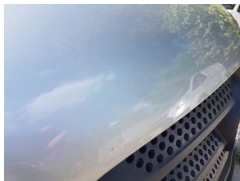
Fot. 26 Pokrywa komory silnika (Zdjęcie pogładowe 1)