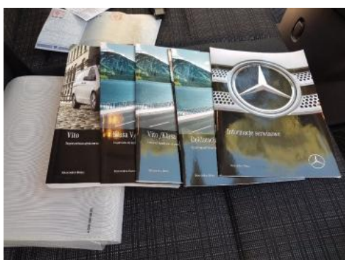
Fot. 23 Instrukcja obsługi