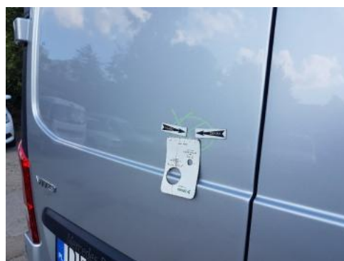
Fot. 30 Pokrywa bagażnika (Zdjęcie pogładowe 1)