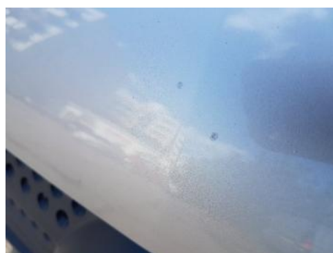
Fot. 28 Pokrywa komory silnika (Rysa/Odprysk 1)