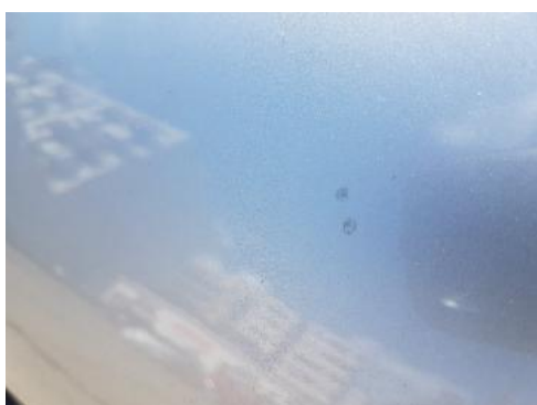
Fot. 27 Pokrywa komory silnika (Rysa/Odprysk)