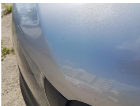
Fot. 29 Pokrywa komory silnika (Rysa/Odprysk 2)