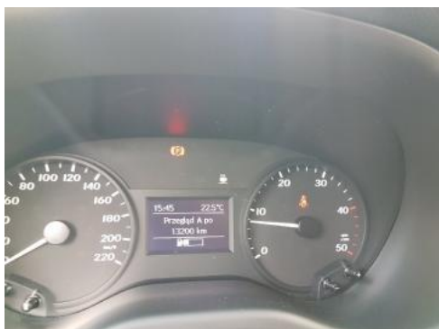
Fot. 25 Zdjęcie do protokołu