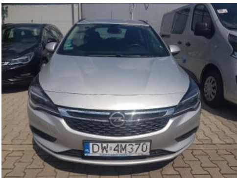
Fot. 1 Przód