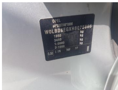
Fot. 8 Tabliczka