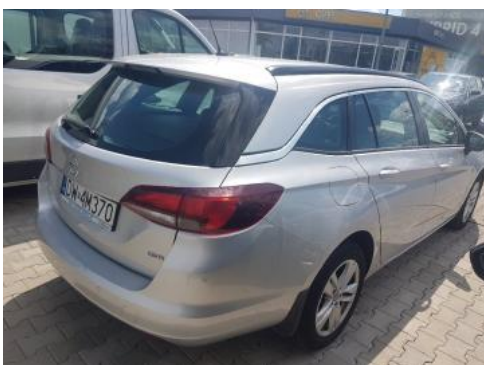
Fot. 3 Prawy bok tył