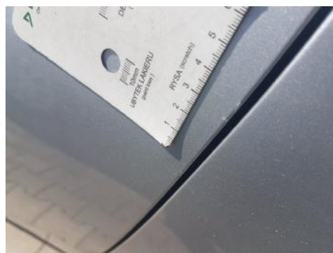
Fot. 44 Drzwi tylne lewe (Rysa/Odprysk)