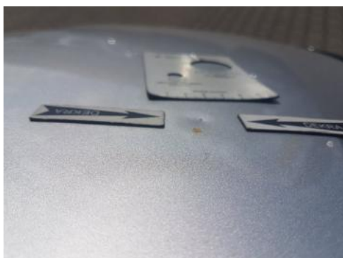
Fot. 31 Pokrywa komory silnika (Wgniec./Odształ.)