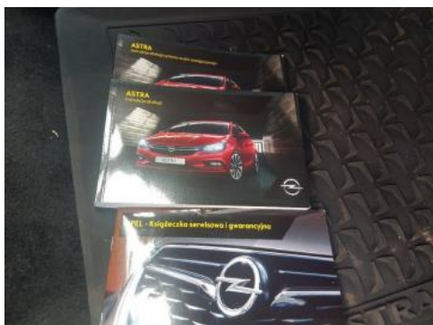
Fot. 25 Instrukcja obsługi