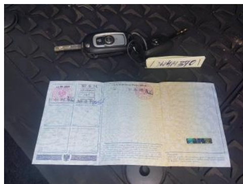
Fot. 22 Dowód rejestracyjny 2. strona / klucze