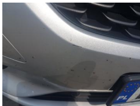
Fot. 28 Zderzak (Rysa/Odprysk 1)