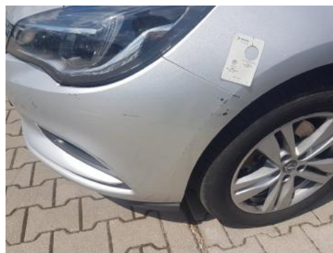
Fot. 26 Zderzak (Zdjęcie poglądowe 1)