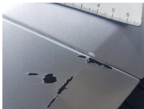
Fot. 48 Błotnik przedni lewy (Rysa/Odprysk)