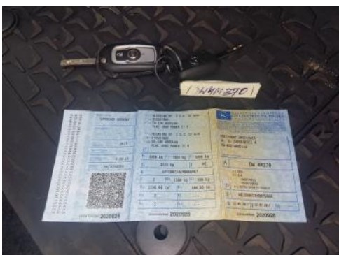
Fot. 21 Dowód rejestracyjny 1. strona