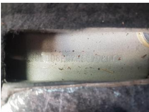
Fot. 7 Pole numerowe