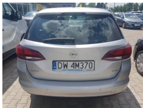
Fot. 4 Tył