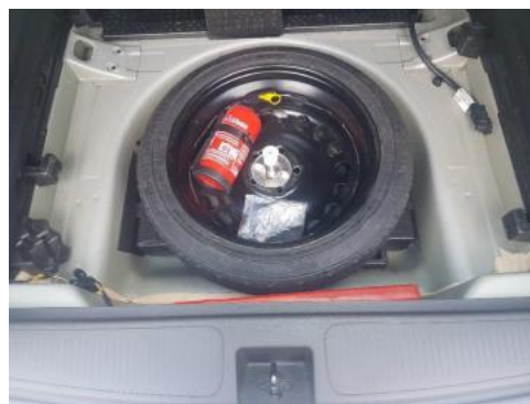
Fot. 18 Koło zapasowe/trójkąt/gaśnica