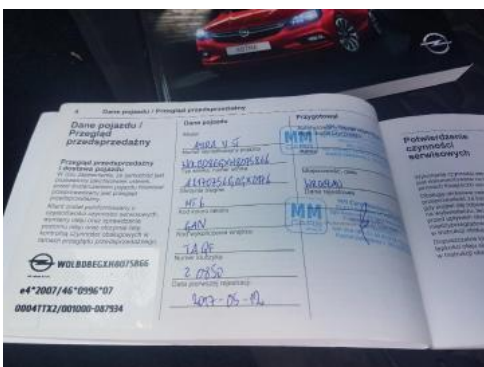
Fot. 23 Książka serwisowa (dane pojazdu)