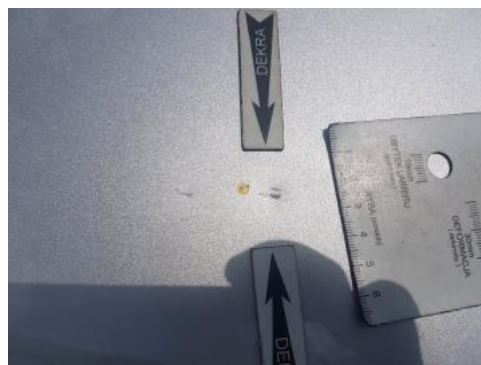
Fot. 30 Pokrywa komory silnika (Rysa/Odprysk)