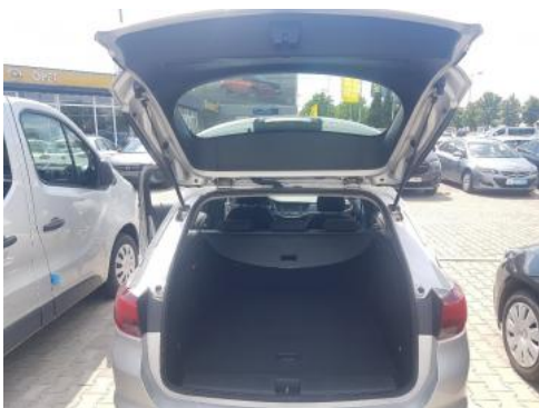
Fot. 17 Bagażnik