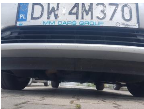
Fot. 19 Spód pojazdu przód