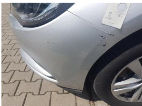
Fot. 27 Zderzak (Rysa/Odprysk)