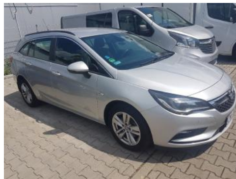
Fot. 2 Prawy bok przód