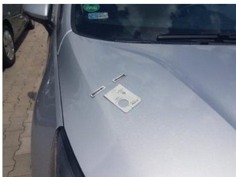
Fot. 29 Pokrywa komory silnika (Zdjęcie poglądowe 1)