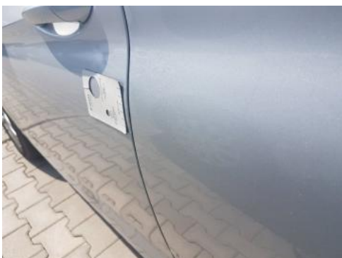
Fot. 45 Drzwi przednie lewe (Zdjęcie poglądowe 1)