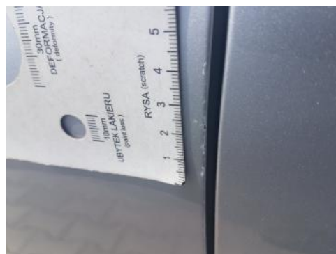
Fot. 46 Drzwi przednie lewe (Rysa/Odprysk)