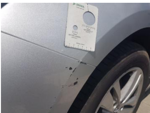
Fot. 47 Błotnik przedni lewy (Zdjęcie poglądowe 1)