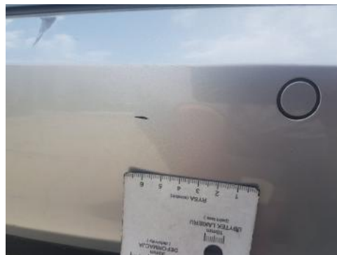
Fot. 42 Zderzak tylny (Rysa/Odprysk 2)