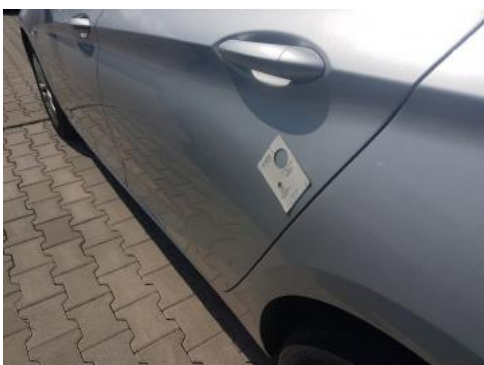
Fot. 43 Drzwi tylne lewe (Zdjęcie poglądowe 1)