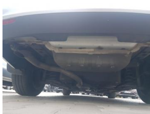
Fot. 20 Spód pojazdu tył