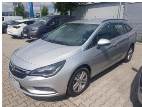
Fot. 6 Lewy bok przód