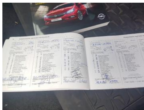
Fot. 24 Książka serwisowa - ostatni przegląd