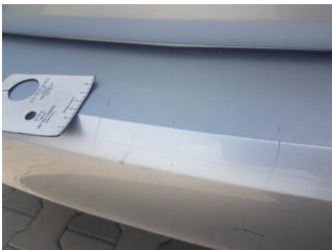
Fot. 41 Zderzak tylny (Rysa/Odprysk 1)