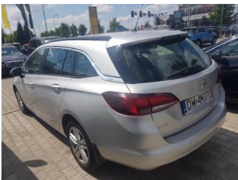
Fot. 5 Lewy bok tył