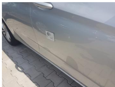
Fot. 32 Drzwi przednie prawe (Zdjęcie poglądowe 1)