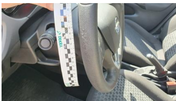
Fot. 43 Koło kierownicy (Inne)