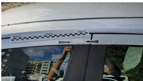
Fot. 37 Drzwi przednie lewe (Zdjęcie poglądowe 1)