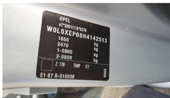
Fot. 8 Tabliczka