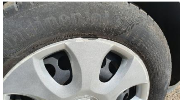
Fot. 26 Kołpak przedni prawy (Pęknięcie/Rozerwanie)