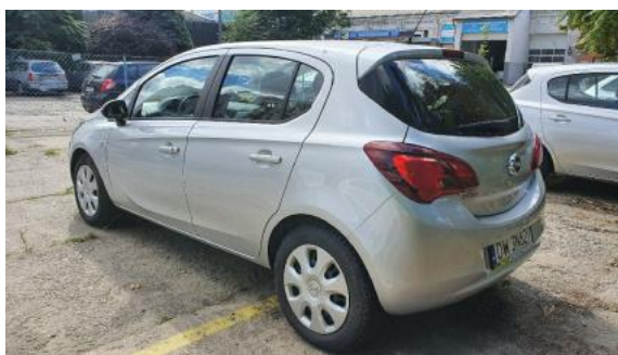
Fot. 5 Lewy bok tył