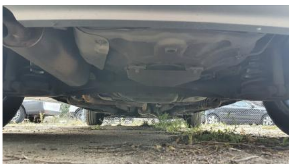
Fot. 19 Spód pojazdu tył