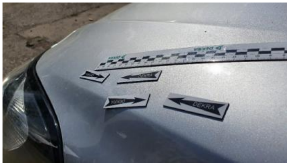
Fot. 25 Pokrywa komory silnika (Wgniecie./Odształ.)