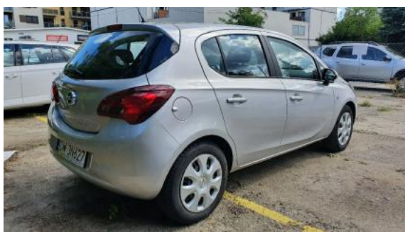
Fot. 3 Prawy bok tył