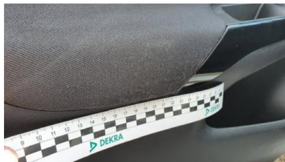
Fot. 42 Tapicerka drzwi przednich lewych (Rysa/Odprysk)