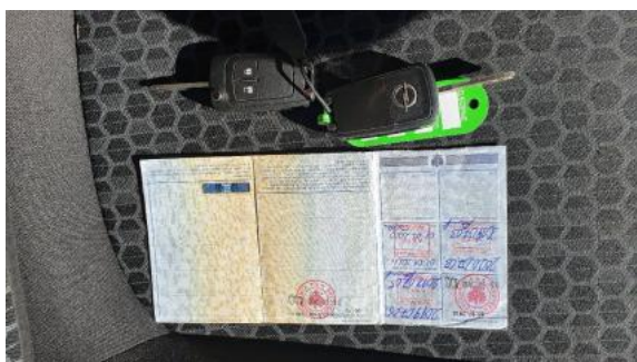
Fot. 21 Dowód rejestracyjny 2. strona / klucze