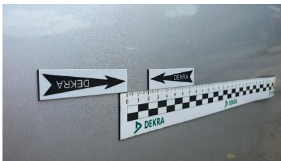
Fot. 27 Drzwi przednie prawe (Rysa/Odprysk)