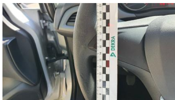
Fot. 44 Koło kierownicy (Inne 1)