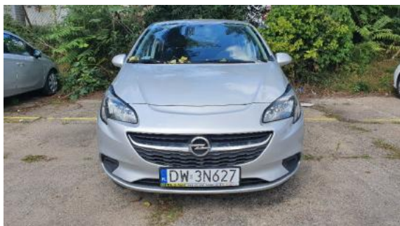
Fot. 1 Przód