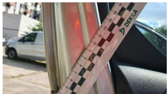
Fot. 32 Drzwi tylne lewe (Rysa/Odprysk)