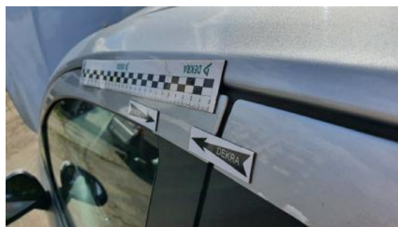
Fot. 38 Drzwi przednie lewe (Wgniecie./Odkształ.)