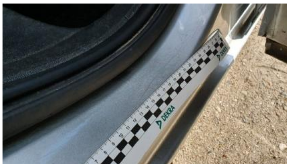
Fot. 29 Próg prawy (Rysa/Odprysk 1)