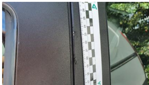
Fot. 34 Drzwi tylne lewe (Rysa/Odprysk 2)