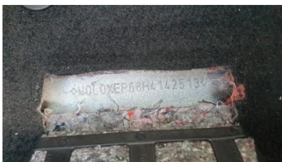
Fot. 7 Pole numerowe