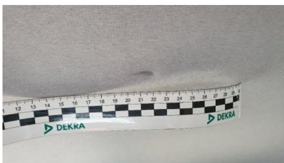
Fot. 47 Podsufitka (Wgniecie./Odkształ.)