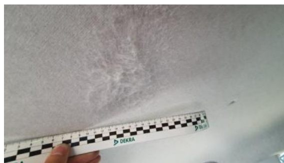
Fot. 46 Podsufitka (Rysa/Odprysk)