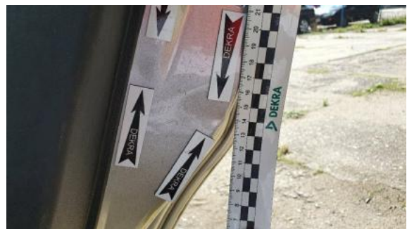
Fot. 30 Drzwi tylne prawe (Wgniecie./Odształ.)