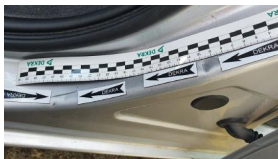
Fot. 36 Próg lewy (Wgniecie./Odkształ.)