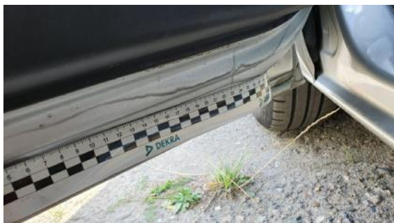
Fot. 41 Drzwi przednie lewe (Inne)