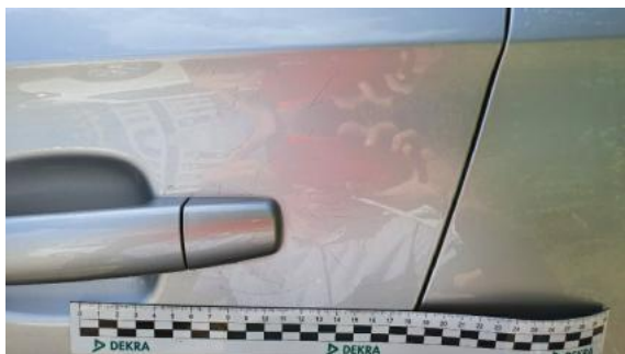
Fot. 33 Drzwi tylne lewe (Rysa/Odprysk 1)