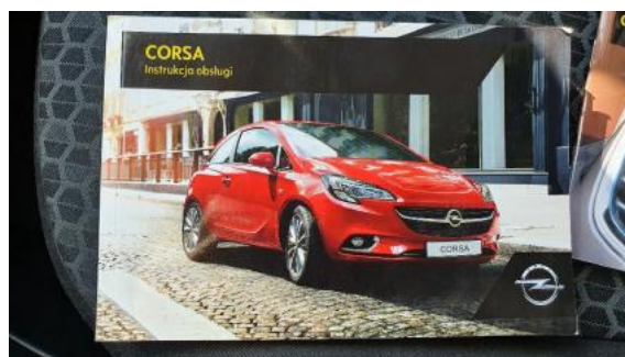
Fot. 24 Instrukcja obsługi