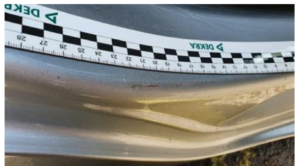
Fot. 28 Próg prawy (Rysa/Odprysk)