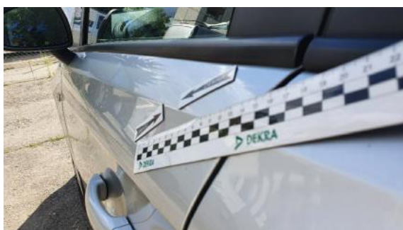
Fot. 39 Drzwi przednie lewe (Wgniecie./Odkształ. 1)