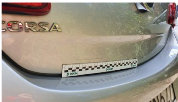
Fot. 31 Pokrywa bagażnika (Rysa/Odprysk)