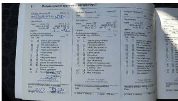
Fot. 23 Książka serwisowa - ostatni przegląd