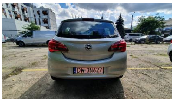
Fot. 4 Tył