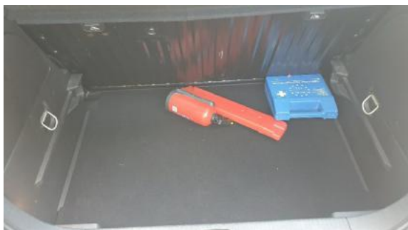
Fot. 17 Bagażnik