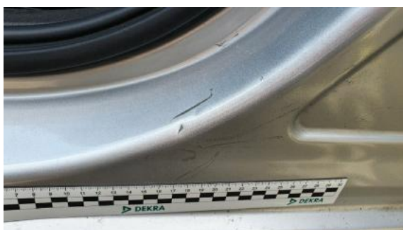
Fot. 35 Próg lewy (Rysa/Odprysk)