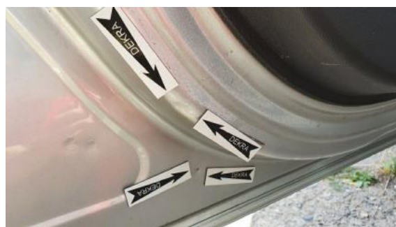
Fot. 40 Drzwi przednie lewe (Wgniecie./Odkształ. 2)