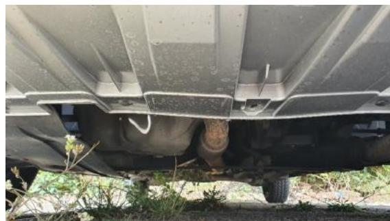
Fot. 18 Spód pojazdu przód