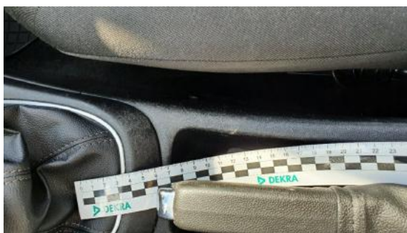
Fot. 45 Konsola środkowa (Rysa/Odprysk)