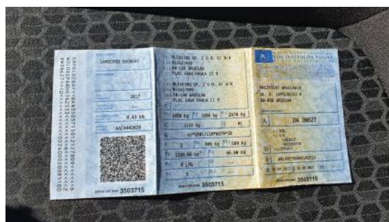
Fot. 20 Dowód rejestracyjny 1. strona