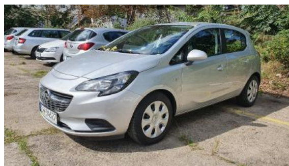
Fot. 6 Lewy bok przód