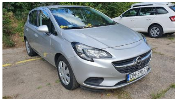
Fot. 2 Prawy bok przód