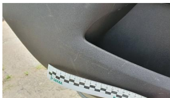
Fot. 48 Tapicerka drzwi tylnych lewych (Rysa/Odprysk)