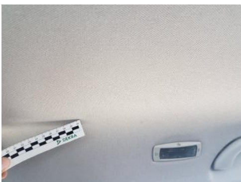
Fot. 39 Podsufitka (Zdjęcie poglądowe 1)