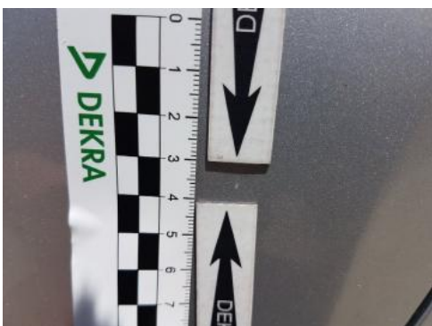
Fot. 35 Drzwi tylne lewe (Wgniec./Odształ.)