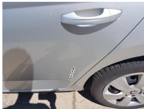
Fot. 34 Drzwi tylne lewe (Zdjęcie poglądowe 1)