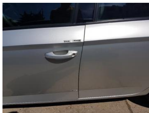
Fot. 36 Drzwi przednie lewe (Zdjęcie poglądowe 1)