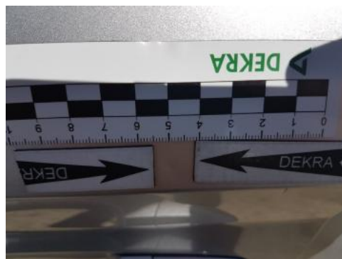
Fot. 38 Drzwi przednie lewe (Wgniec./Odształ.)