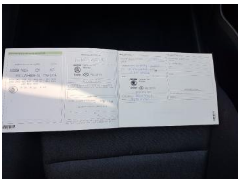
Fot. 23 Książka serwisowa (dane pojazdu)