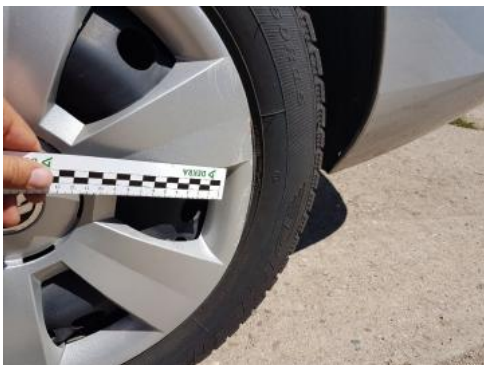
Fot. 33 Kołpak tylny lewy (Rysa/Odprysk)