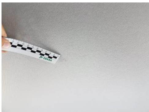
Fot. 41 Podsufitka (zabrudzenie)