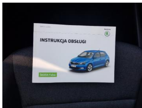
Fot. 24 Instrukcja obsługi