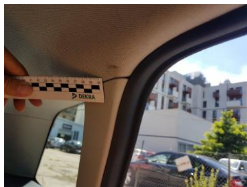
Fot. 42 Podsufitka (zabrudzenie)