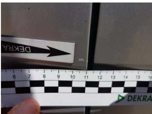
Fot. 37 Drzwi przednie lewe (Rysa/Odprysk)