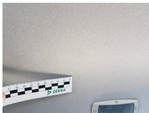
Fot. 40 Podsufitka (zabrudzenie)