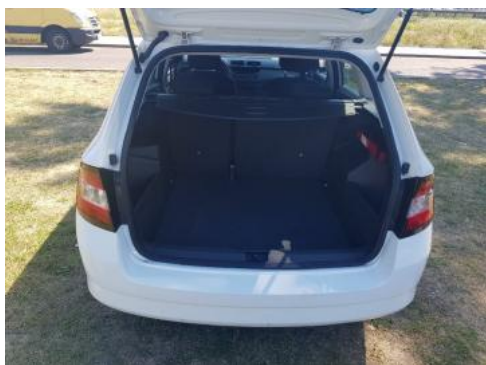
Fot. 17 Bagażnik