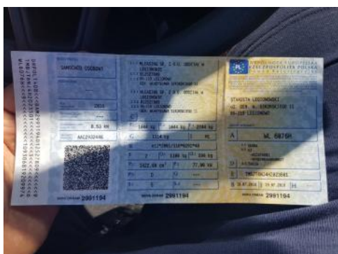
Fot. 21 Dowód rejestracyjny 1. strona