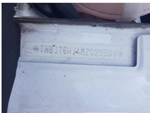
Fot. 7 Pole numerowe