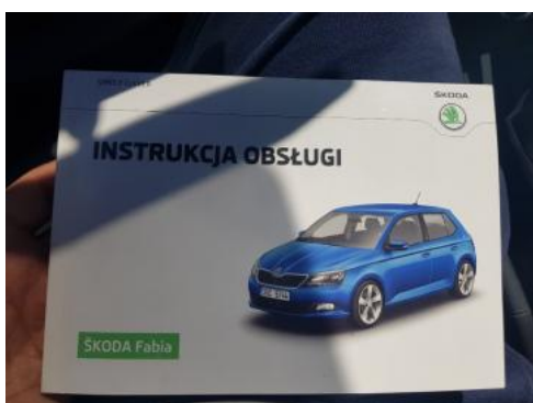
Fot. 23 Instrukcja obsługi