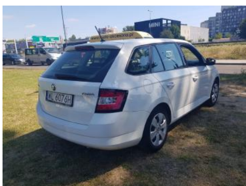
Fot. 3 Prawy bok tył