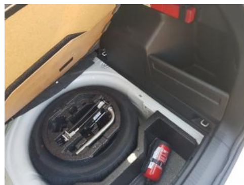
Fot. 18 Koło zapasowe/trójkąt/gaśnica