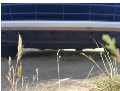
Fot. 19 Spód pojazdu przód