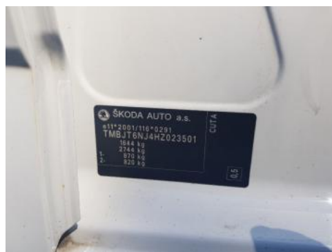
Fot. 8 Tabliczka