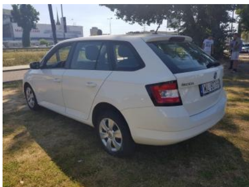
Fot. 5 Lewy bok tył