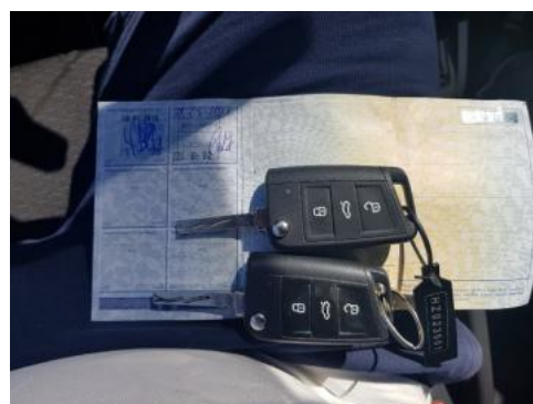
Fot. 22 Dowód rejestracyjny 2. strona / klucze