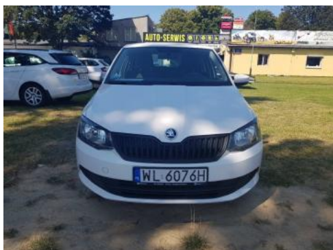
Fot. 1 Przód