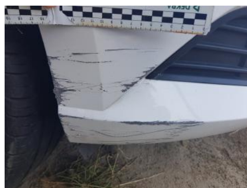
Fot. 24 Zderzak (Rysa/Odprysk)