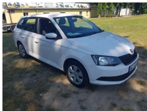
Fot. 2 Prawy bok przód