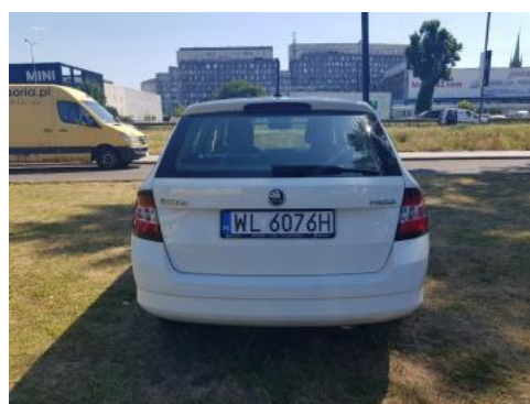
Fot. 4 Tył