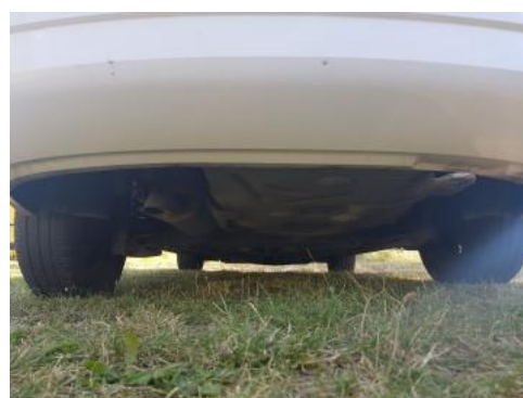
Fot. 20 Spód pojazdu tył