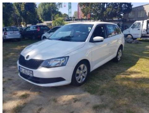
Fot. 6 Lewy bok przód