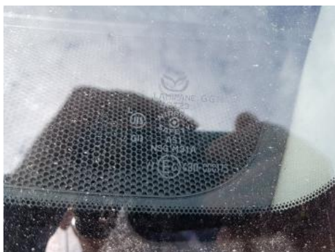
Fot. 29 Szyba czołowa (Rysa/Odprysk)