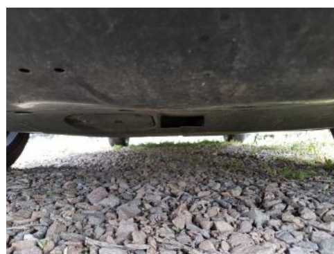
Fot. 20 Spód pojazdu przód