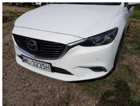
Fot. 26 Zderzak (Zdjęcie poglądowe 1)