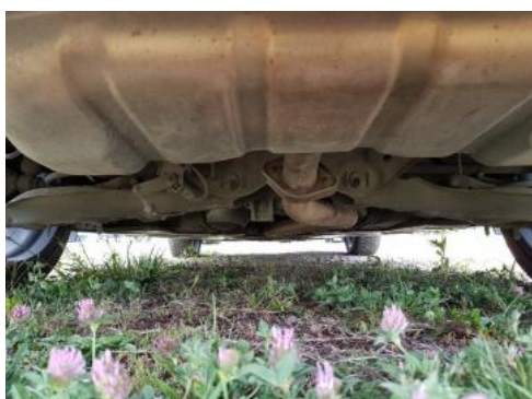
Fot. 21 Spód pojazdu tył