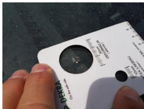
Fot. 30 Szyba czołowa (Rysa/Odprysk 1)