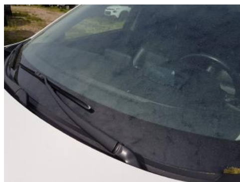
Fot. 28 Szyba czołowa (Zdjęcie poglądowe 1)