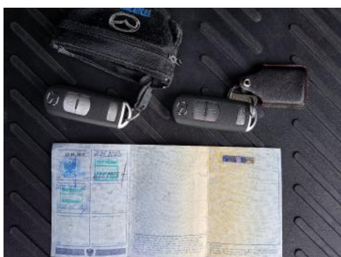
Fot. 23 Dowód rejestracyjny 2. strona / klucze