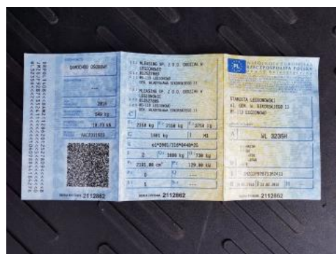
Fot. 22 Dowód rejestracyjny 1. strona