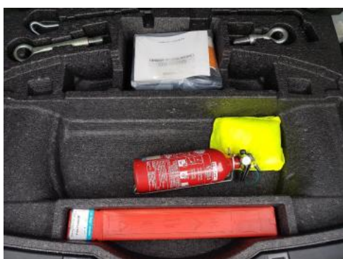
Fot. 19 Koło zapasowe/trójkąt/gaśnica