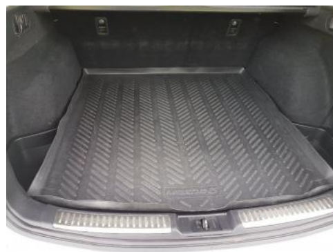
Fot. 18 Bagażnik