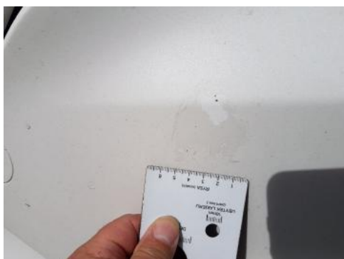
Fot. 27 Zderzak (Rysa/Odprysk)