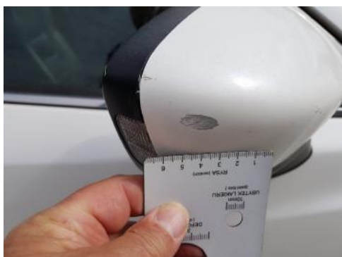
Fot. 31 Lusterko zewnętrzne prawe (Rysa/Odprysk)