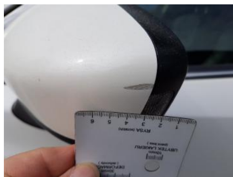
Fot. 32 Lusterko zewnętrzne lewe (Rysa/Odprysk)