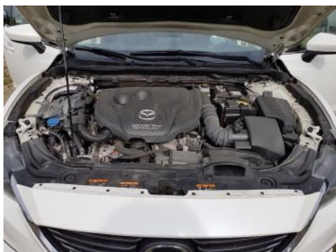
Fot. 17 Komora silnika