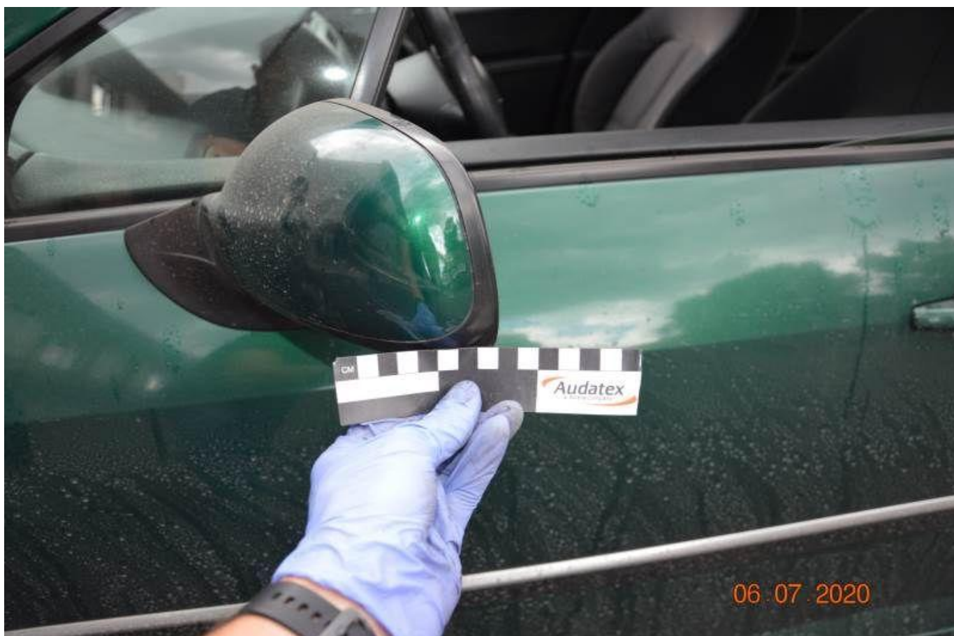
Fot. nr 72