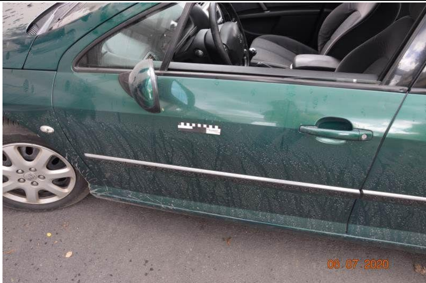
Fot. nr 73