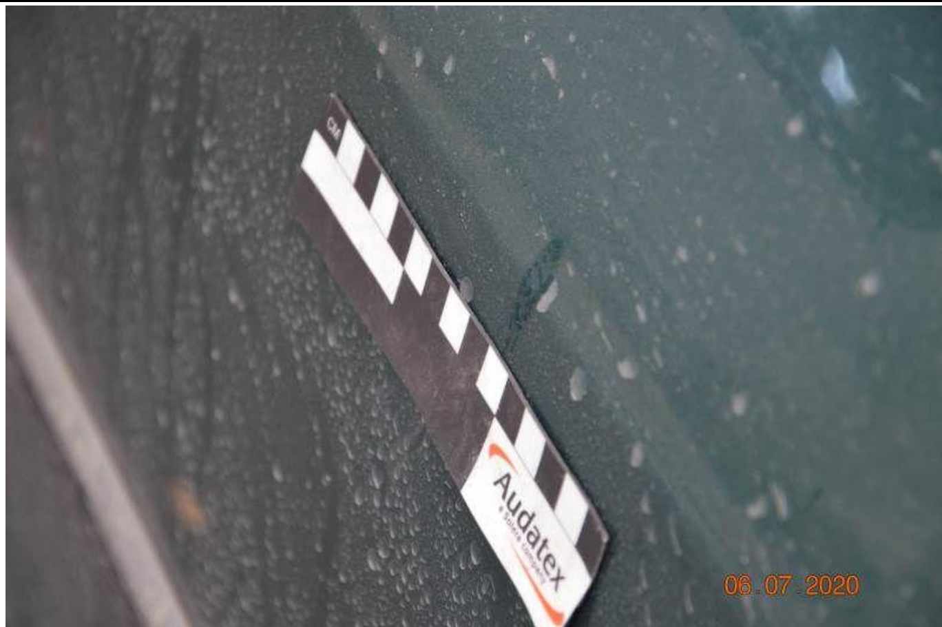
Fot. nr 75