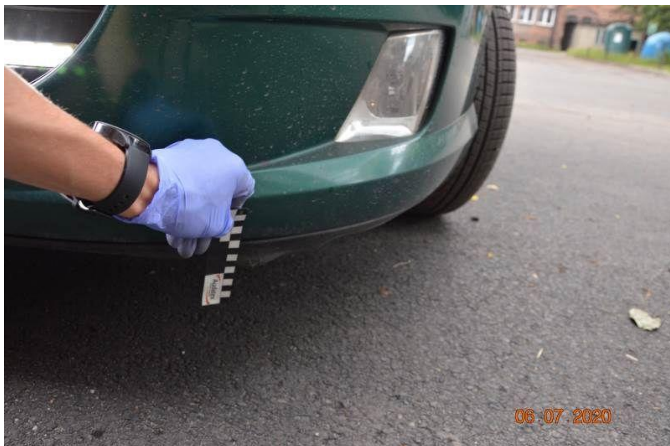
Fot. nr 78