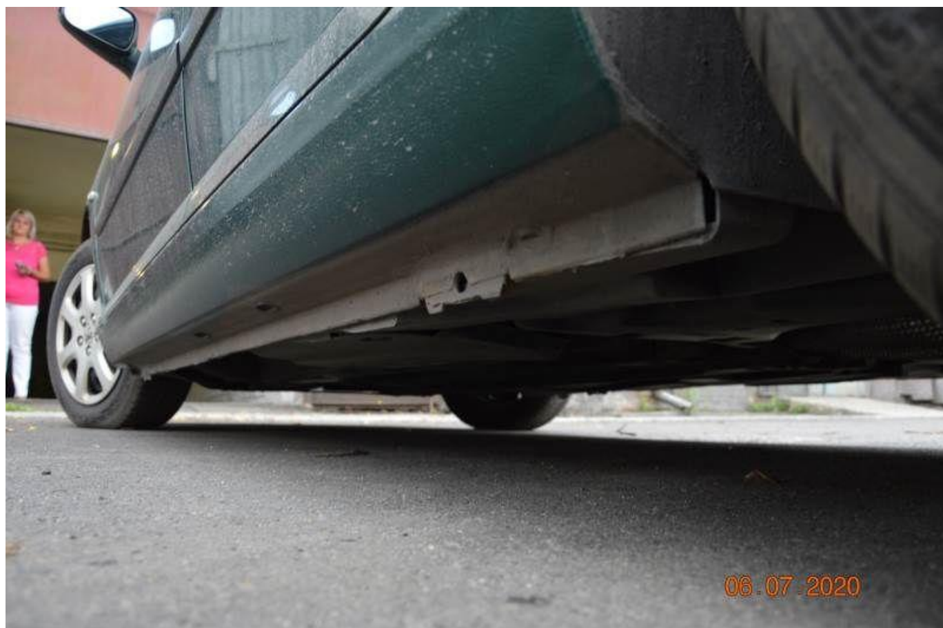
Fot. nr 70