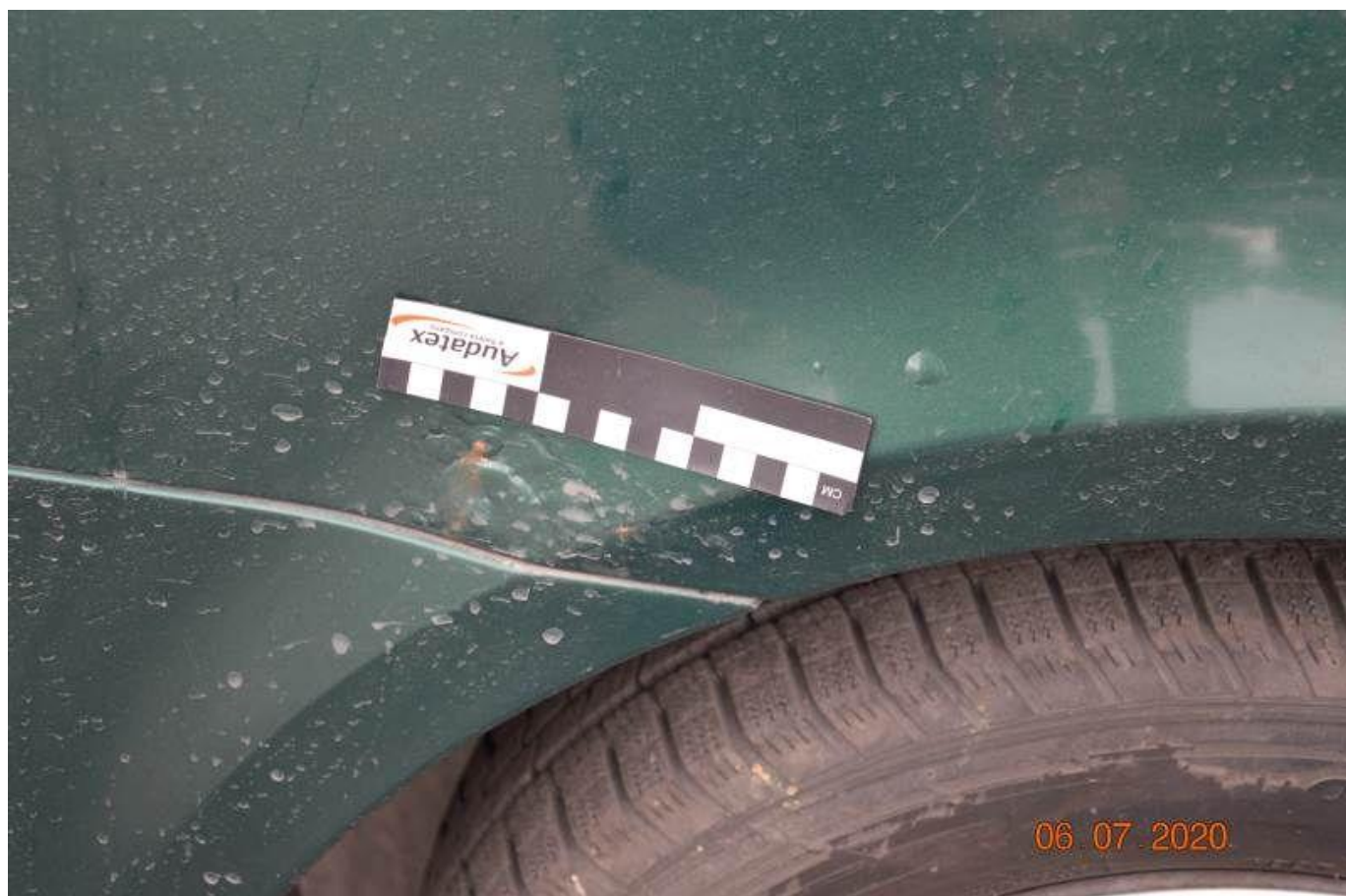
Fot. nr 56