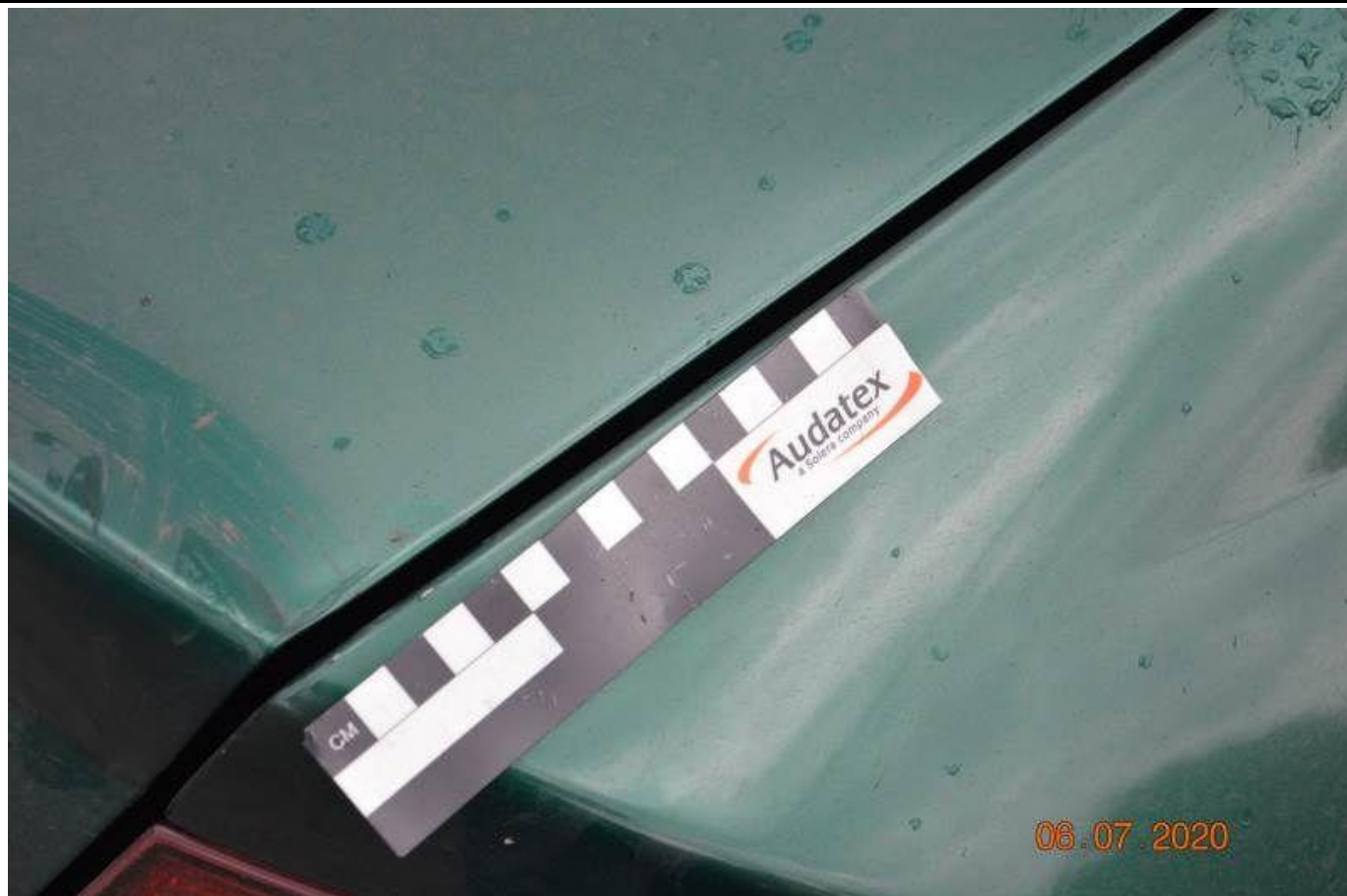
Fot. nr 61