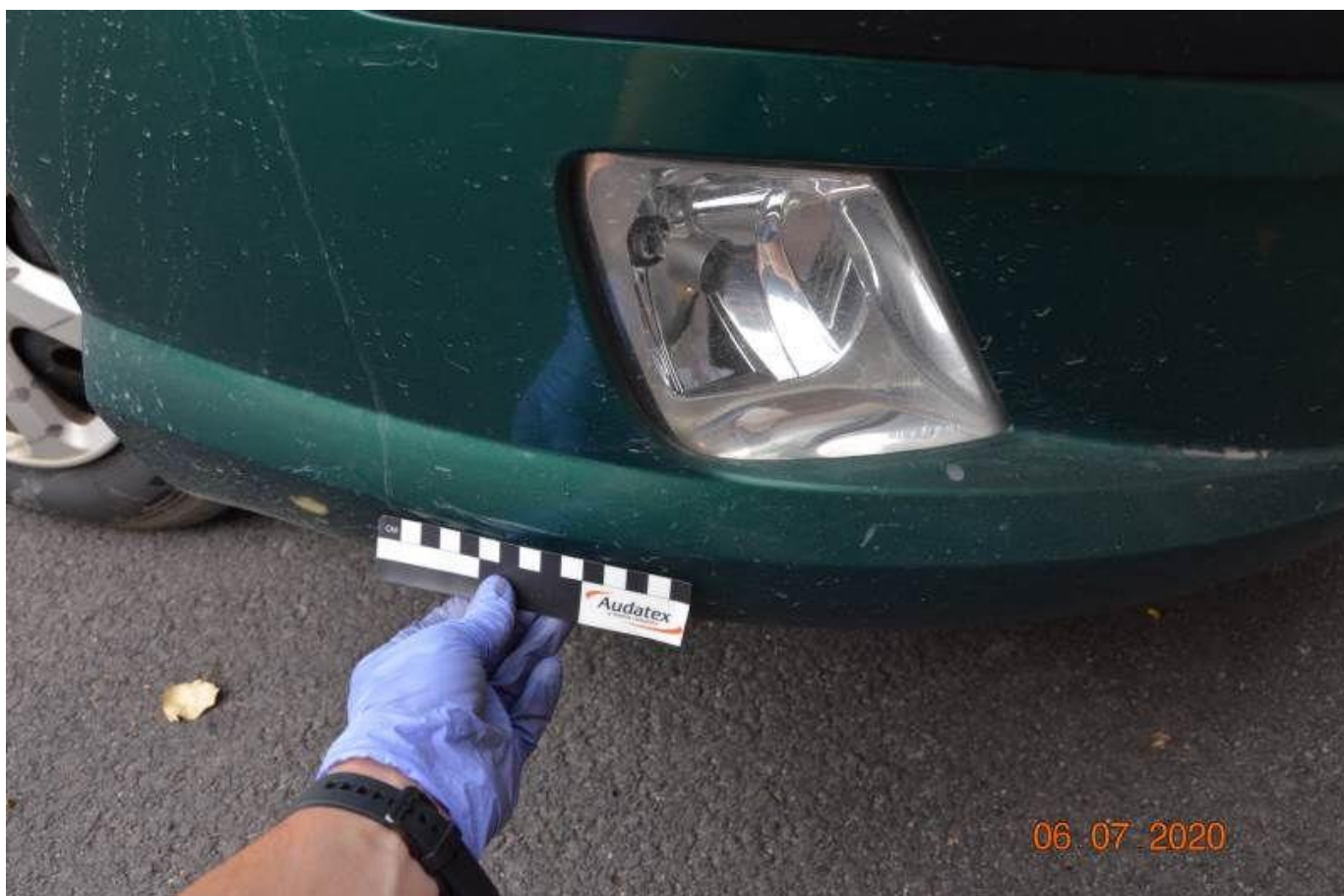
Fot. nr 48