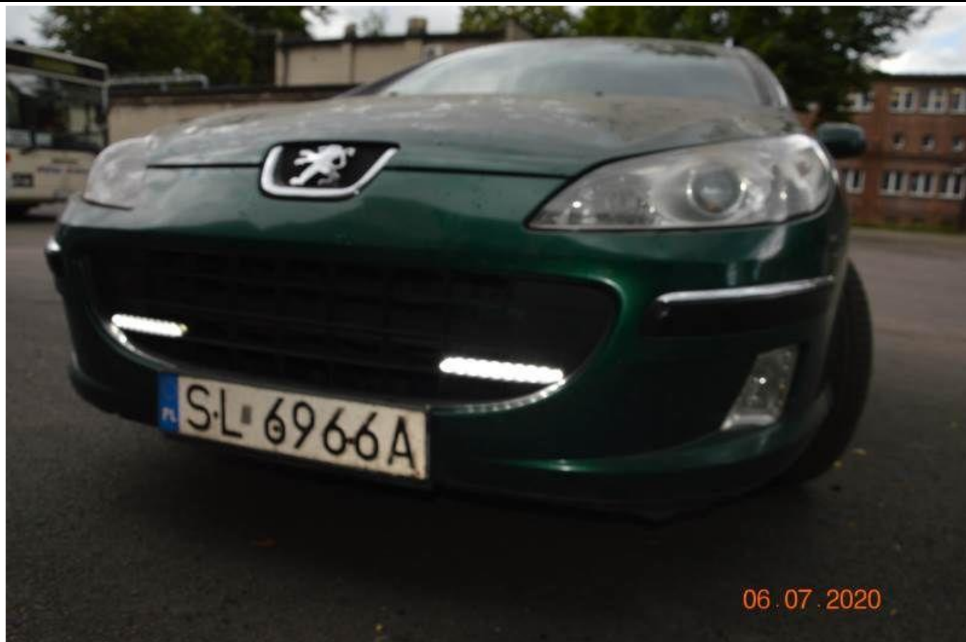
Fot. nr 77