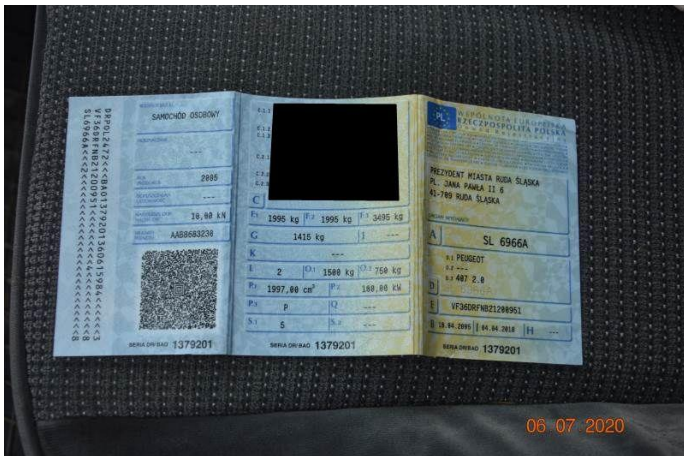
Fot. nr 80