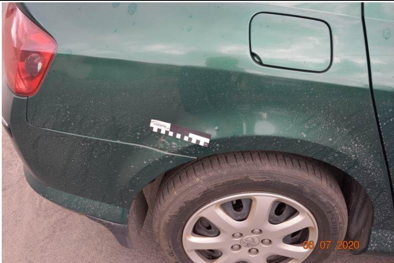
Fot. nr 57