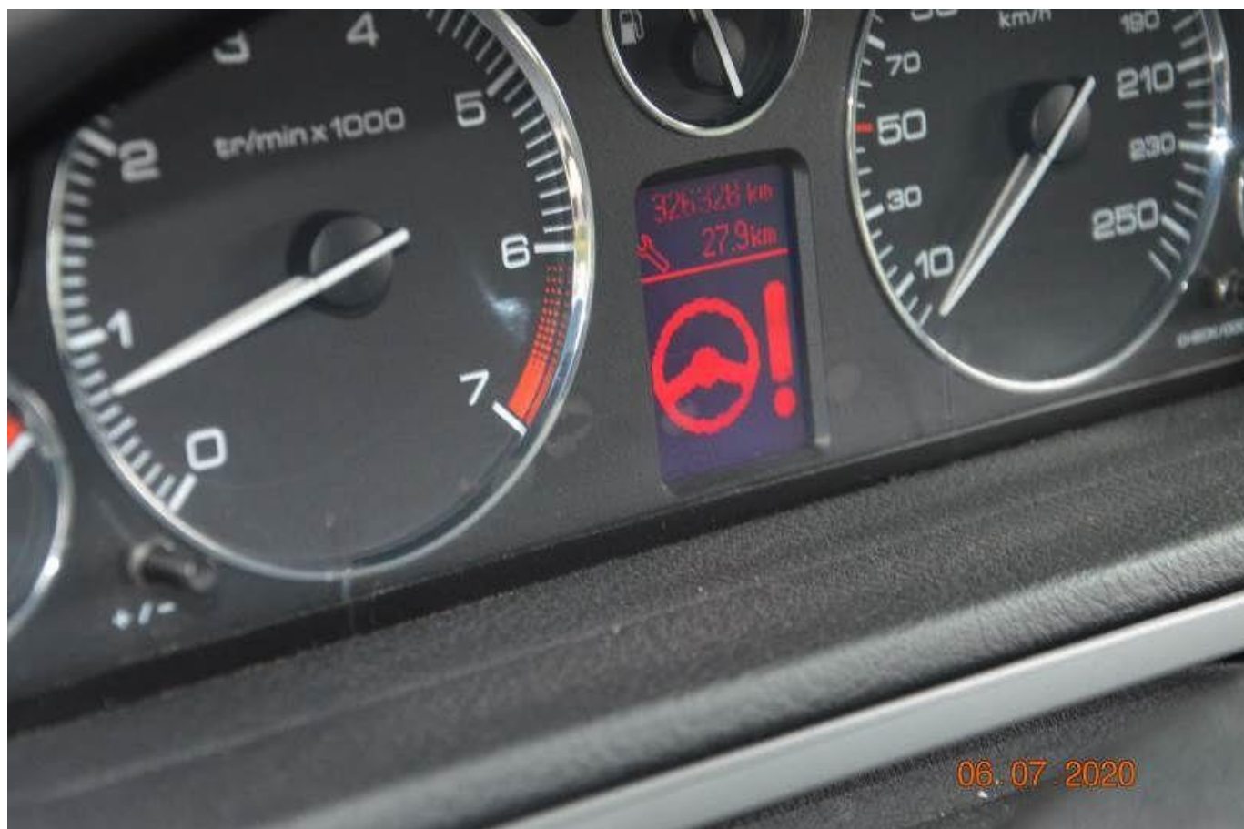
Fot. nr 82