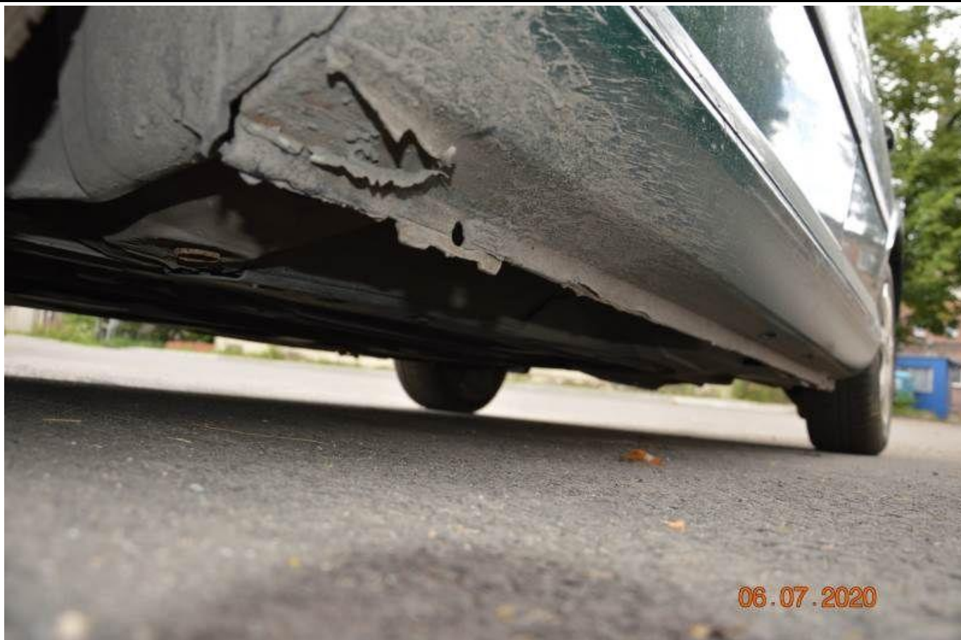
Fot. nr 71