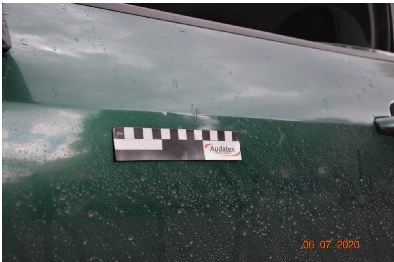
Fot. nr 76