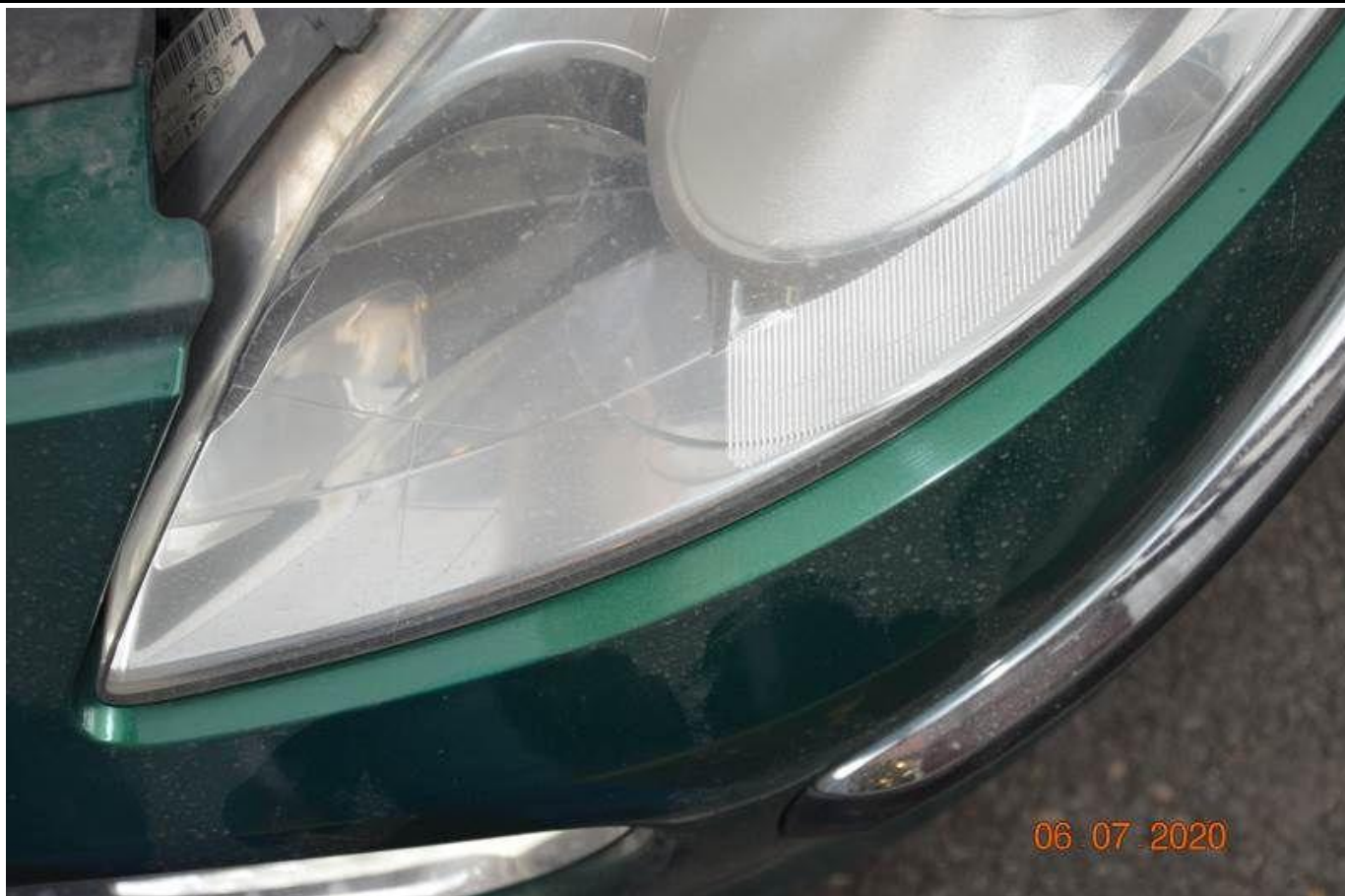
Fot. nr 43