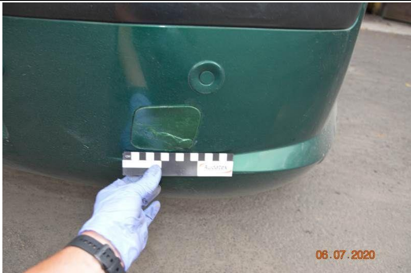
Fot. nr 59