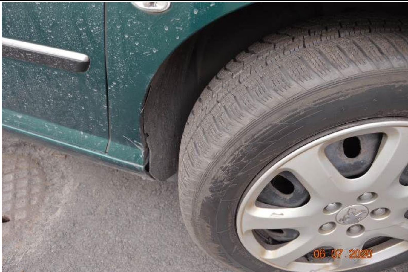
Fot. nr 49