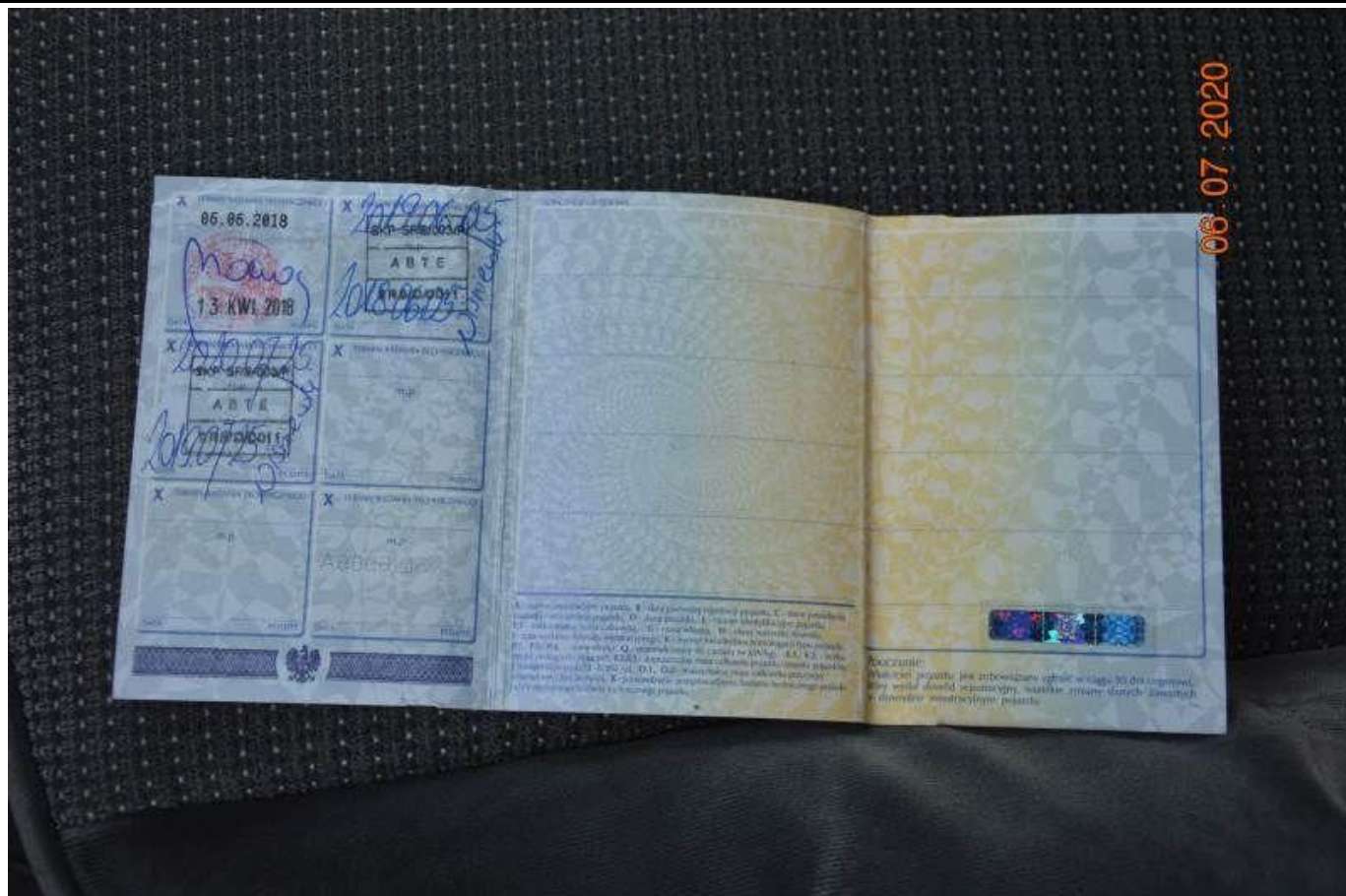
Fot. nr 81