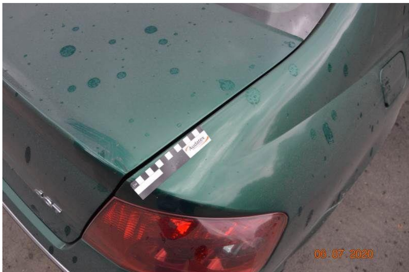
Fot. nr 60