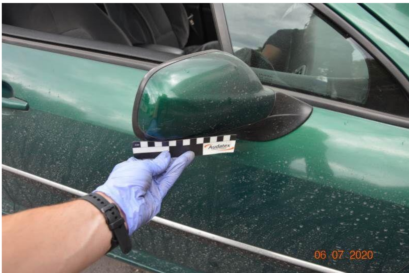
Fot. nr 50