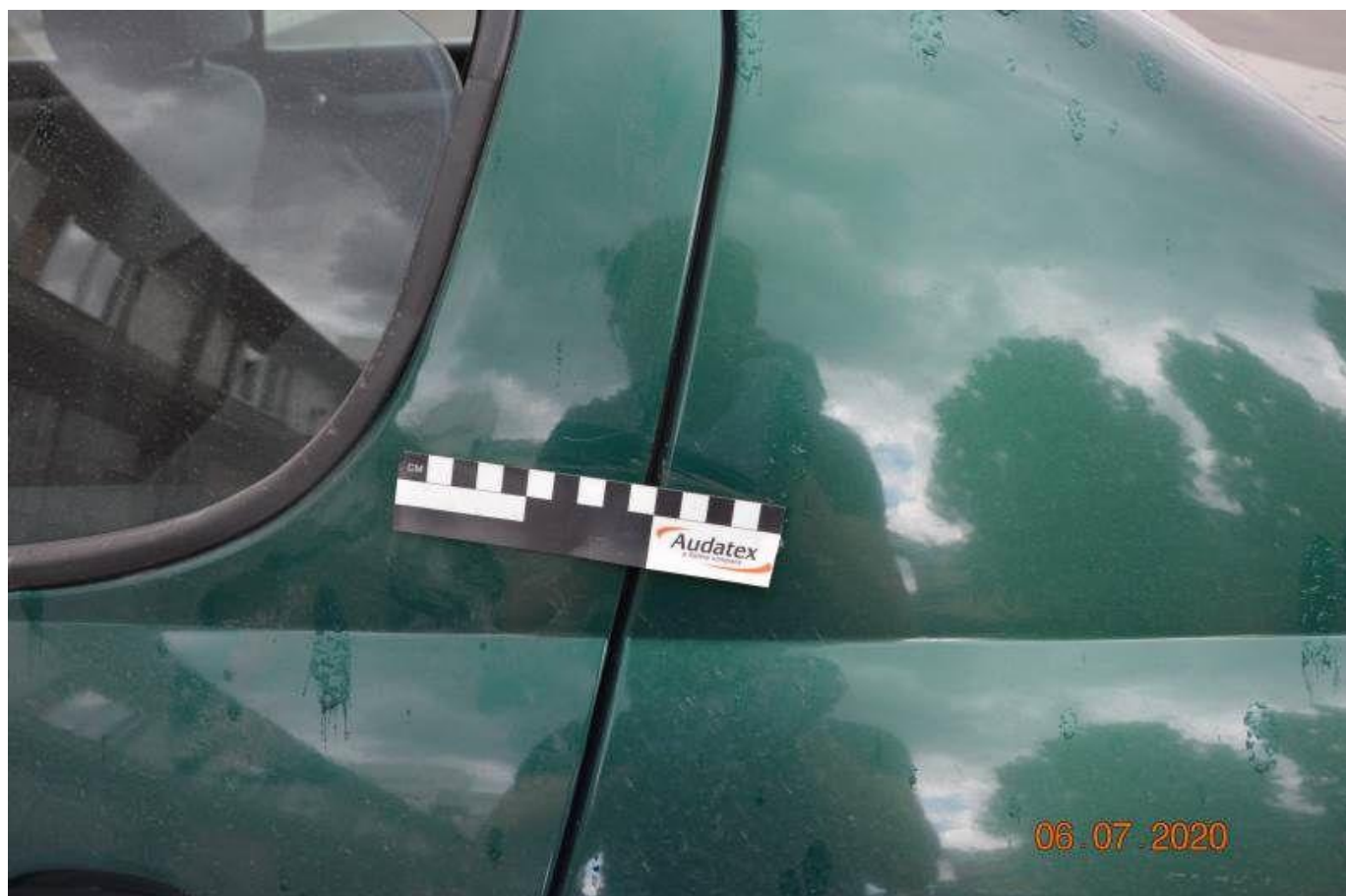
Fot. nr 66