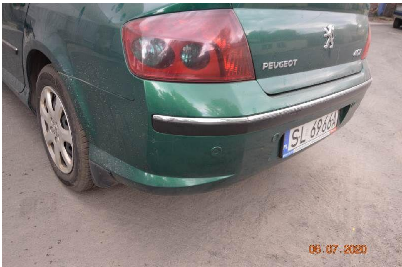
Fot. nr 64