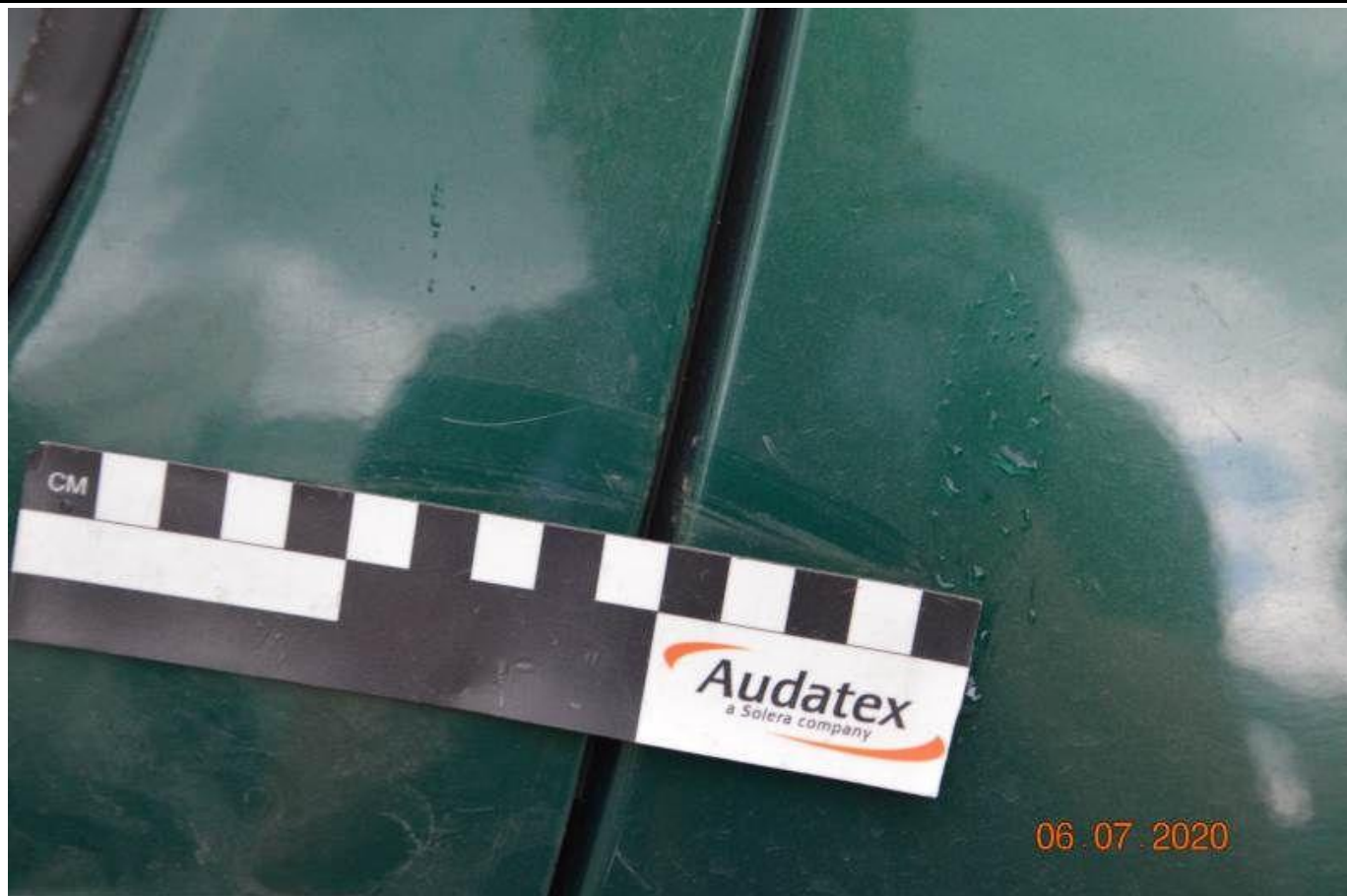
Fot. nr 67