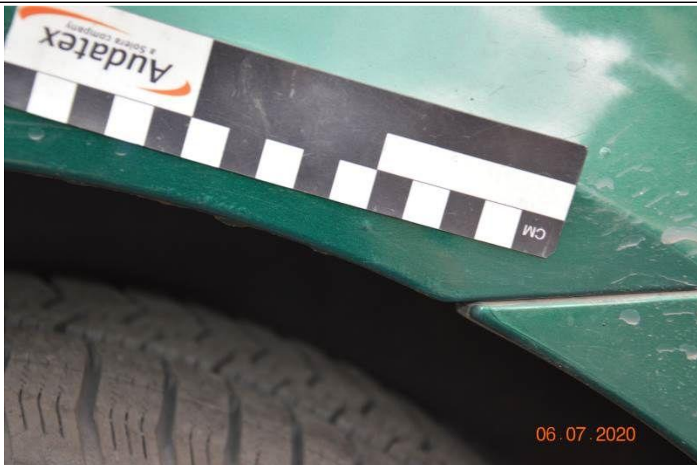
Fot. nr 69