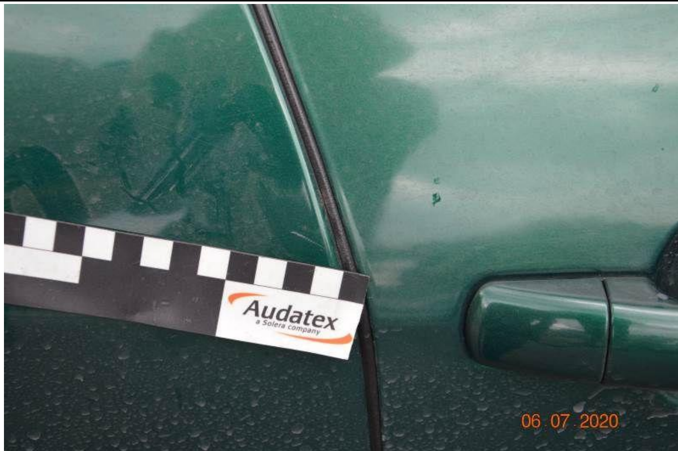
Fot. nr 55