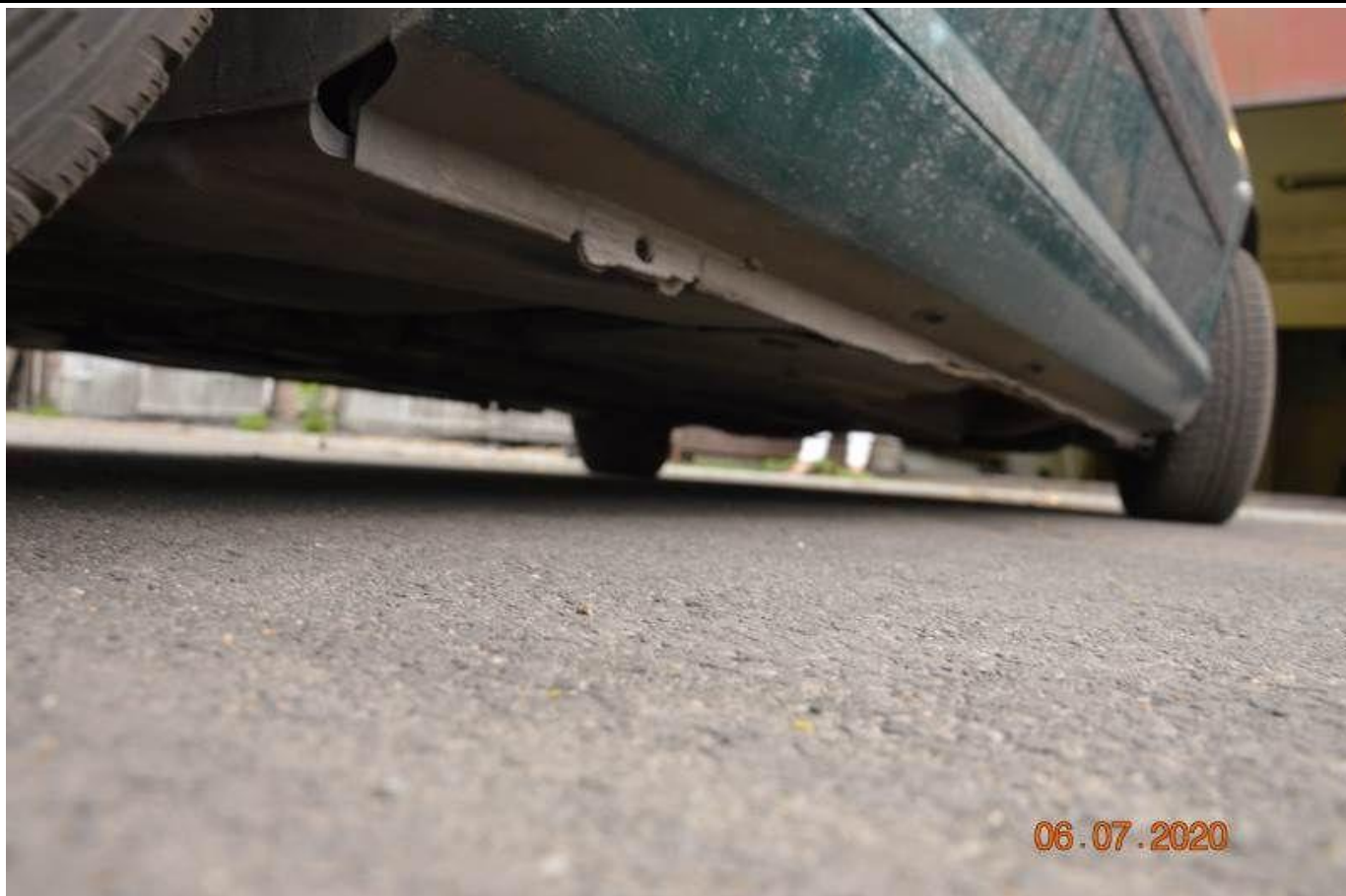
Fot. nr 53