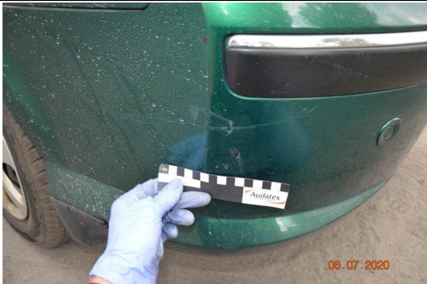
Fot. nr 65