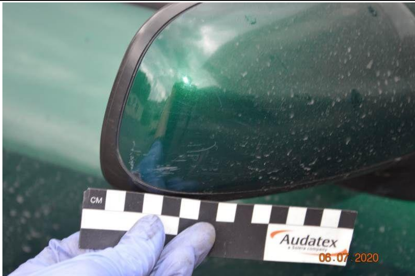
Fot. nr 51