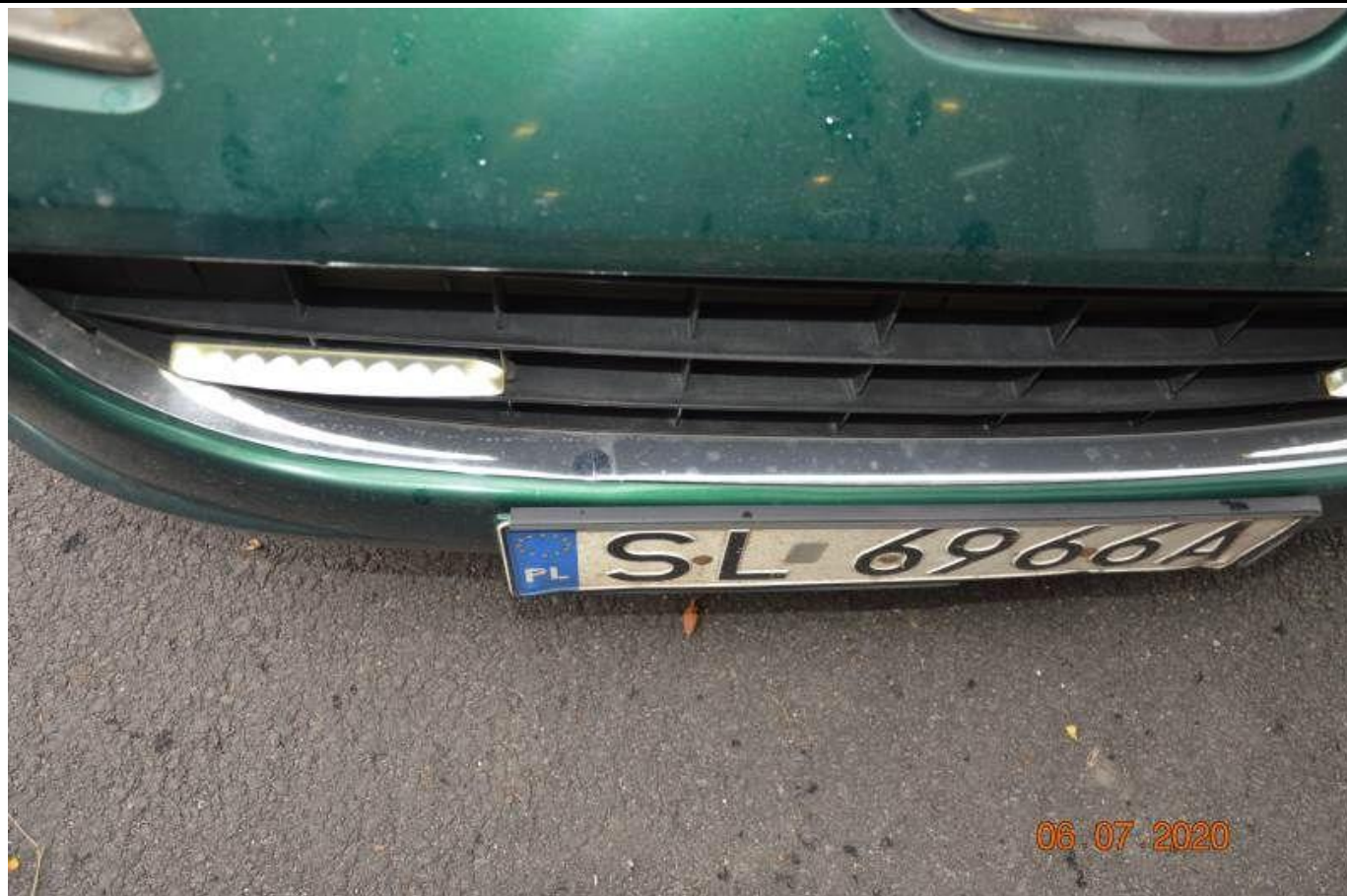
Fot. nr 79