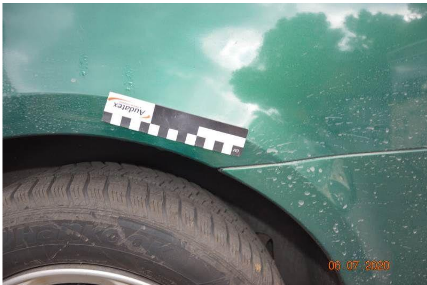
Fot. nr 68