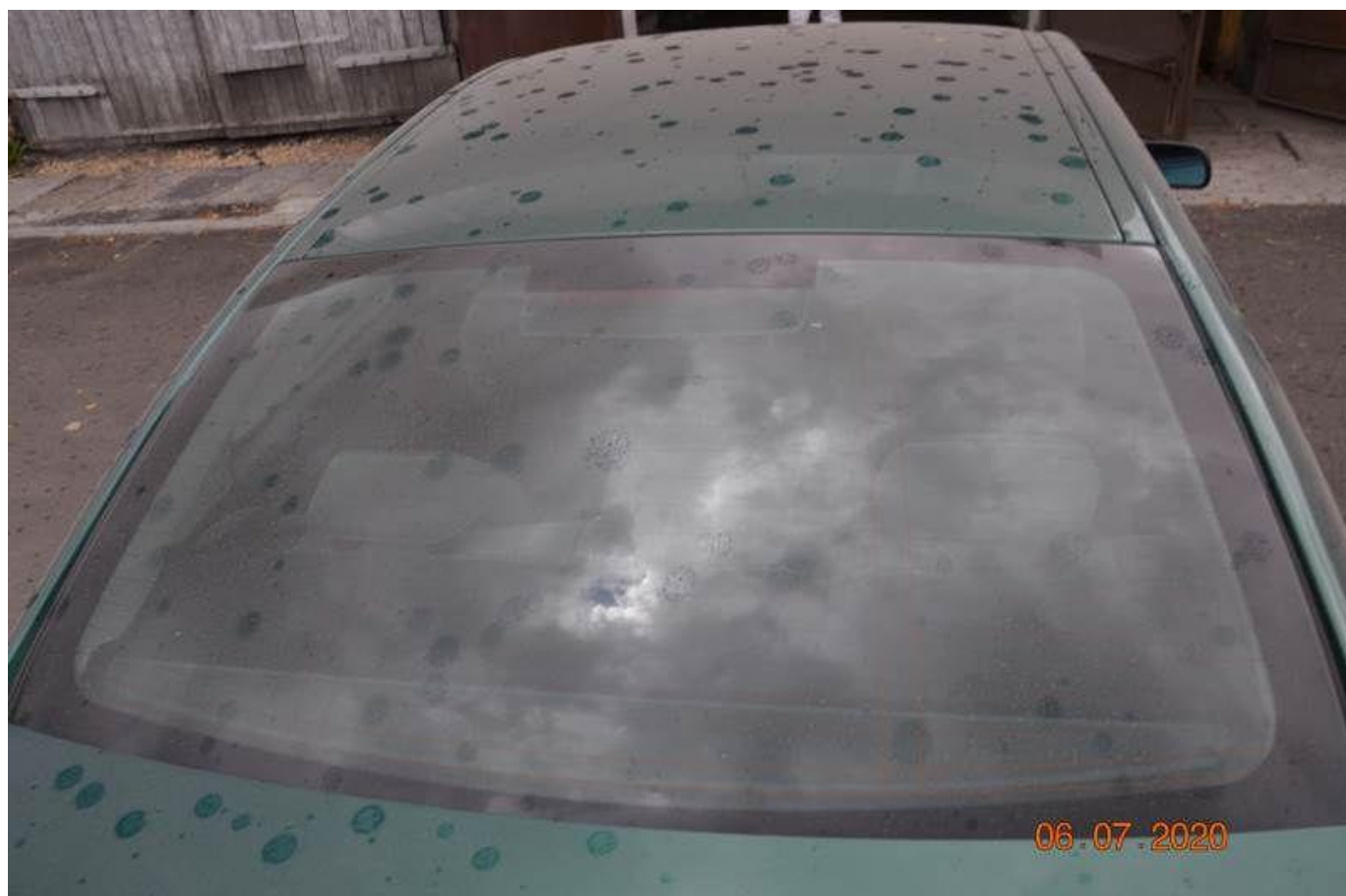
Fot. nr 62