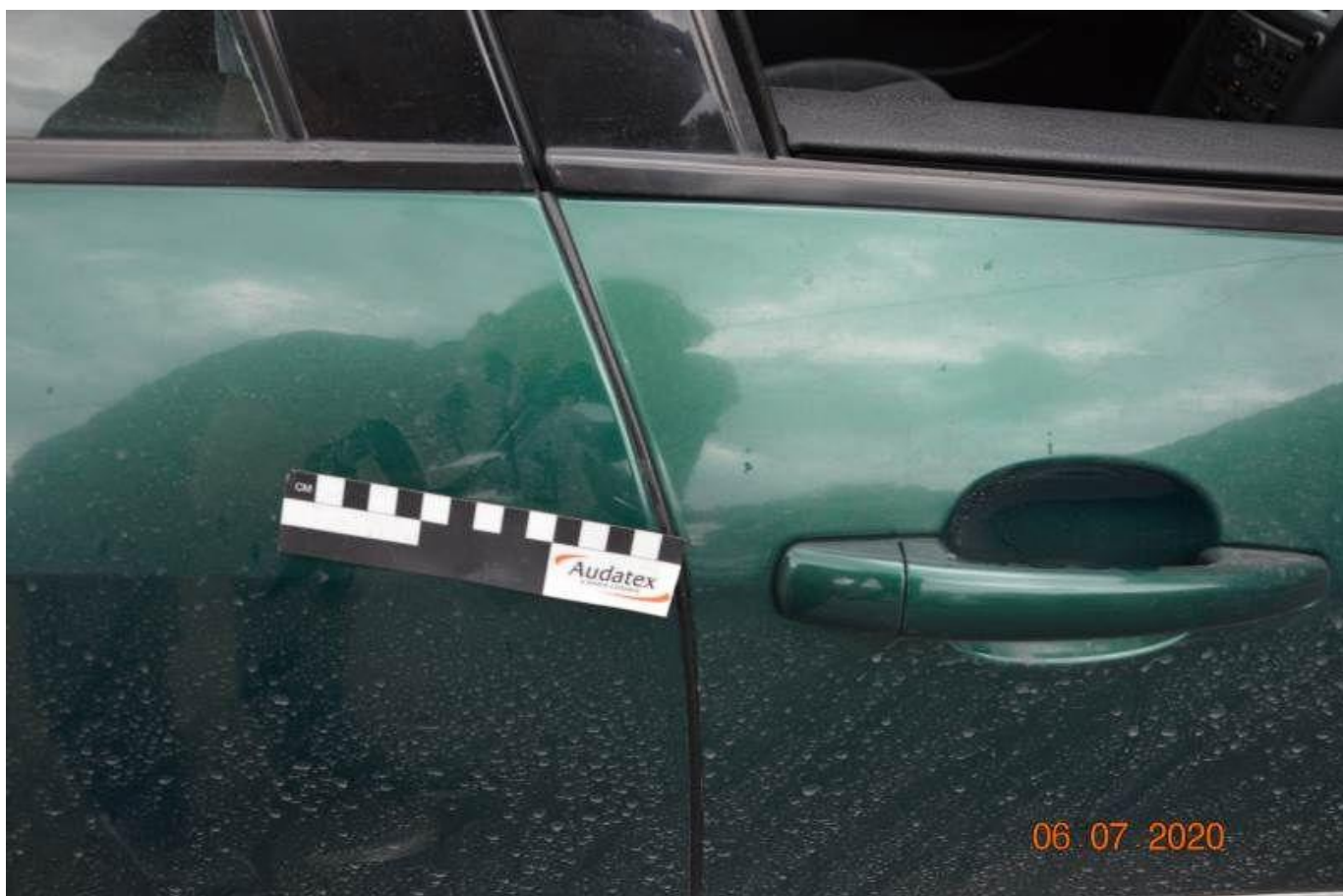
Fot. nr 54