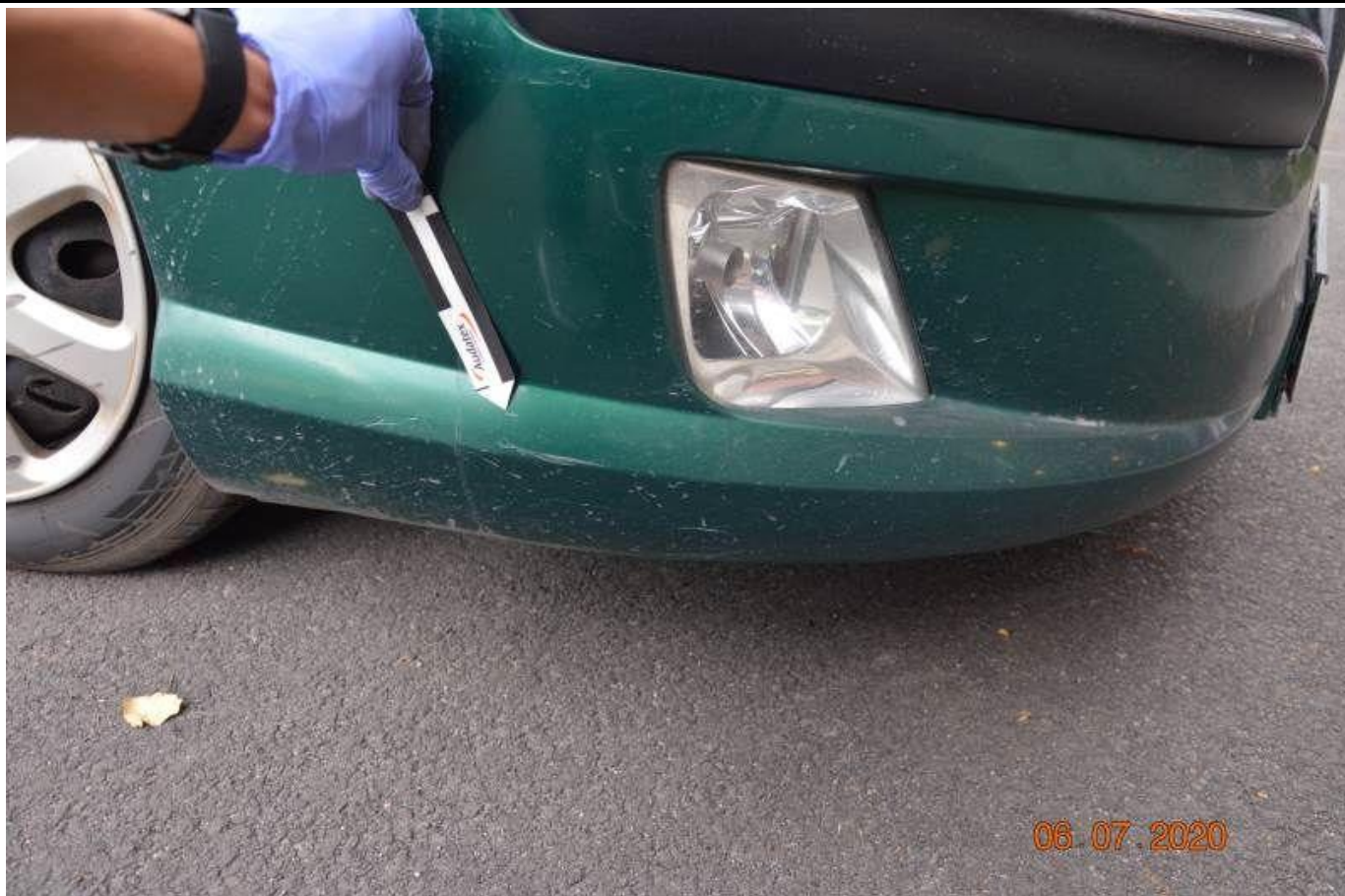
Fot. nr 47