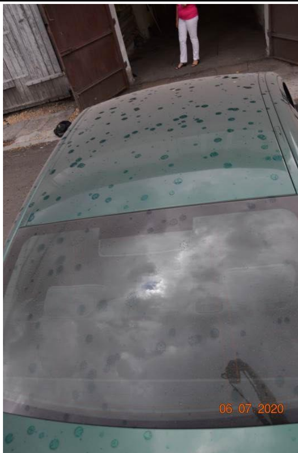
Fot. nr 63