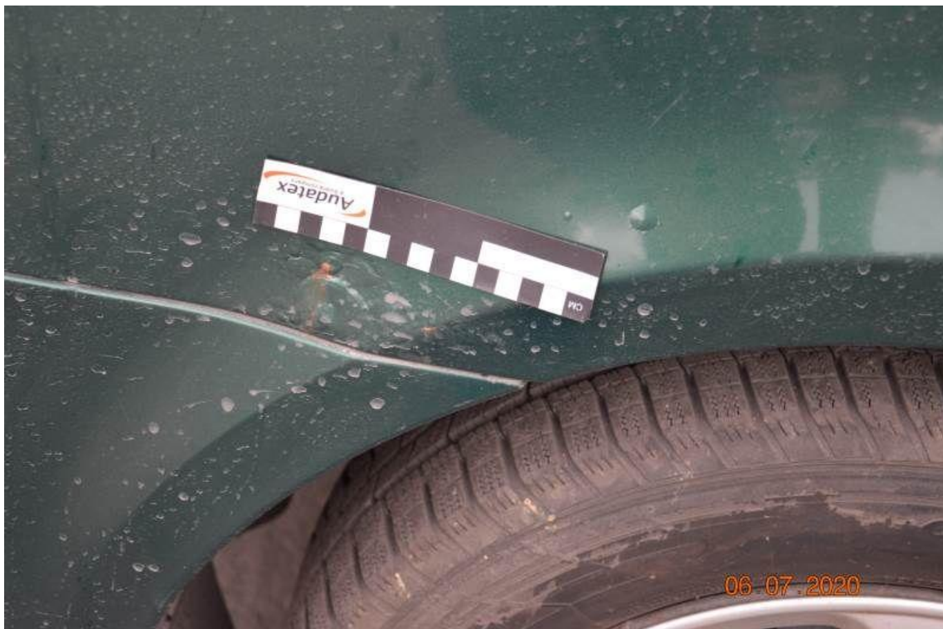
Fot. nr 58