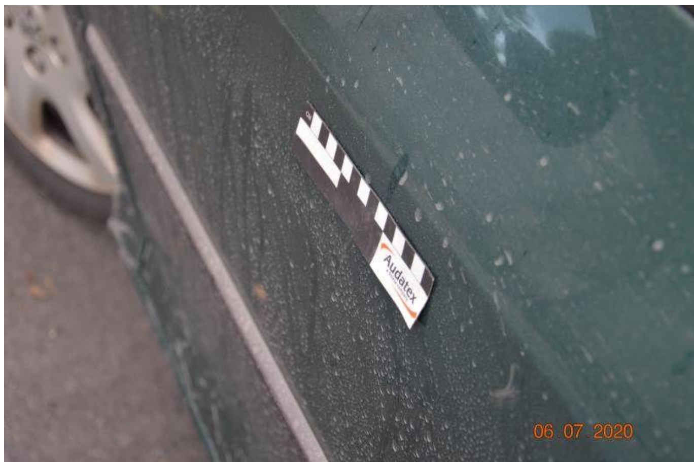
Fot. nr 74