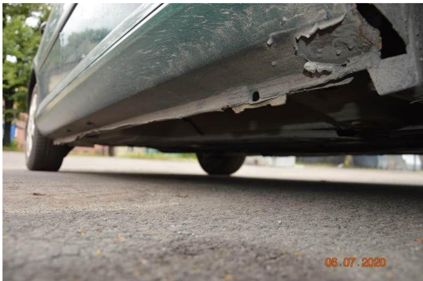
Fot. nr 52