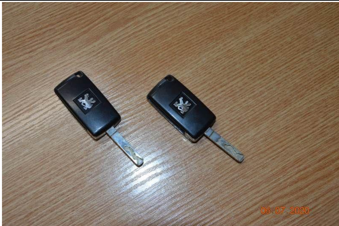
Fot. nr 83

Dokument wystawiony elektronicznie, w tym bez podpisu