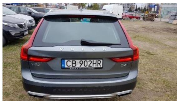
Fot. 4 Tył