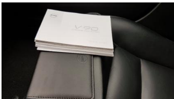
Fot. 27 Instrukcja obsługi