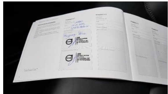
Fot. 26 Książka serwisowa - ostatni przegląd