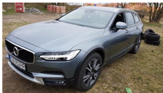
Fot. 6 Lewy bok przód