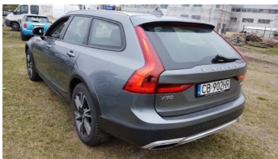
Fot. 5 Lewy bok tył