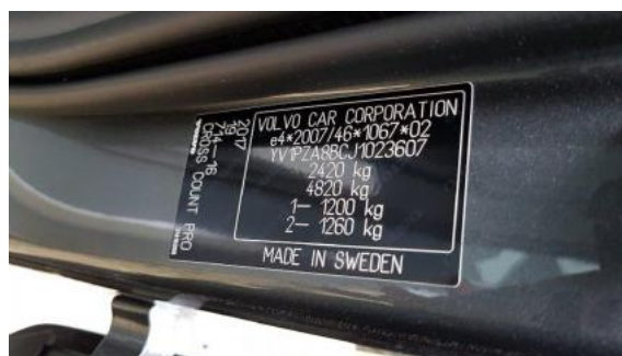
Fot. 8 Tabliczka