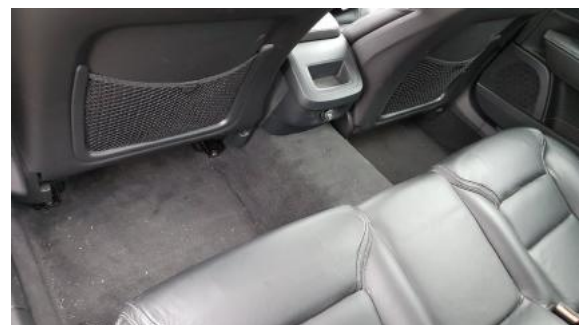
Fot. 28 Brak dywaników tylnych