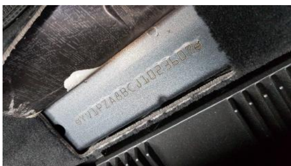
Fot. 7 Pole numerowe