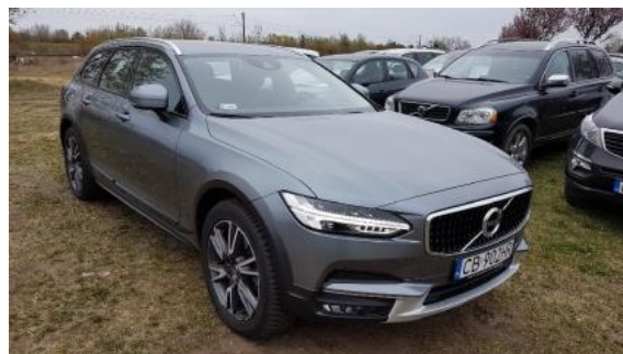
Fot. 2 Prawy bok przód