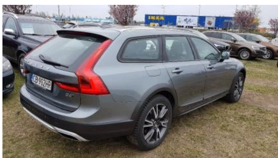
Fot. 3 Prawy bok tył