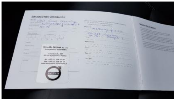
Fot. 25 Książka serwisowa (dane pojazdu)