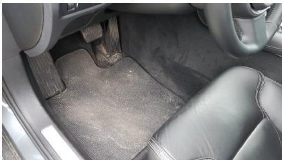
Fot. 29 Zabrudzone wnętrze