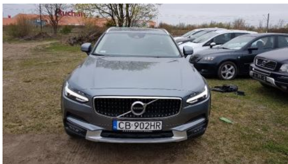
Fot. 1 Przód