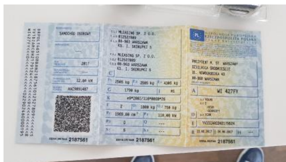
Fot. 21 Dowód rejestracyjny 1. strona