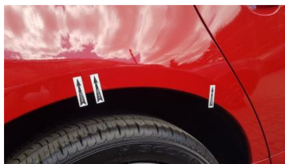
Fot. 28 Błotnik tylny prawy/ściana boczna prawa (Wgniecie./Odształ.)