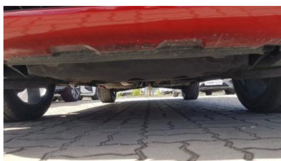
Fot. 19 Spód pojazdu przód