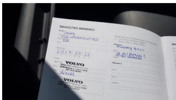
Fot. 23 Książka serwisowa (dane pojazdu)