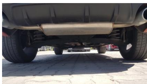
Fot. 20 Spód pojazdu tył