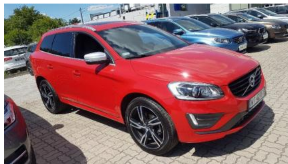
Fot. 2 Prawy bok przód