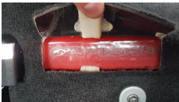
Fot. 7 Pole numerowe