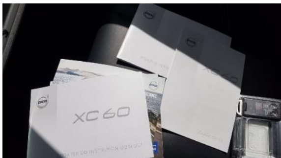
Fot. 25 Zdjęcie do protokołu