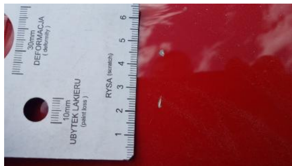
Fot. 26 Pokrywa komory silnika (Rysa/Odprysk)