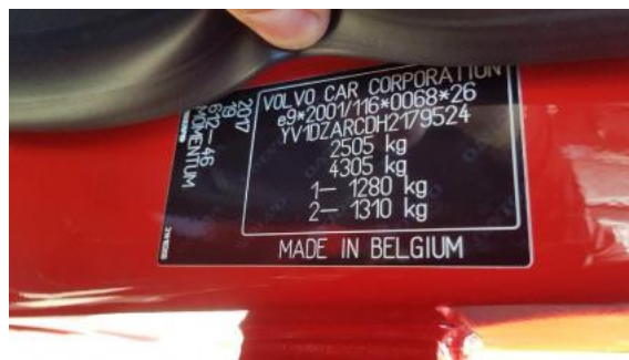
Fot. 8 Tabliczka