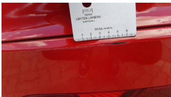
Fot. 29 Zderzak tylny (Rysa/Odprysk)