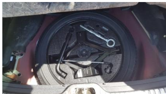
Fot. 18 Koło zapasowe/trójkąt/gaśnica