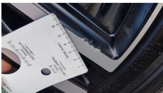
Fot. 27 Felga przednia prawa (Rysa/Odprysk)