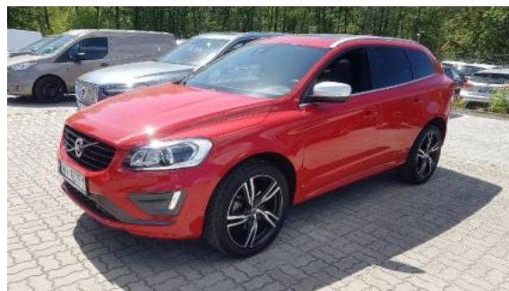
Fot. 6 Lewy bok przód