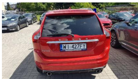
Fot. 4 Tył