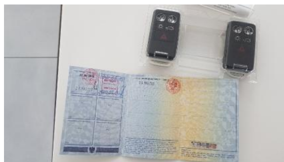
Fot. 22 Dowód rejestracyjny 2. strona / klucze