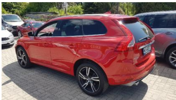
Fot. 5 Lewy bok tył