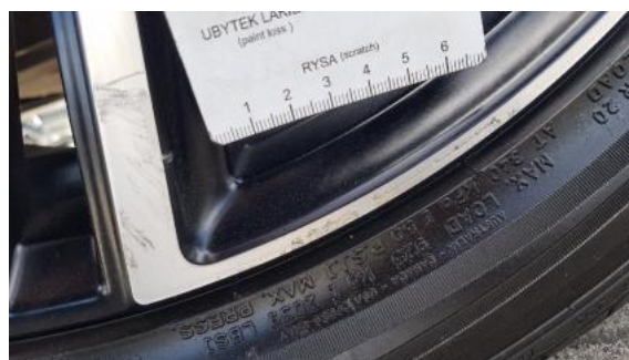
Fot. 32 Felga przednia lewa (Rysa/Odprysk)