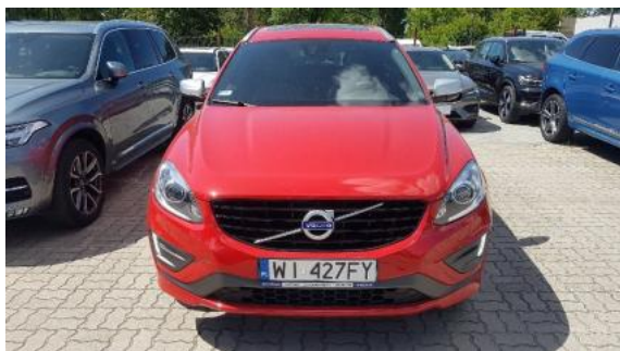
Fot. 1 Przód