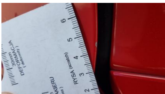
Fot. 31 Drzwi przednie lewe (Rysa/Odprysk)