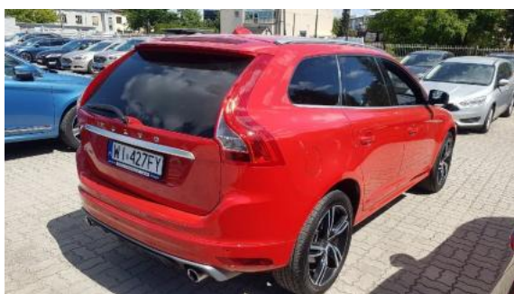
Fot. 3 Prawy bok tył