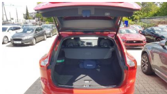
Fot. 17 Bagażnik