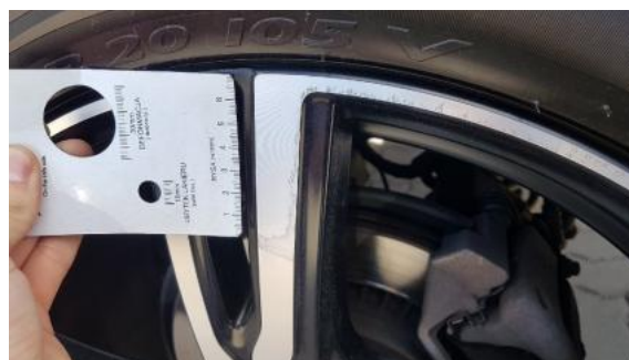
Fot. 30 Felga tylna lewa (Rysa/Odprysk)