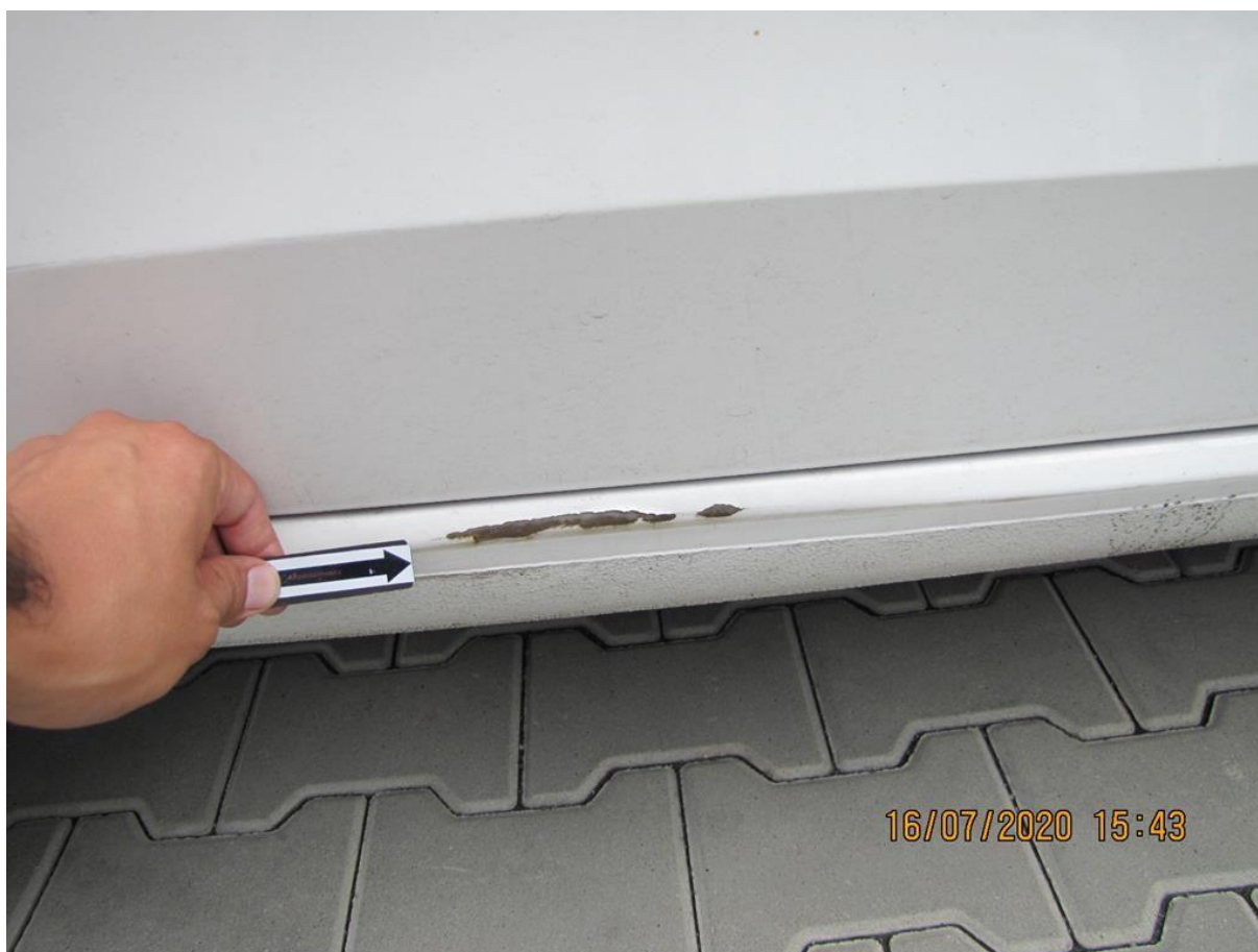
Fot. nr 56