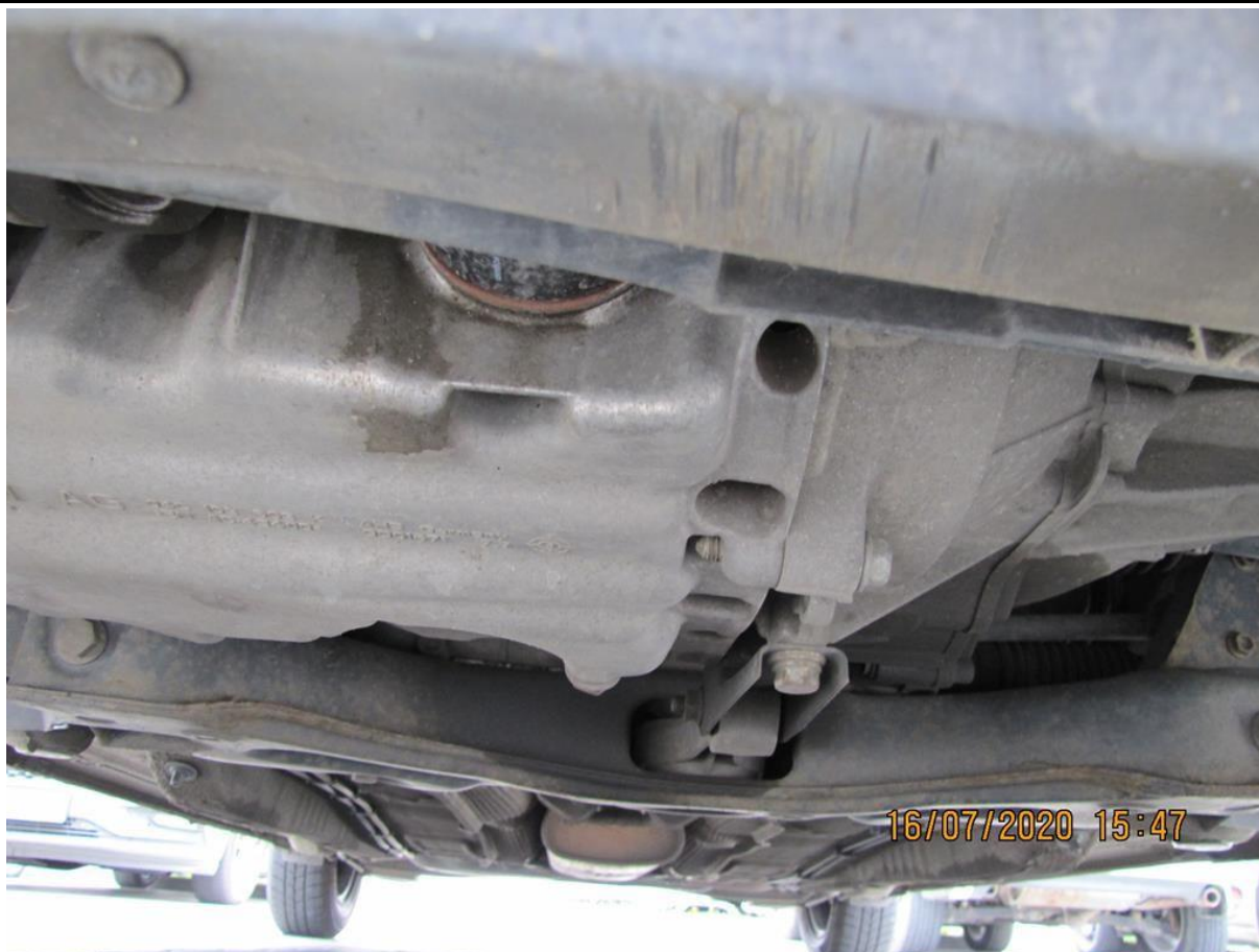
Fot. nr 109