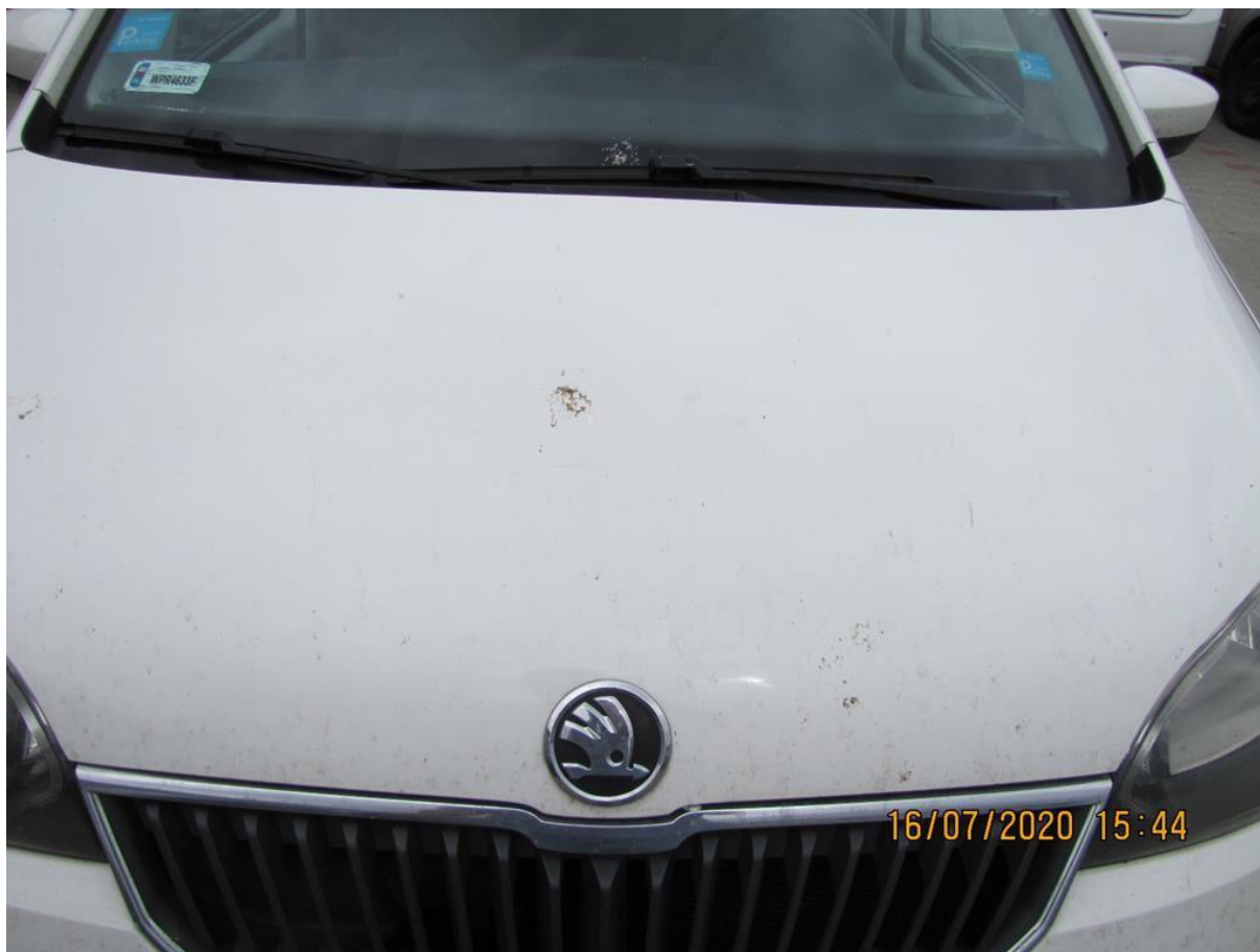
Fot. nr 78