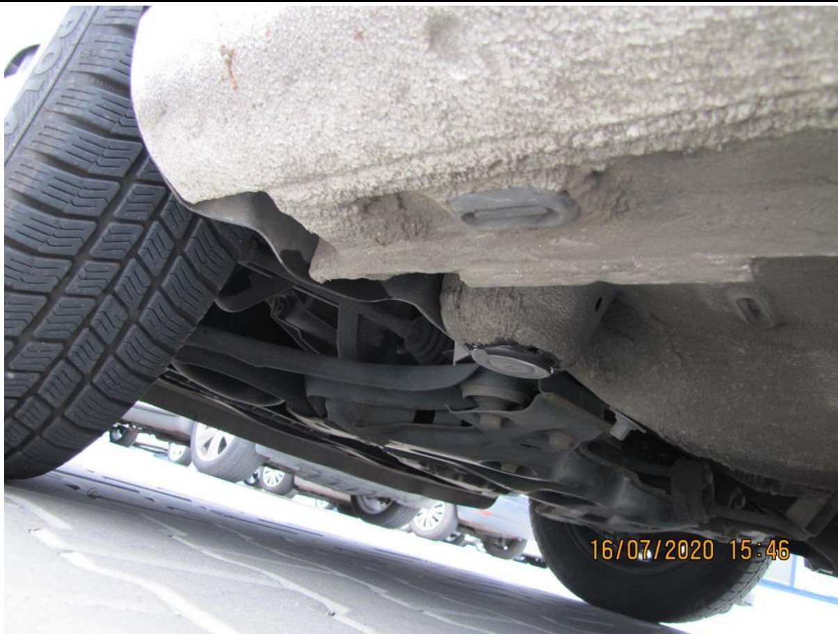
Fot. nr 95