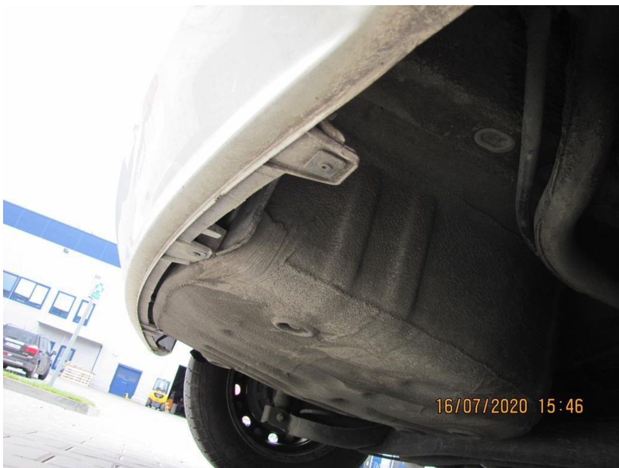
Fot. nr 102