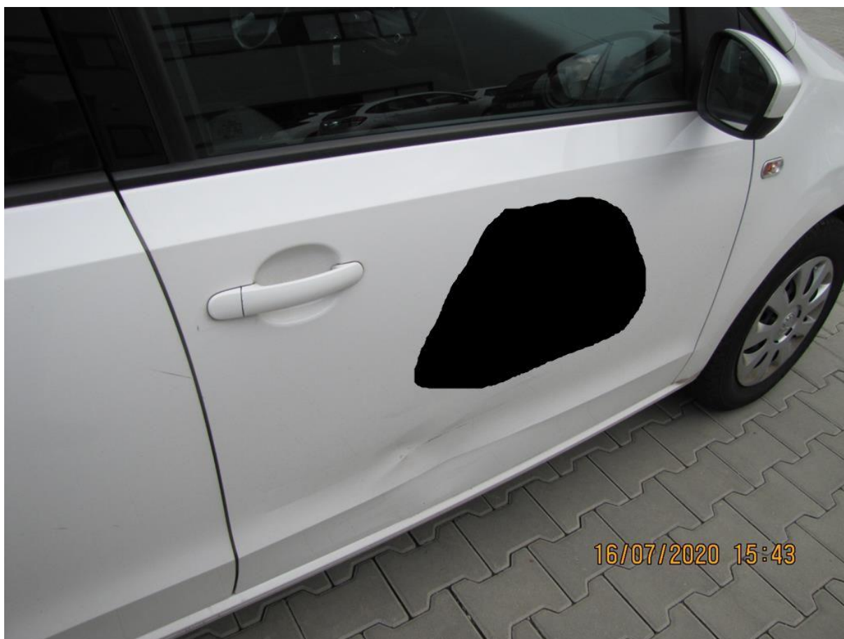
Fot. nr 60