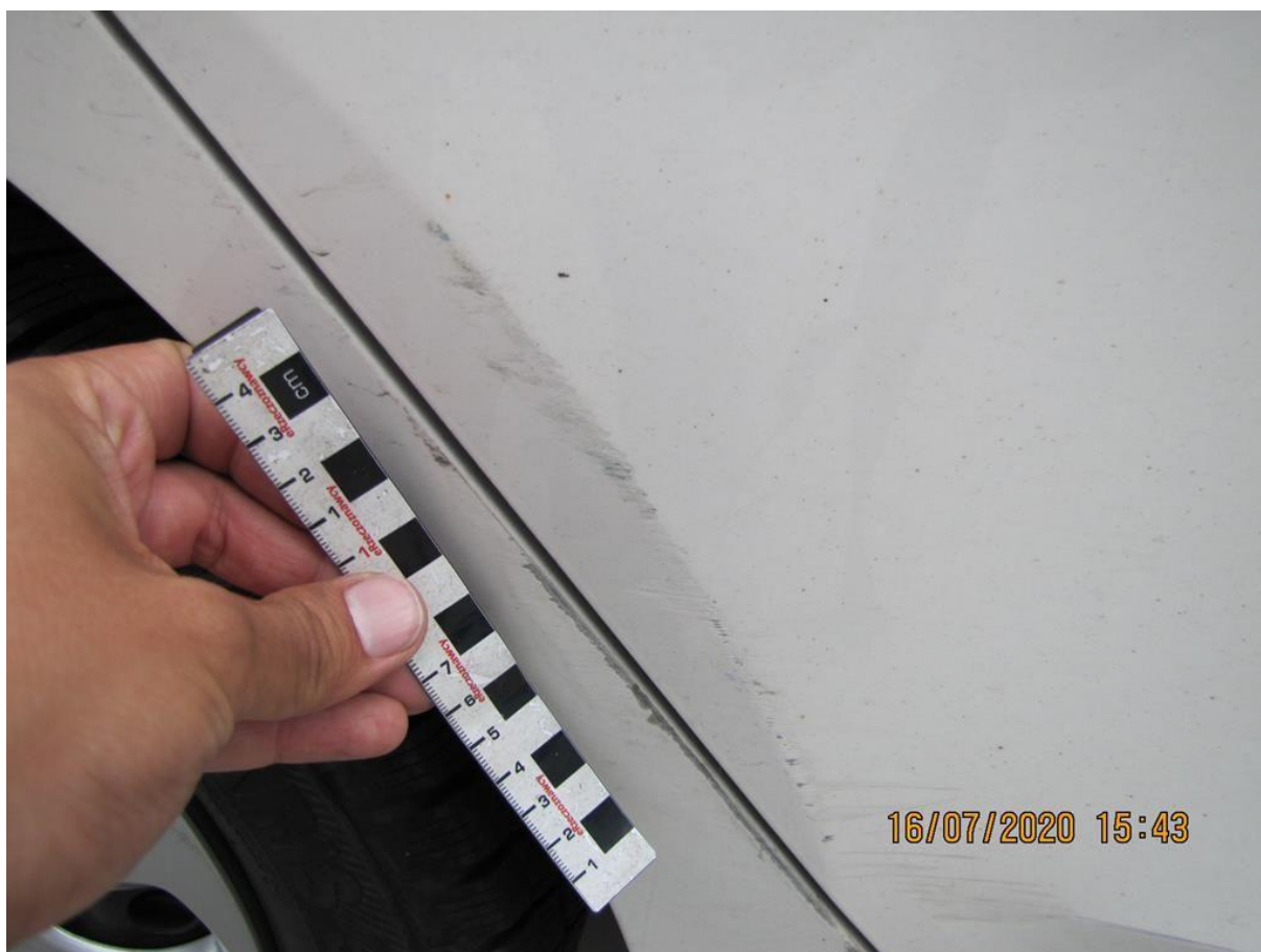
Fot. nr 54