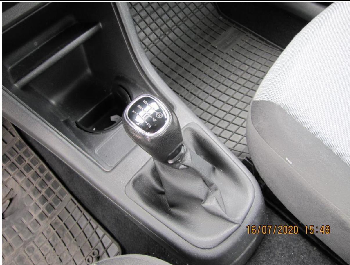
Fot. nr 111