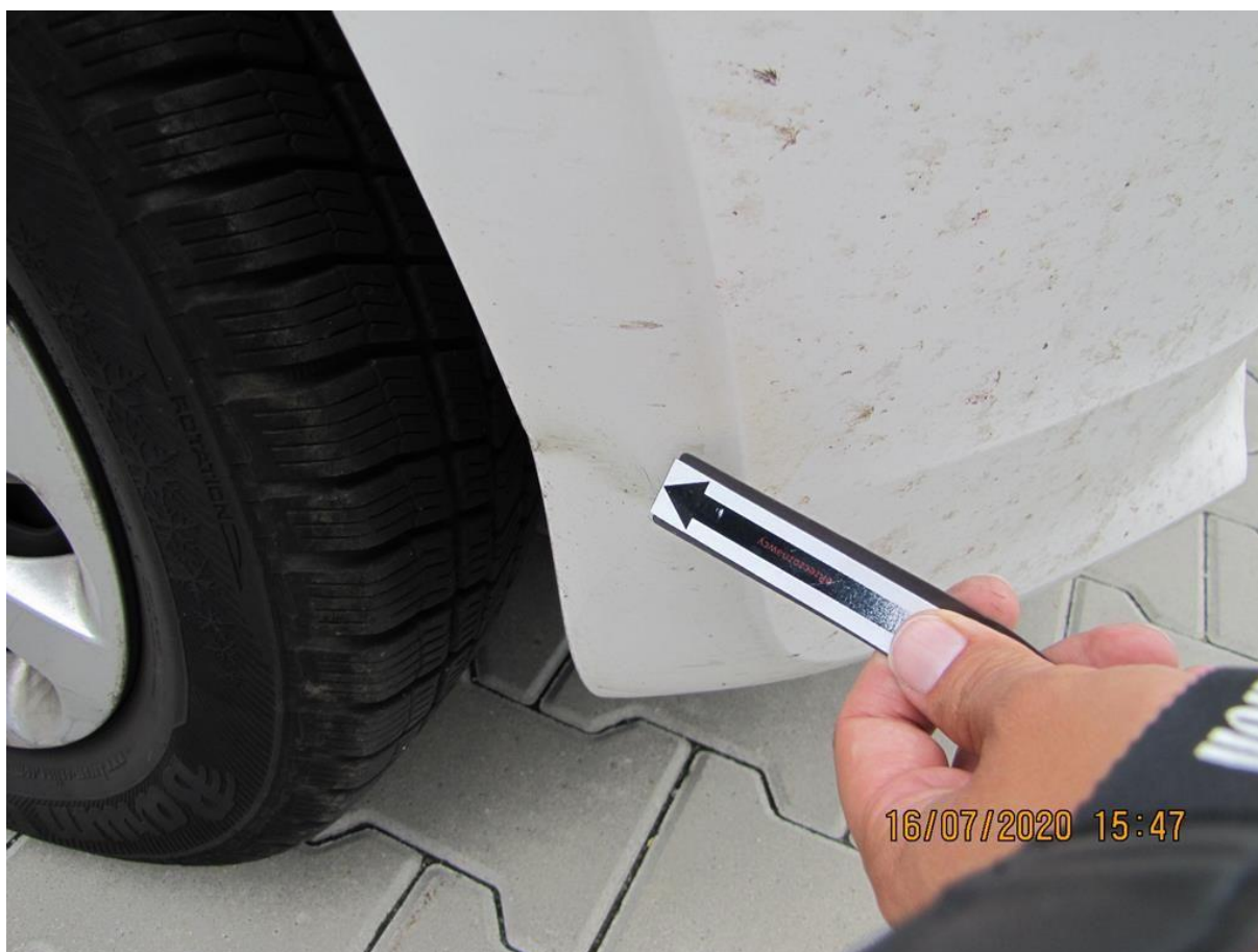
Fot. nr 108