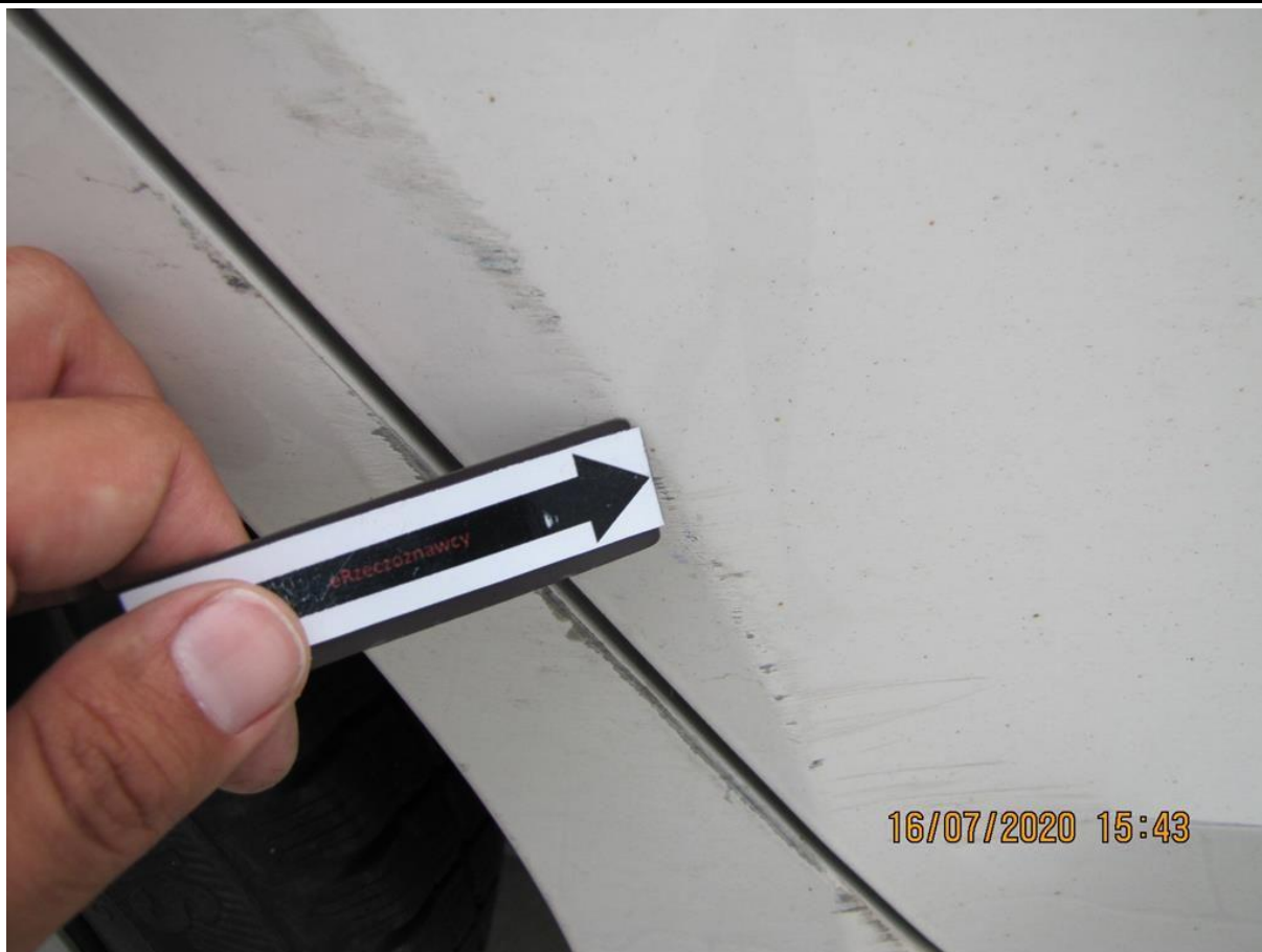
Fot. nr 53