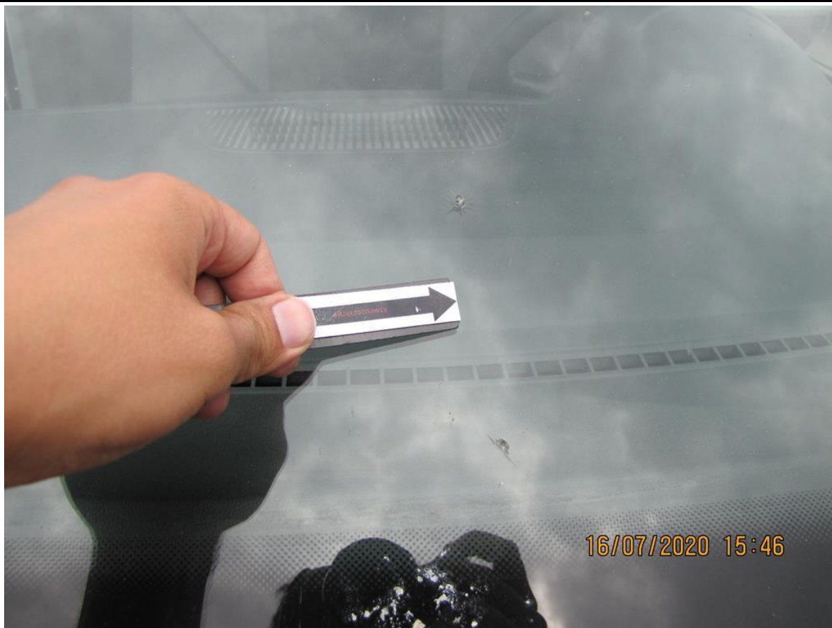
Fot. nr 91