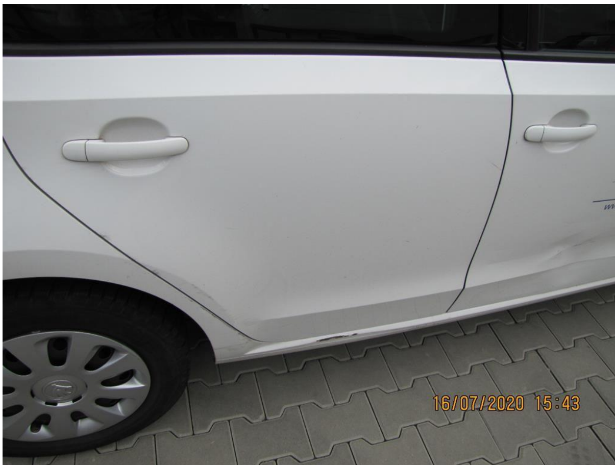
Fot. nr 52