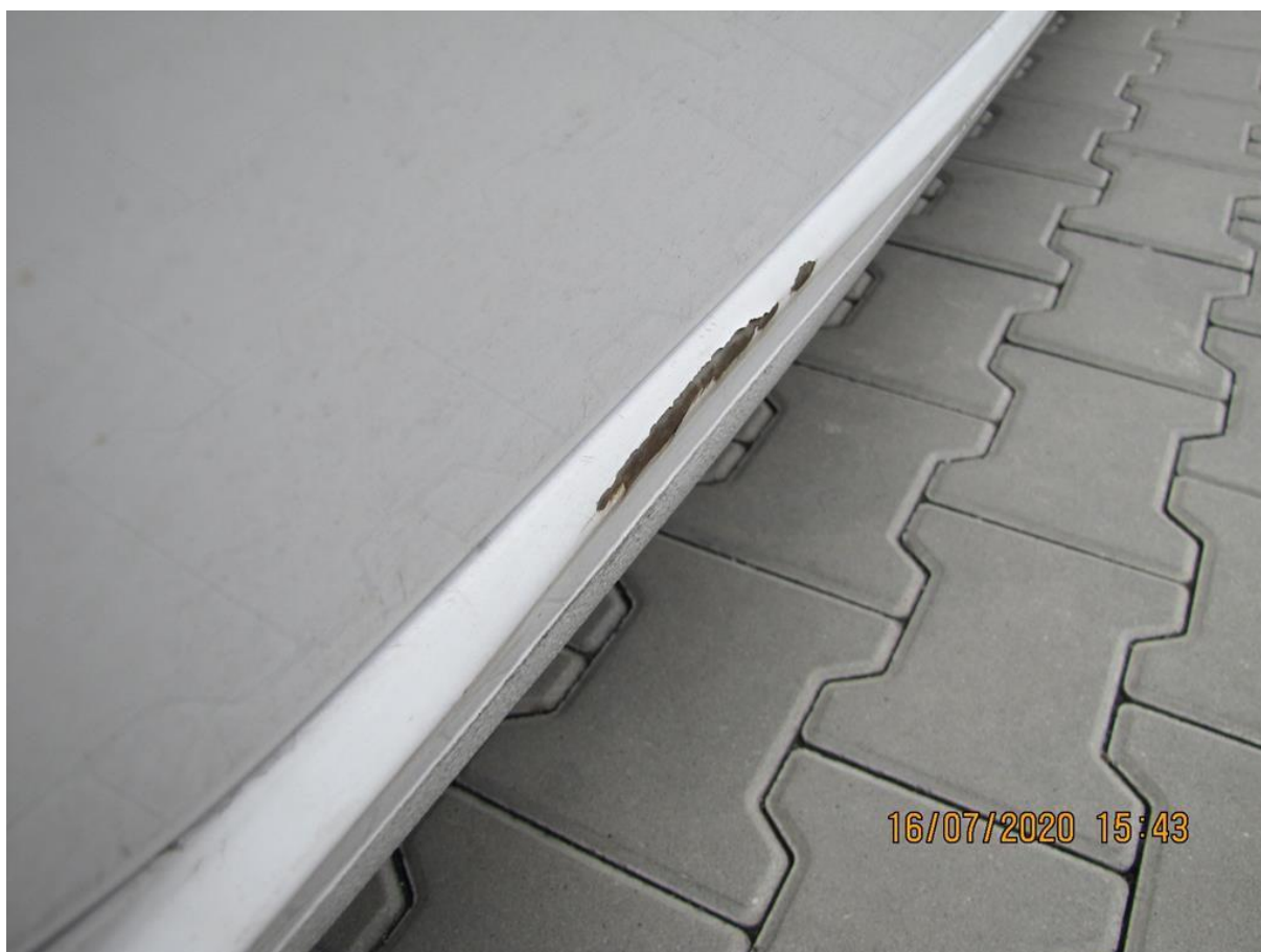
Fot. nr 58