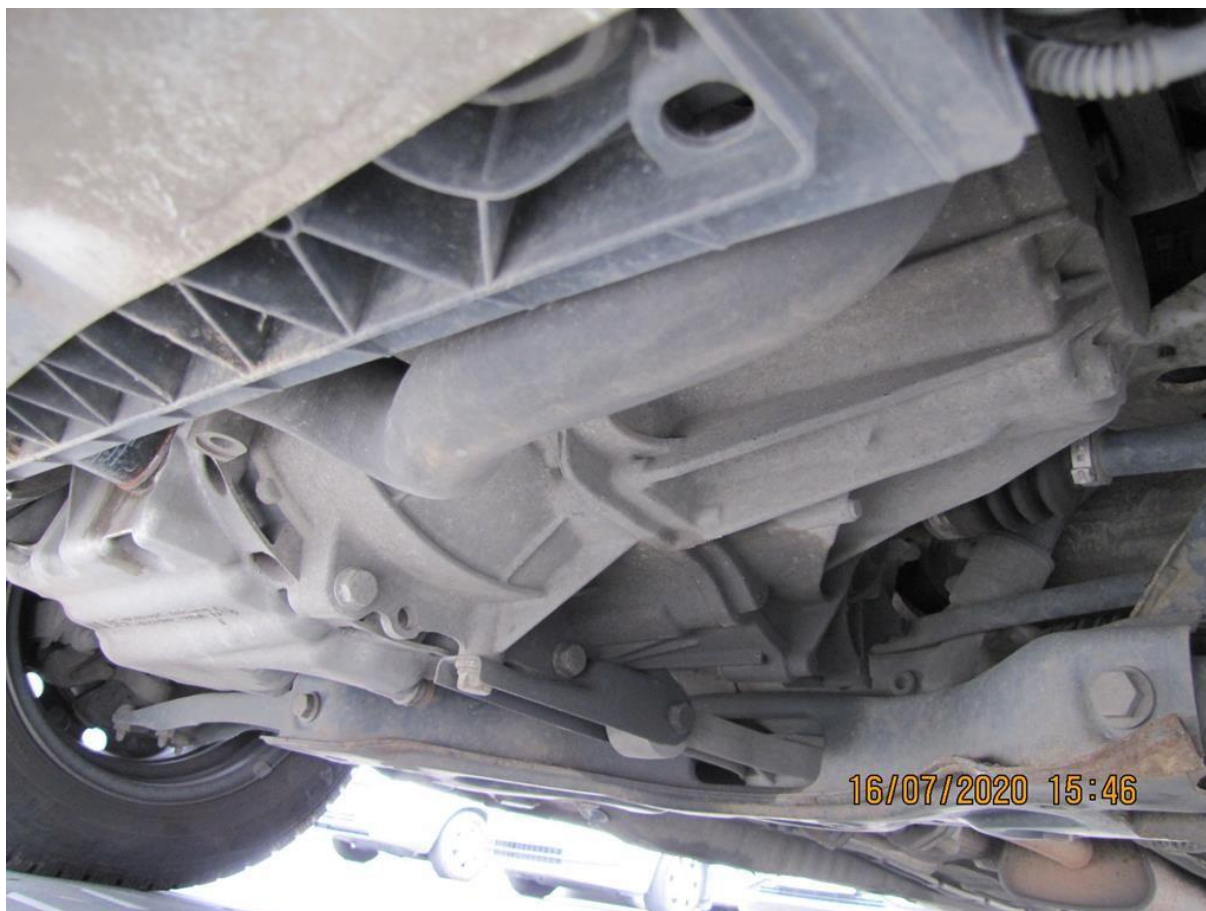
Fot. nr 92