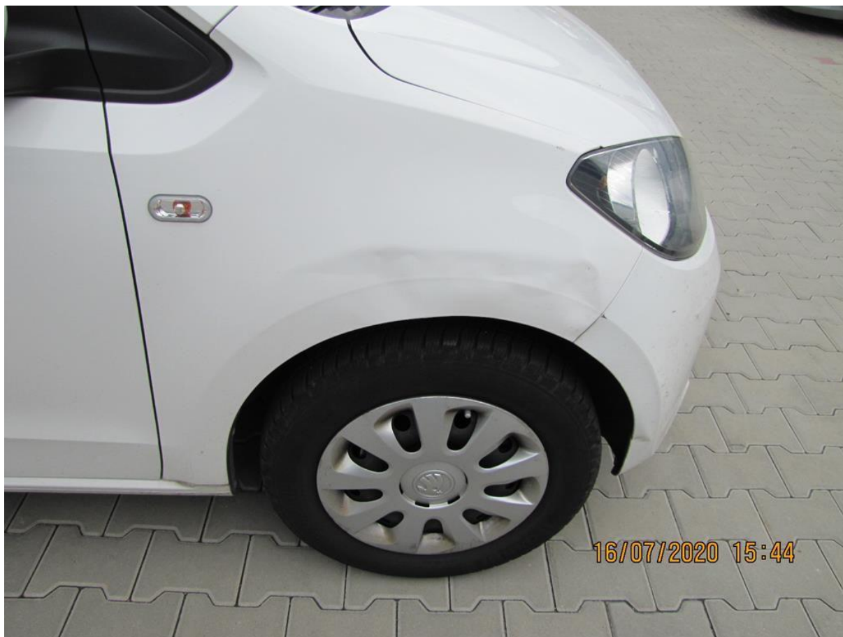
Fot. nr 66