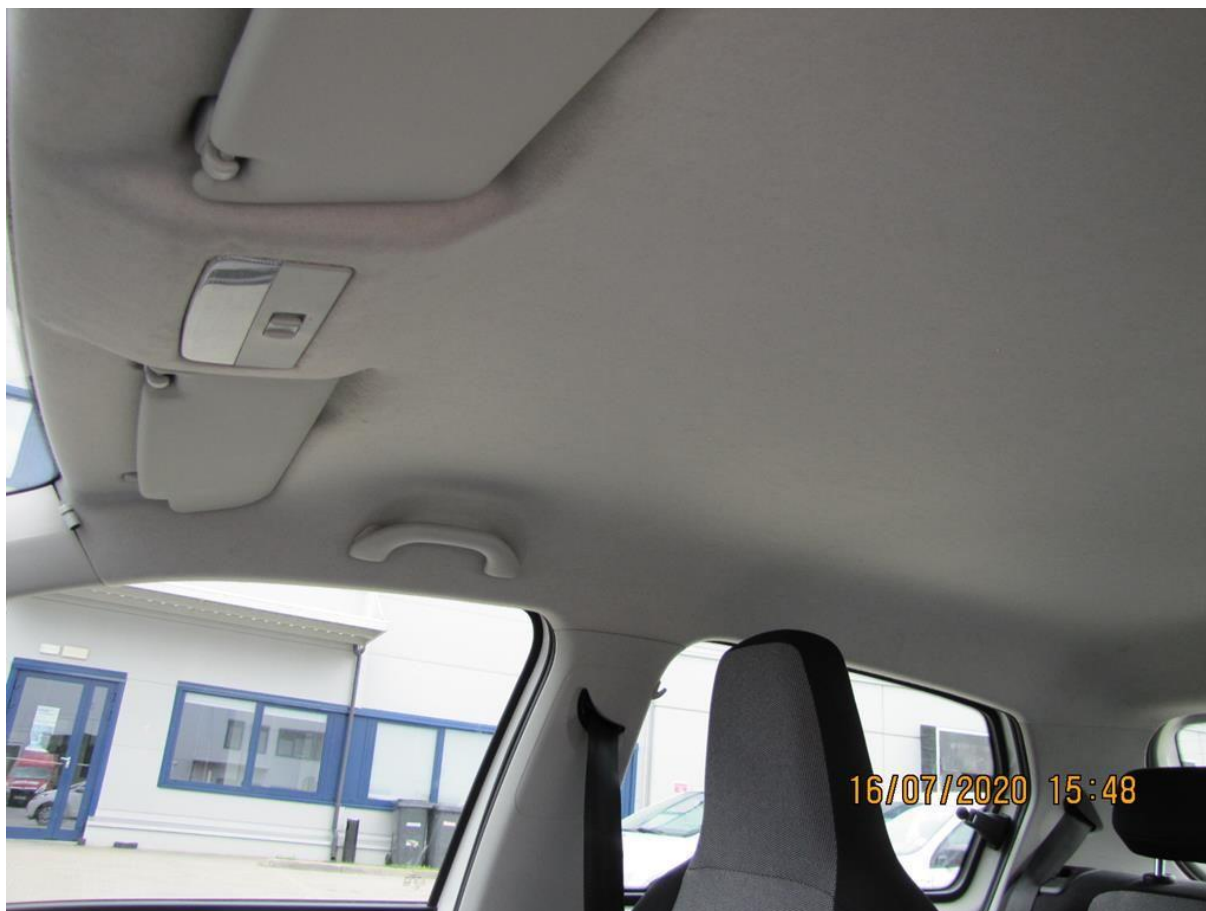
Fot. nr 112