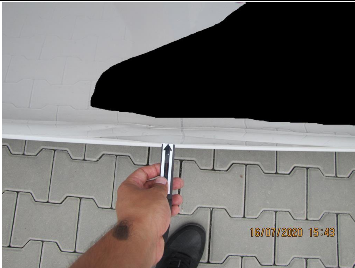
Fot. nr 63