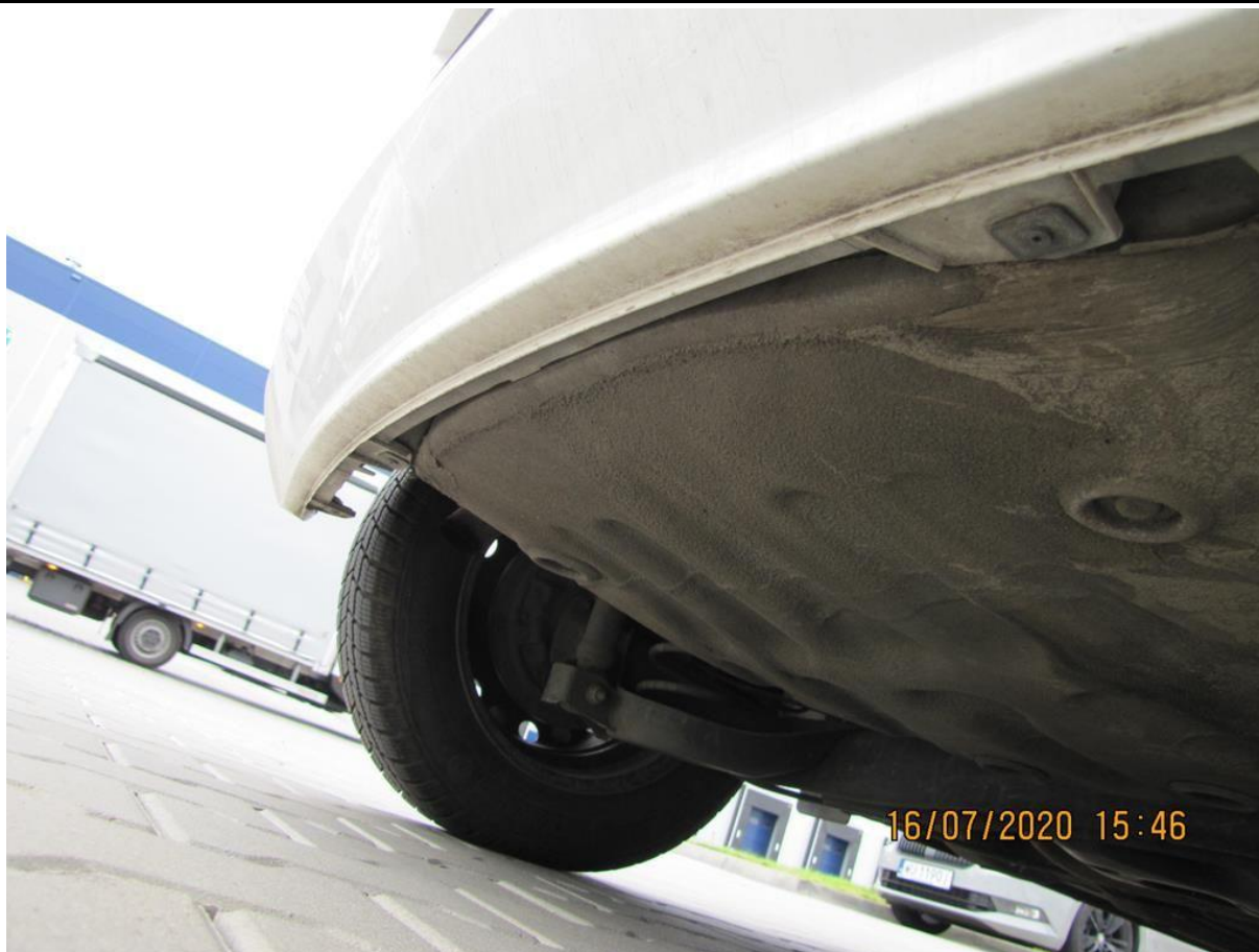
Fot. nr 101