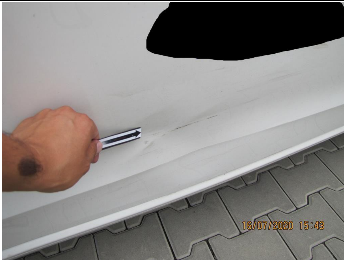
Fot. nr 61