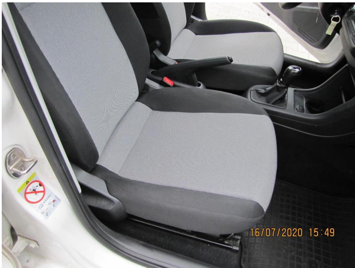
Fot. nr 122