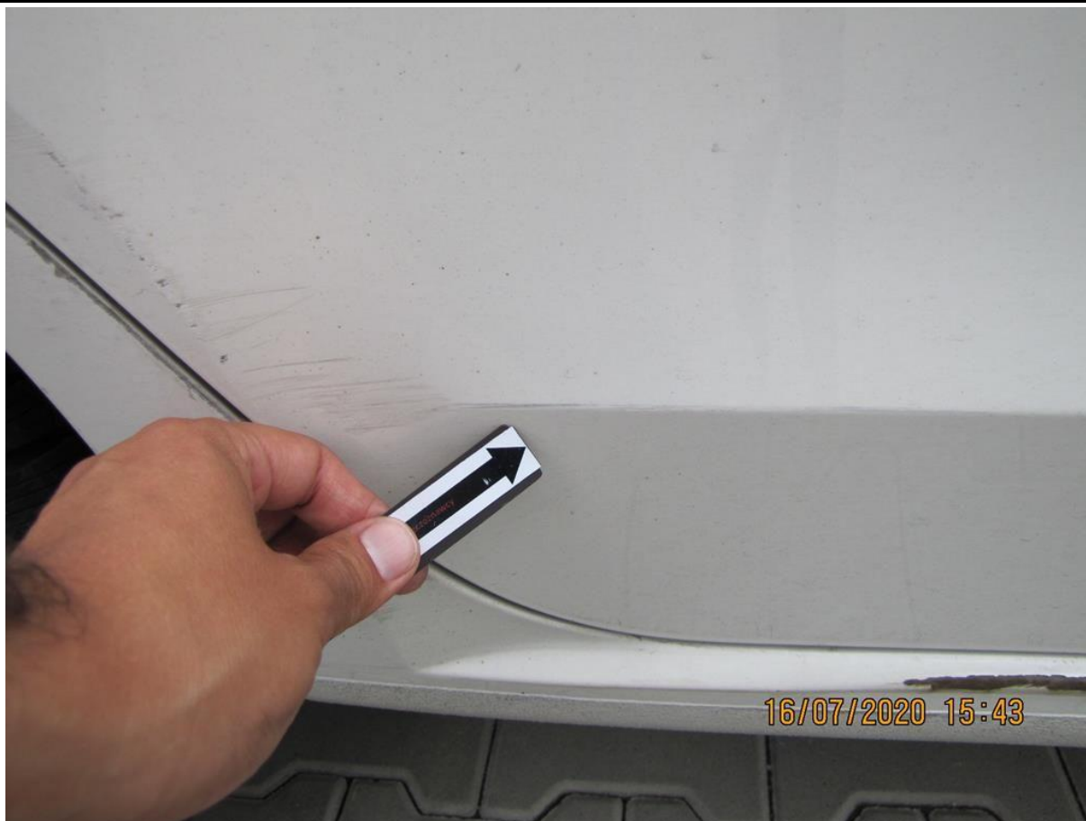
Fot. nr 55