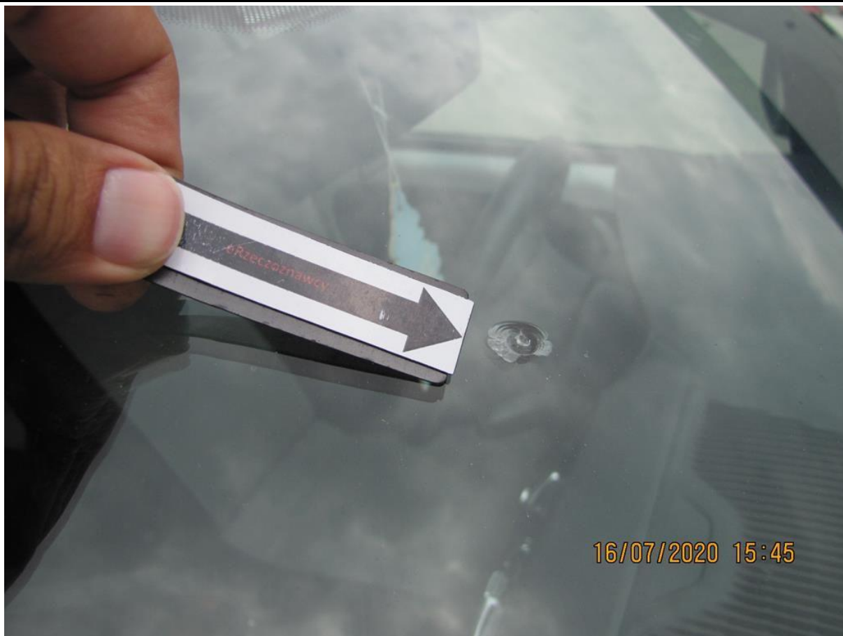
Fot. nr 89