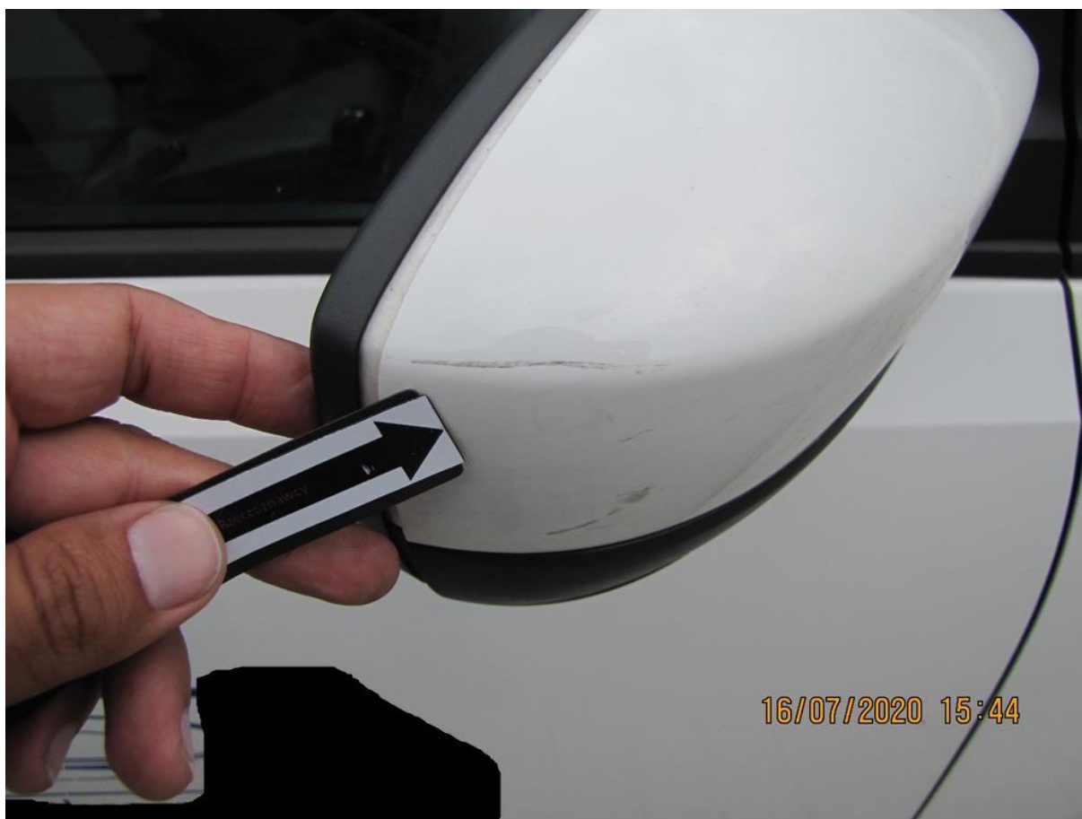
Fot. nr 64