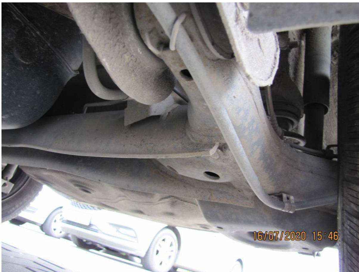
Fot. nr 98