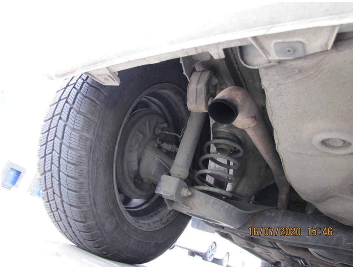
Fot. nr 100