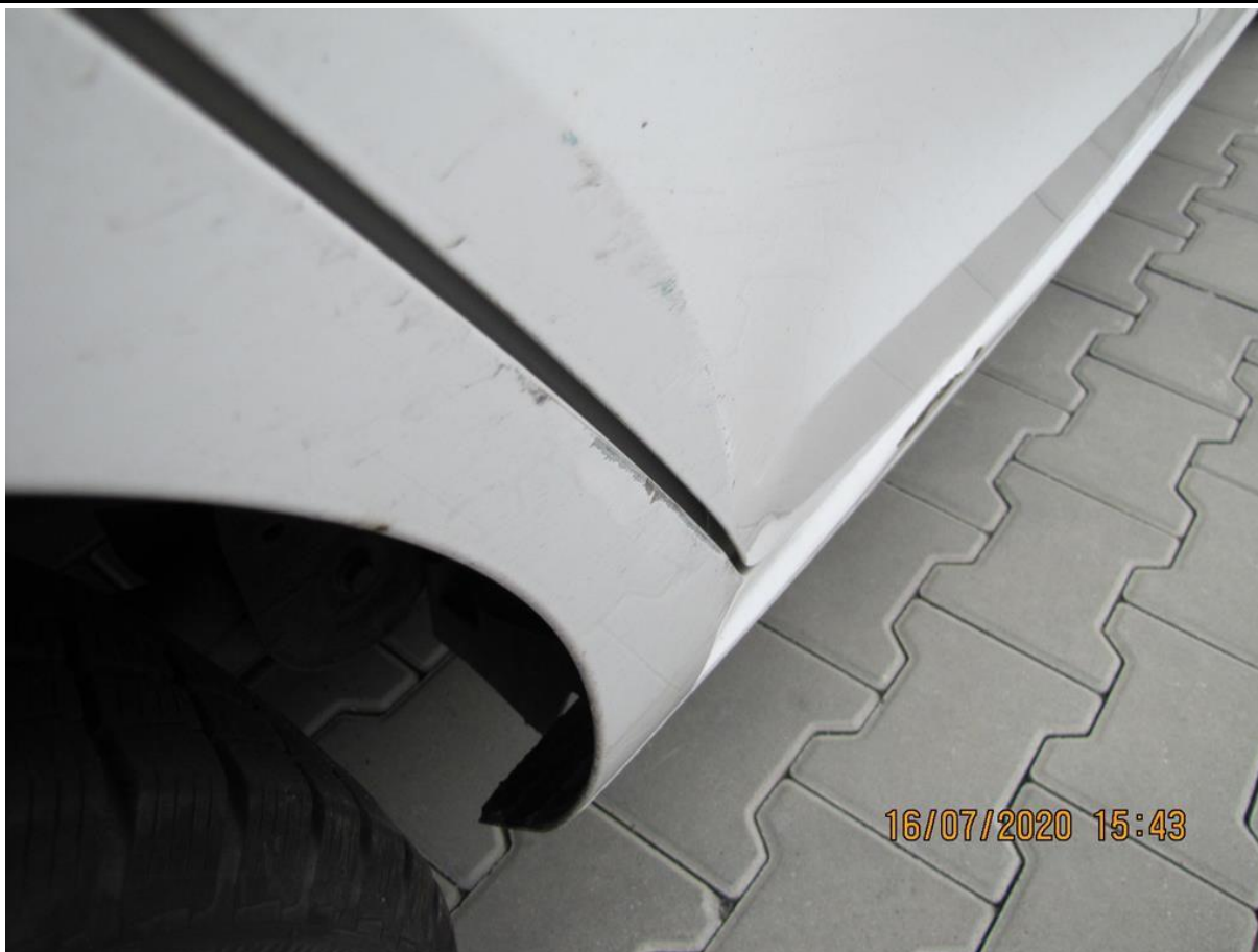
Fot. nr 51