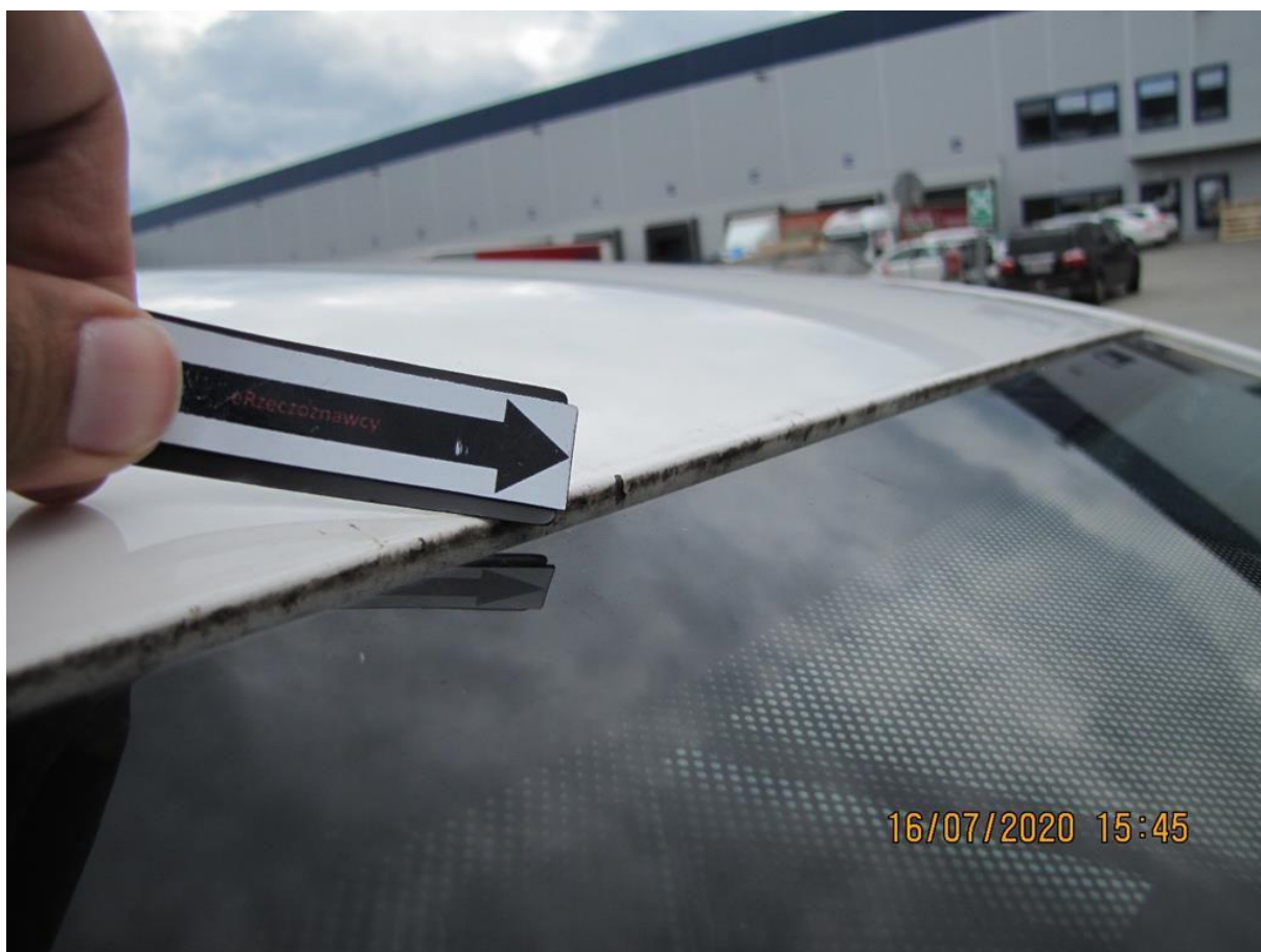
Fot. nr 90