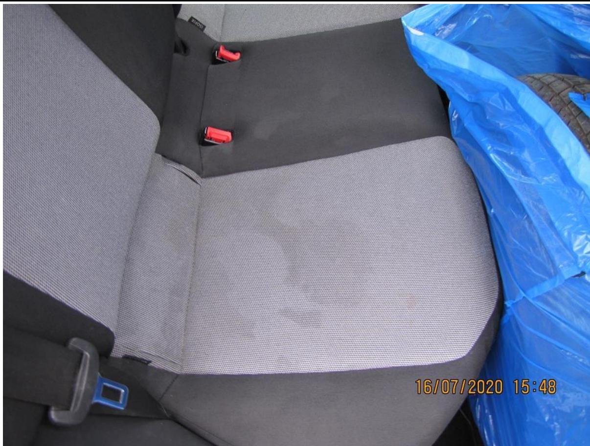
Fot. nr 117