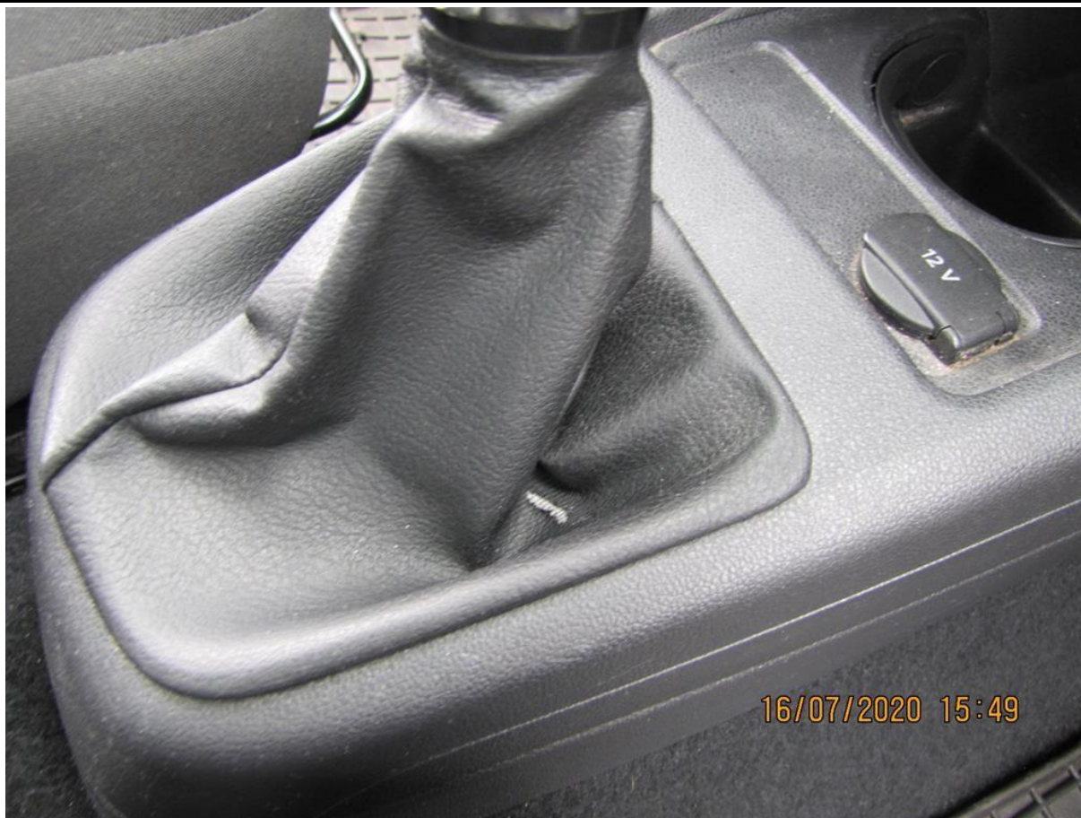
Fot. nr 121