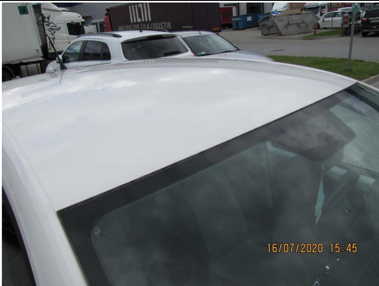
Fot. nr 83