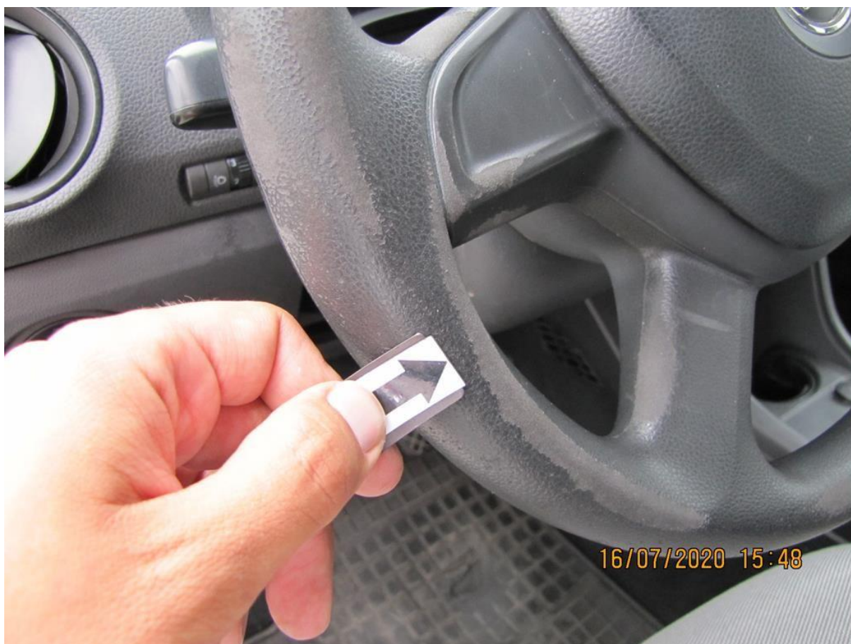
Fot. nr 110