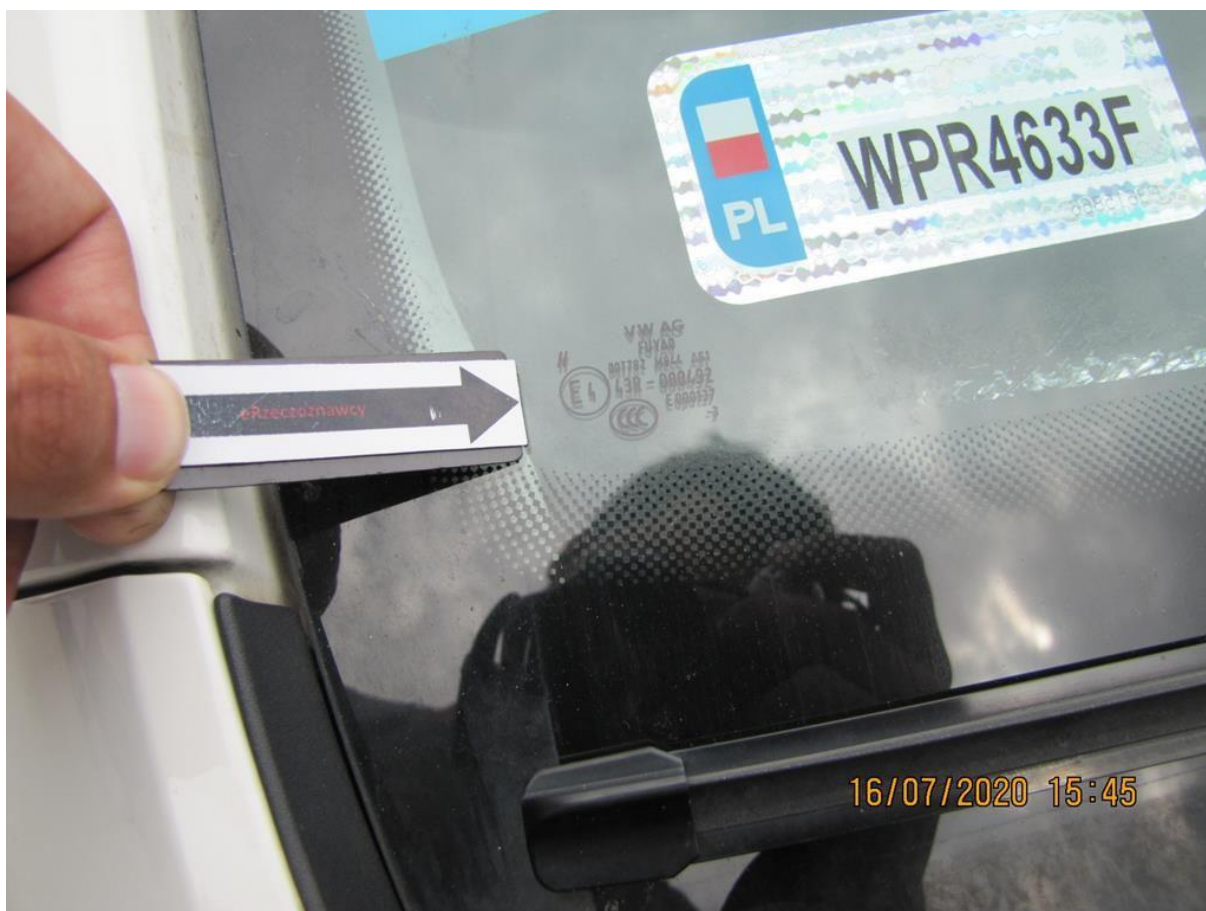
Fot. nr 86