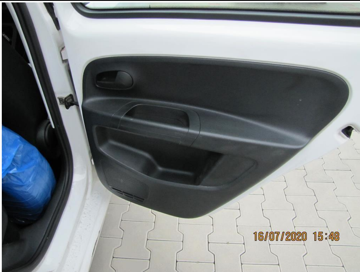
Fot. nr 115