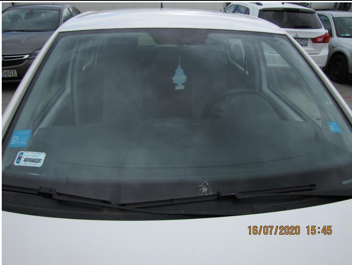
Fot. nr 85