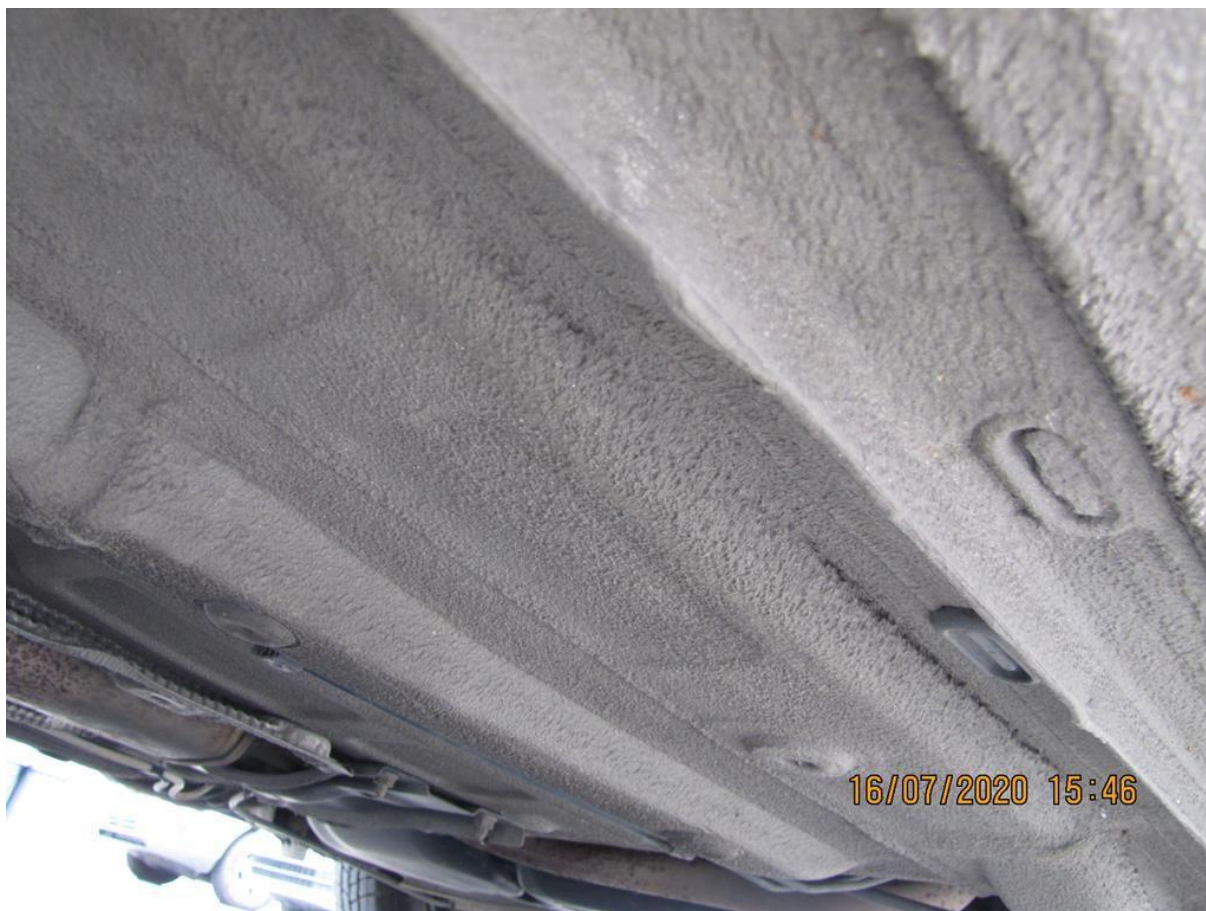
Fot. nr 96