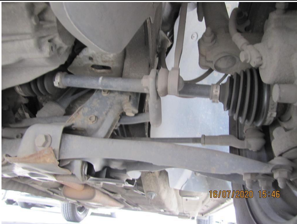
Fot. nr 93