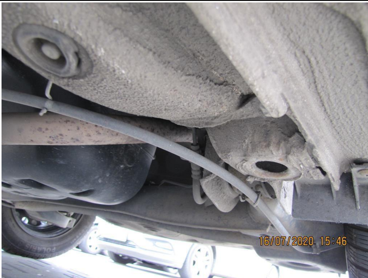
Fot. nr 97