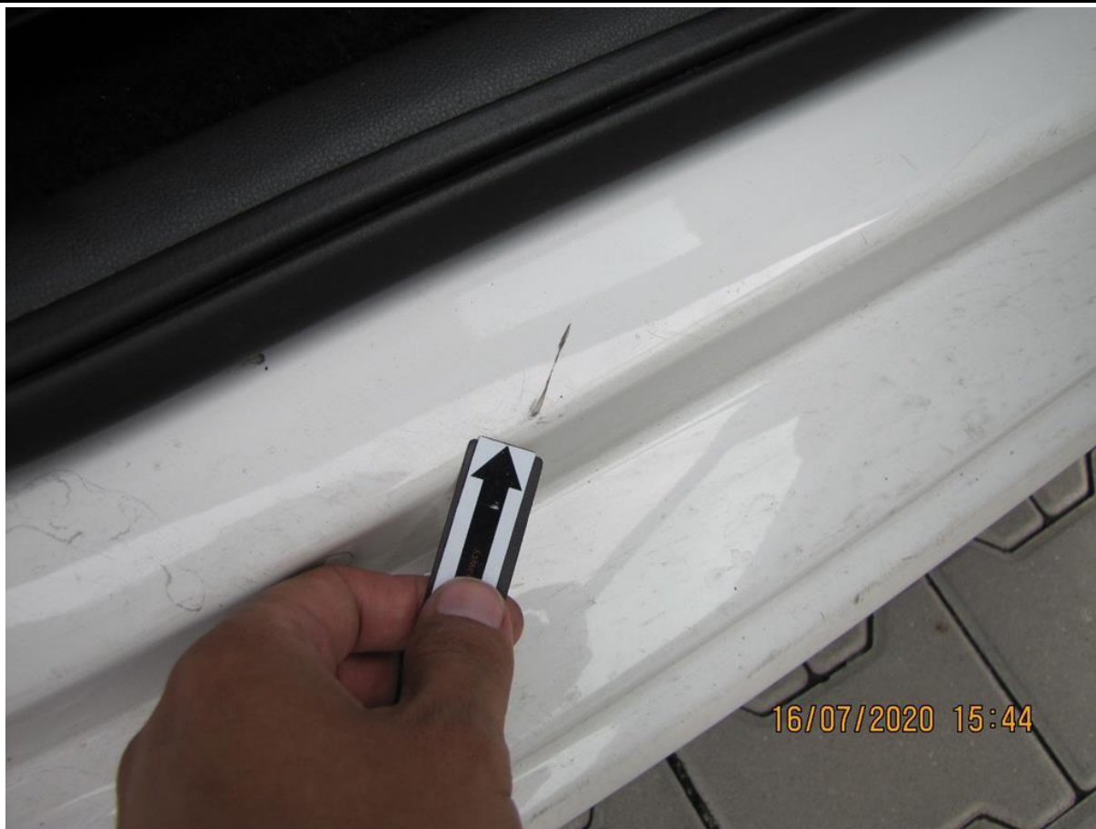
Fot. nr 65