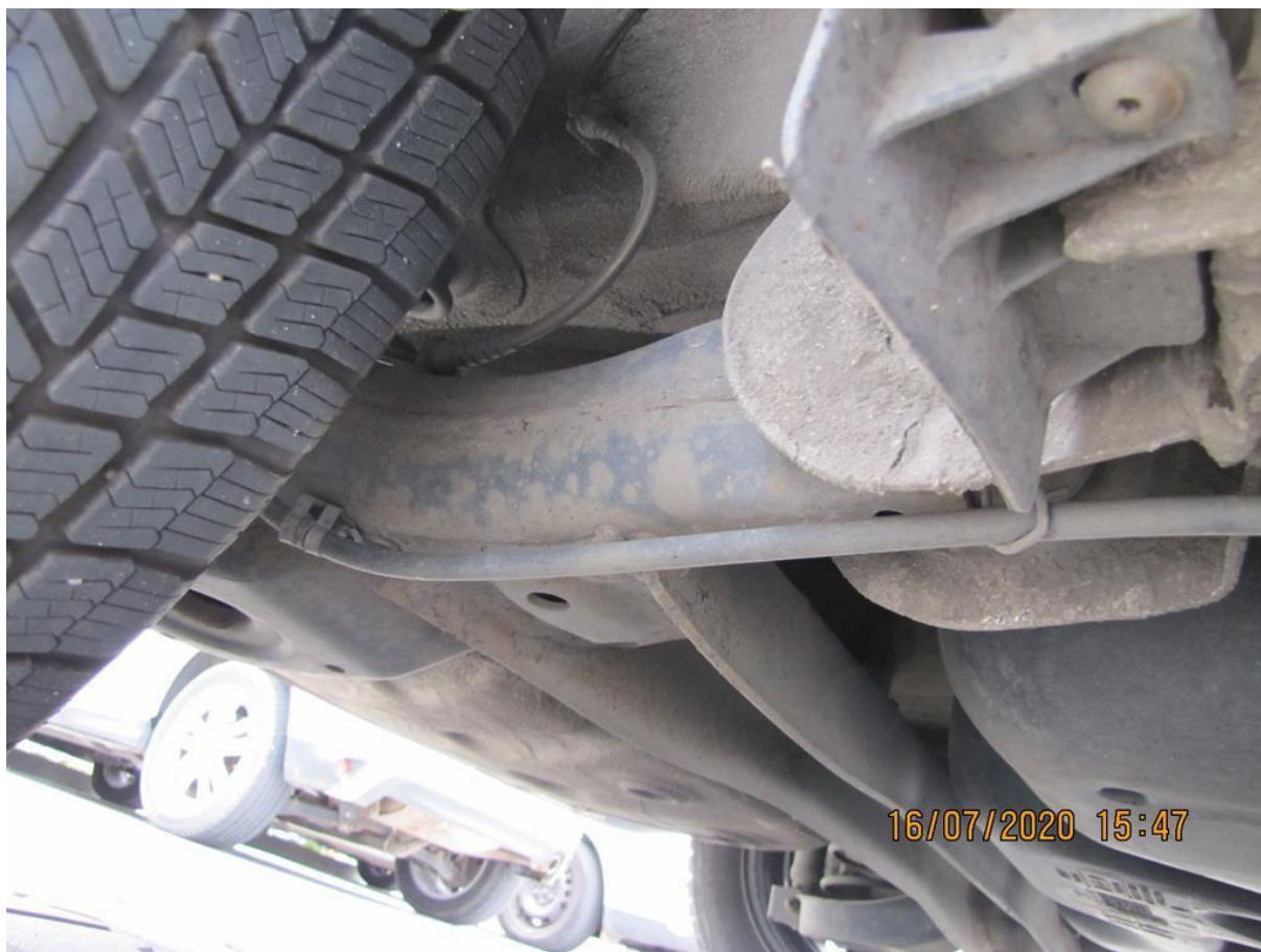
Fot. nr 104