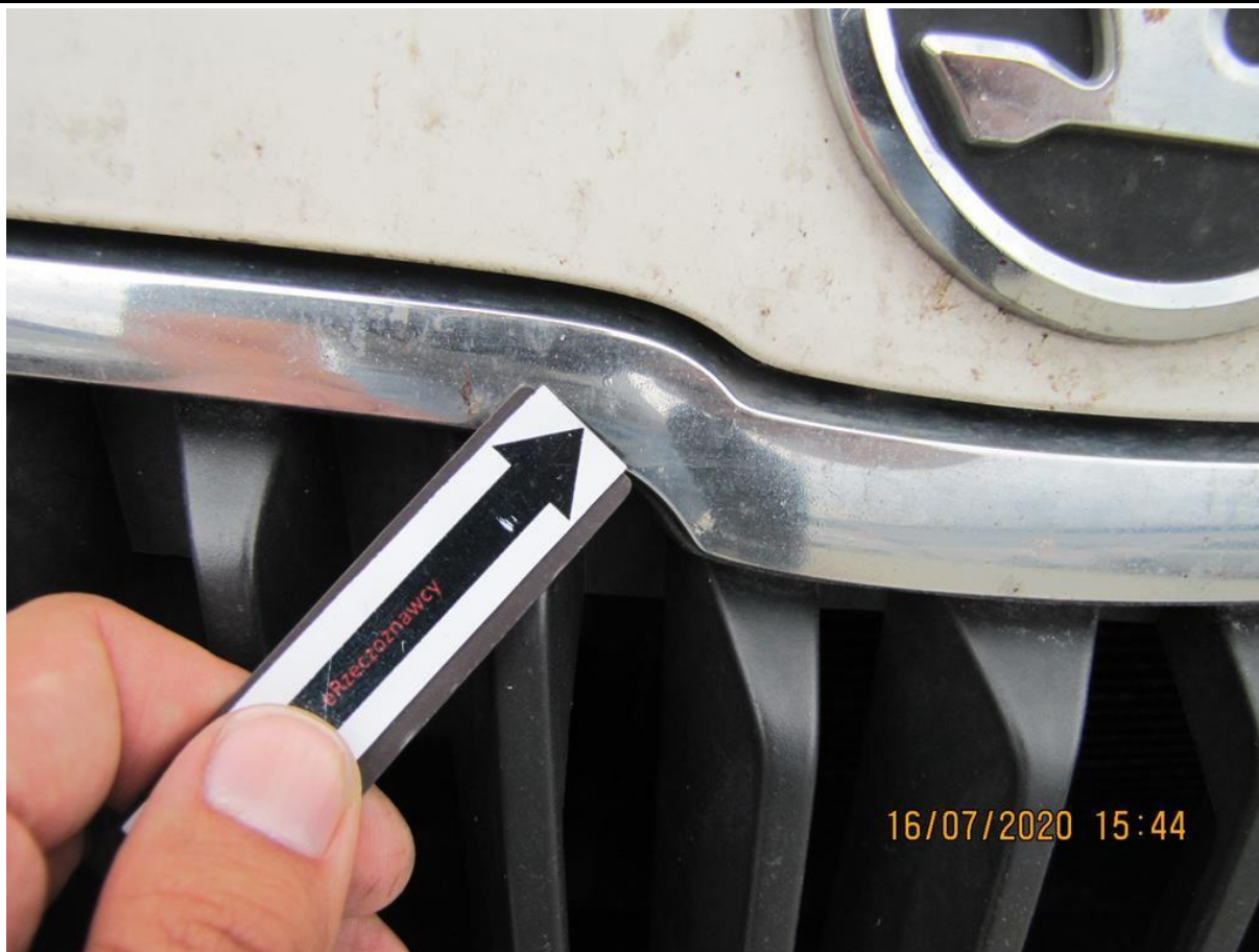
Fot. nr 77