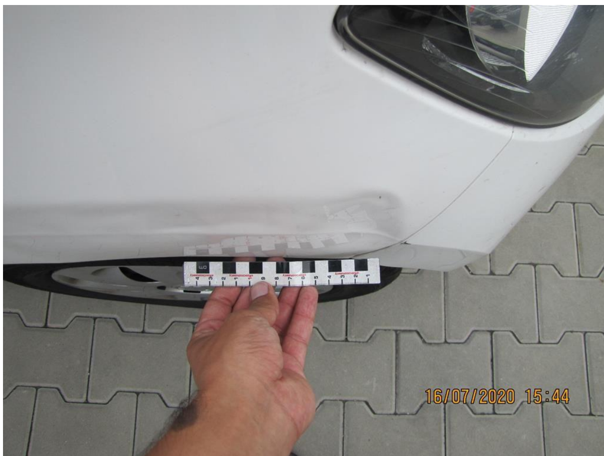
Fot. nr 68