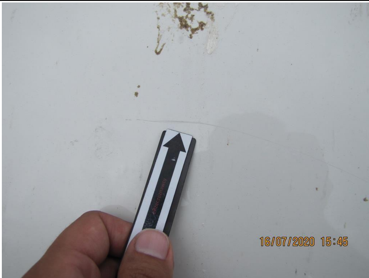
Fot. nr 79