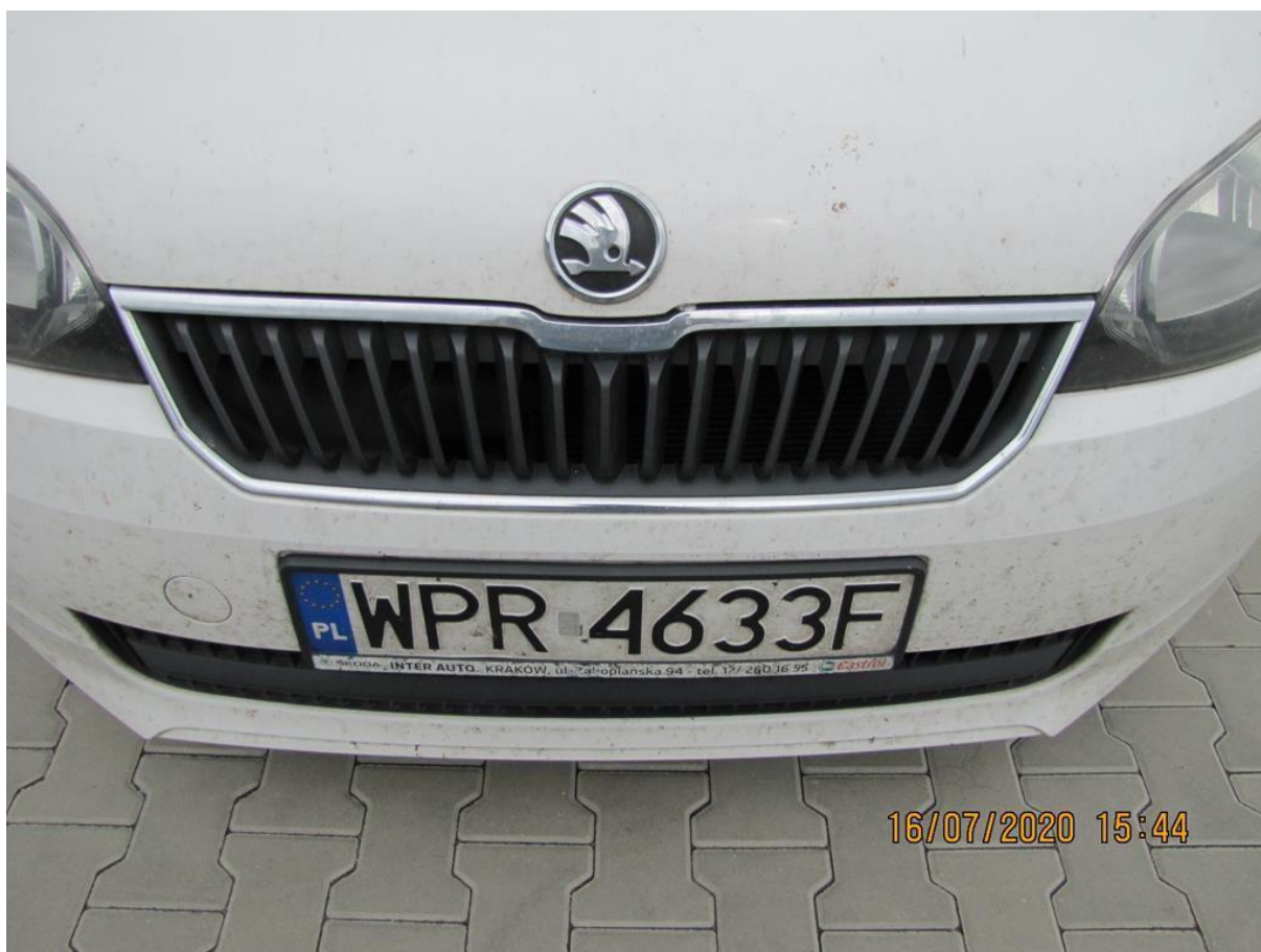
Fot. nr 76