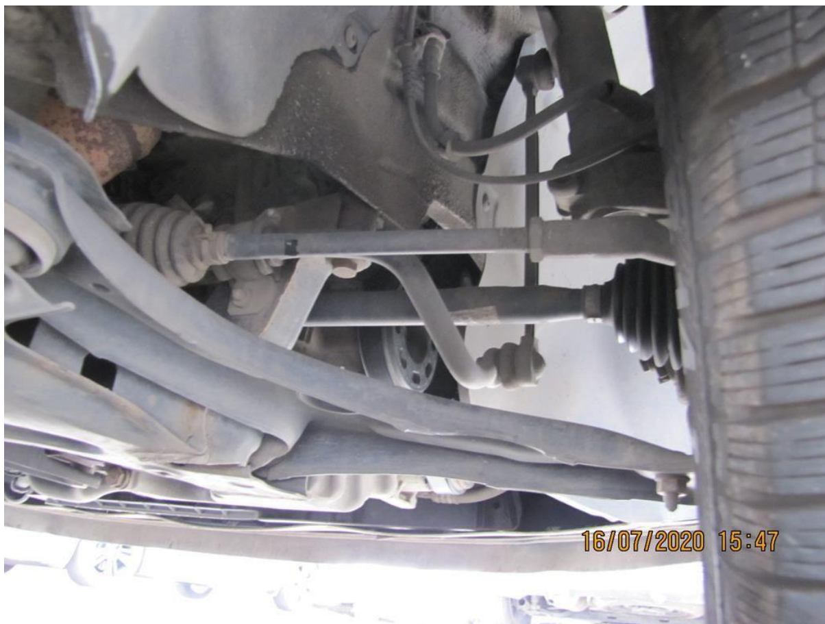
Fot. nr 106