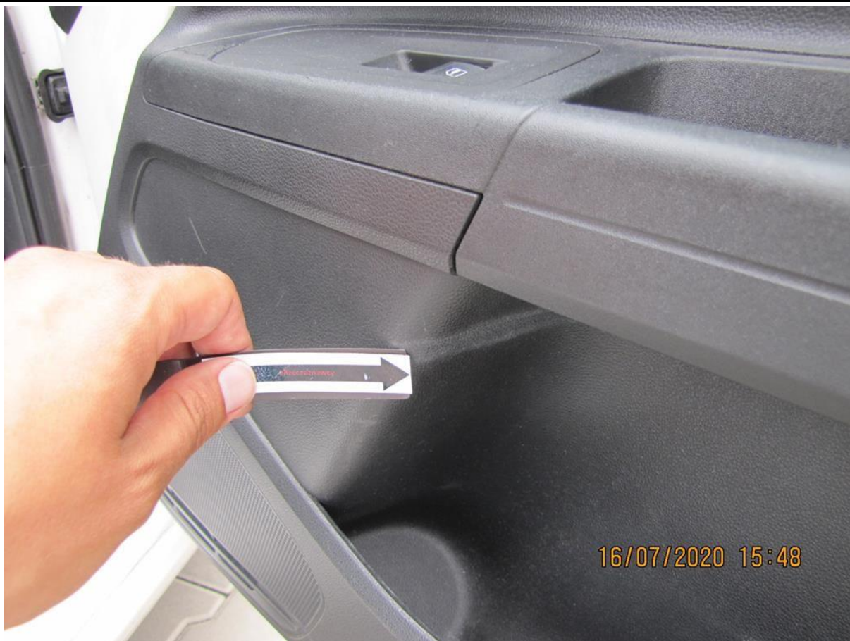
Fot. nr 119