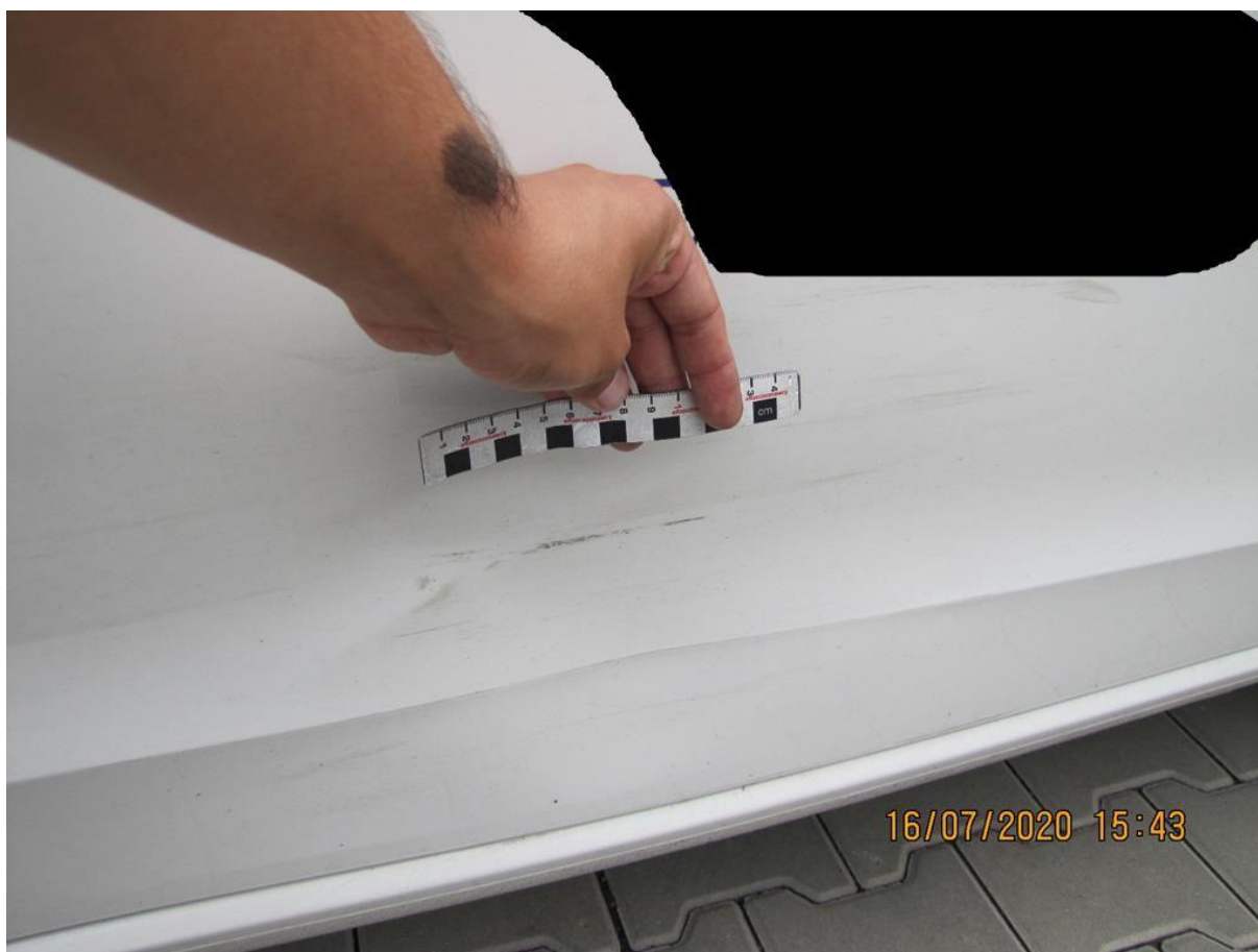
Fot. nr 62