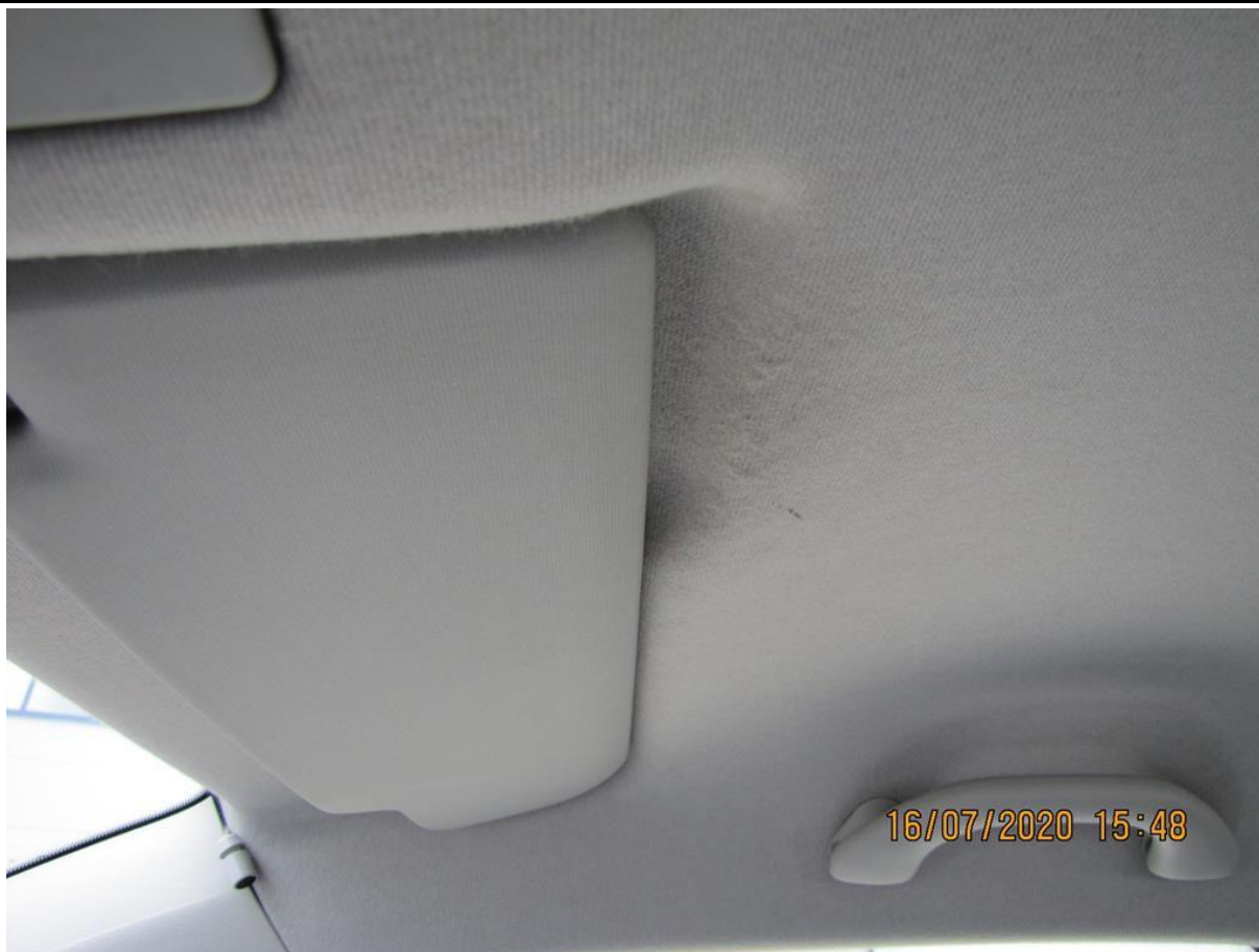
Fot. nr 113