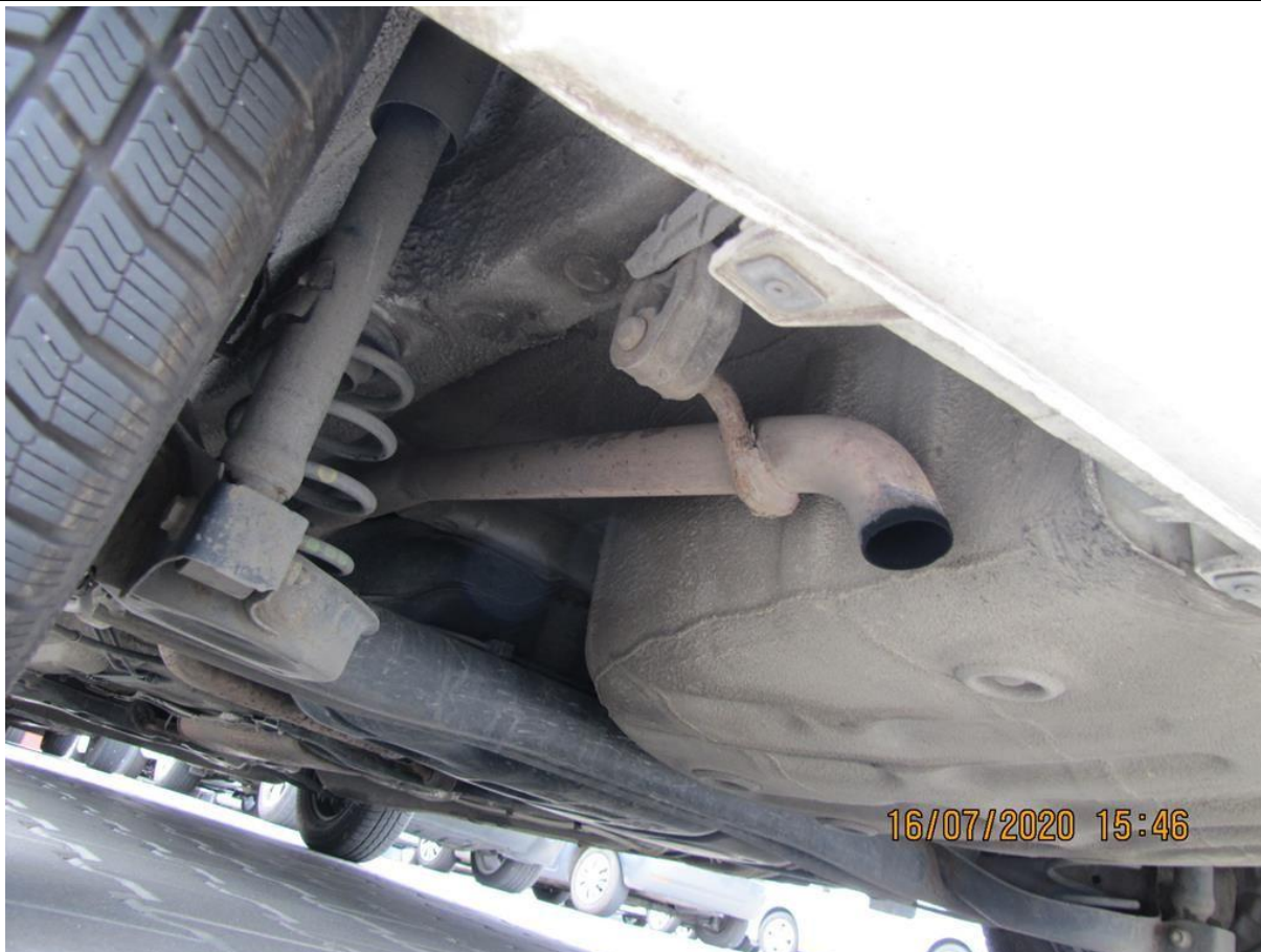
Fot. nr 99