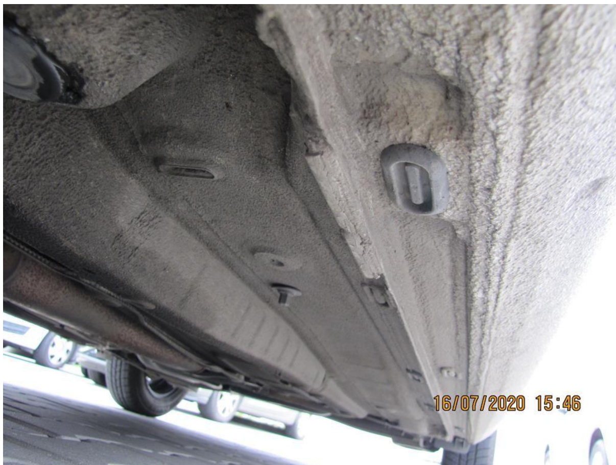
Fot. nr 94