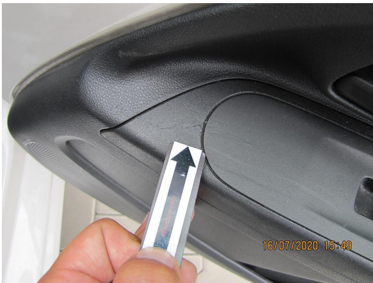
Fot. nr 120