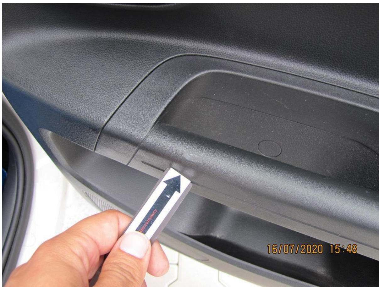
Fot. nr 116