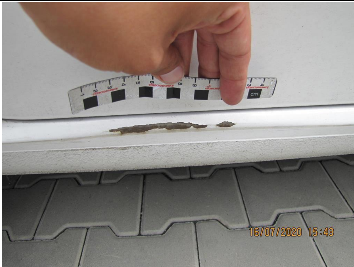
Fot. nr 57