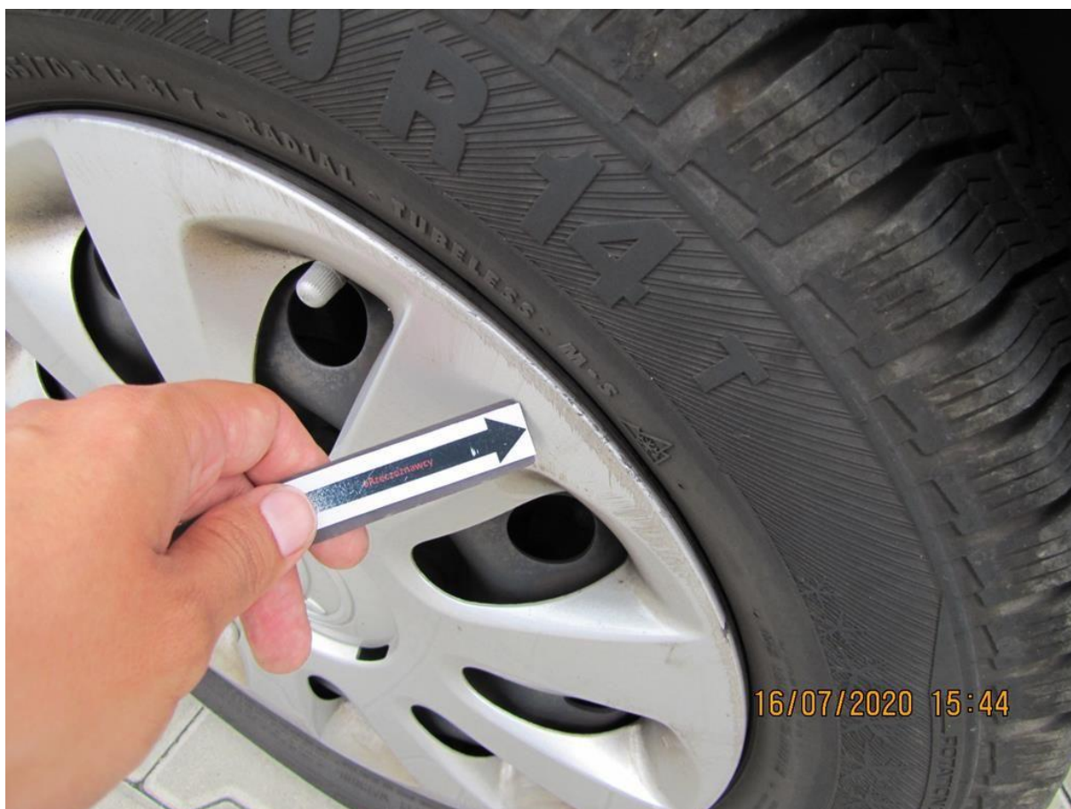
Fot. nr 70