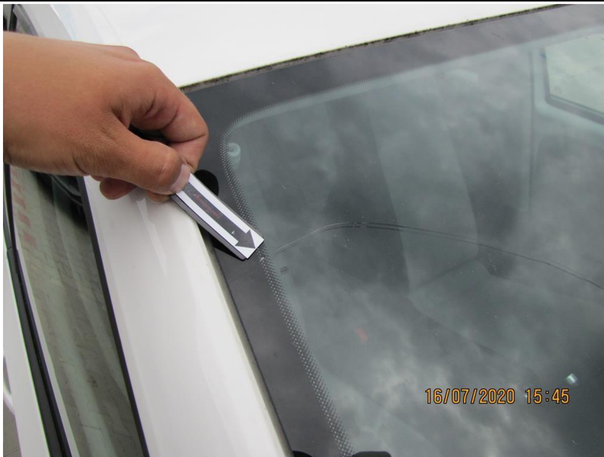
Fot. nr 87