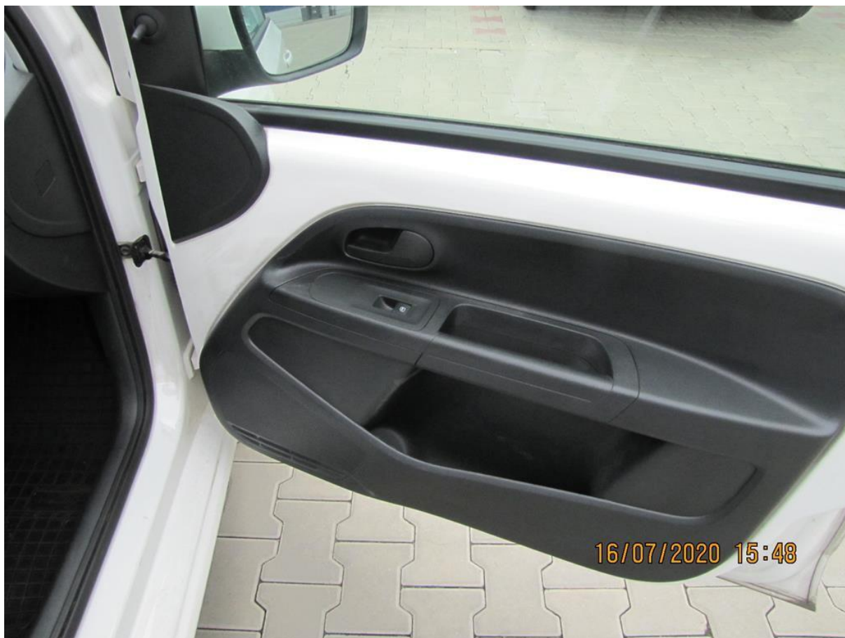
Fot. nr 118