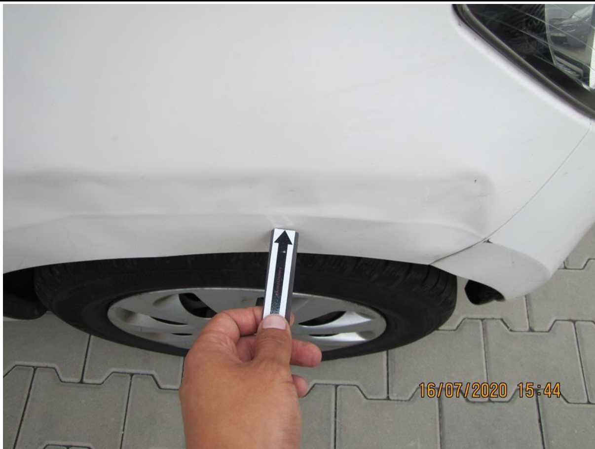
Fot. nr 67