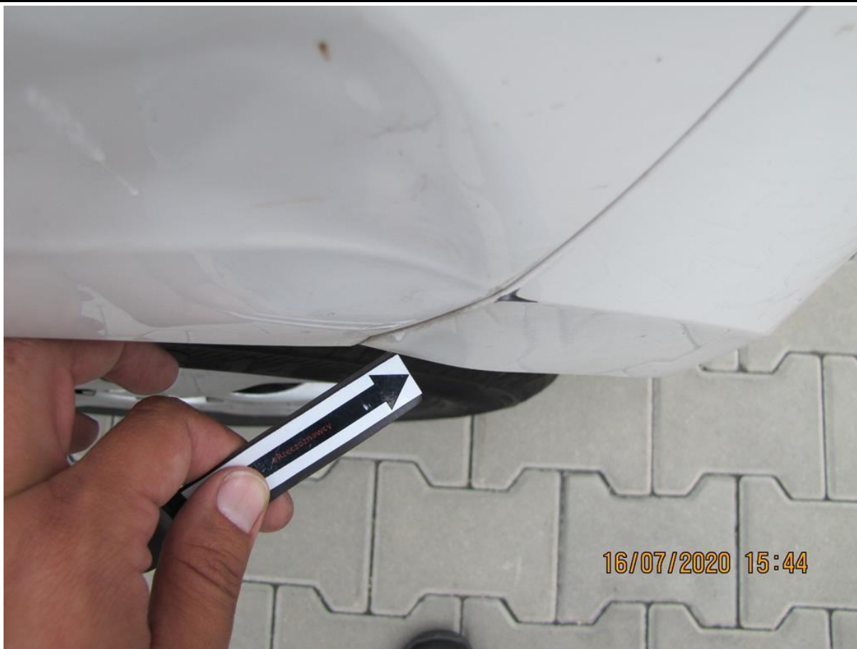
Fot. nr 73