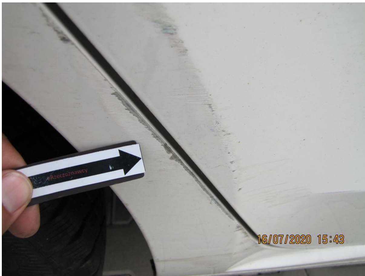
Fot. nr 50