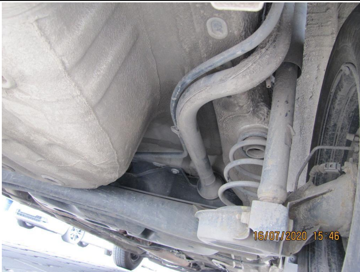
Fot. nr 103