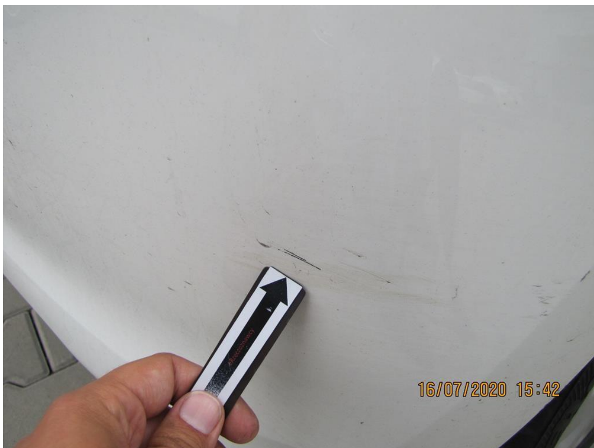
Fot. nr 48