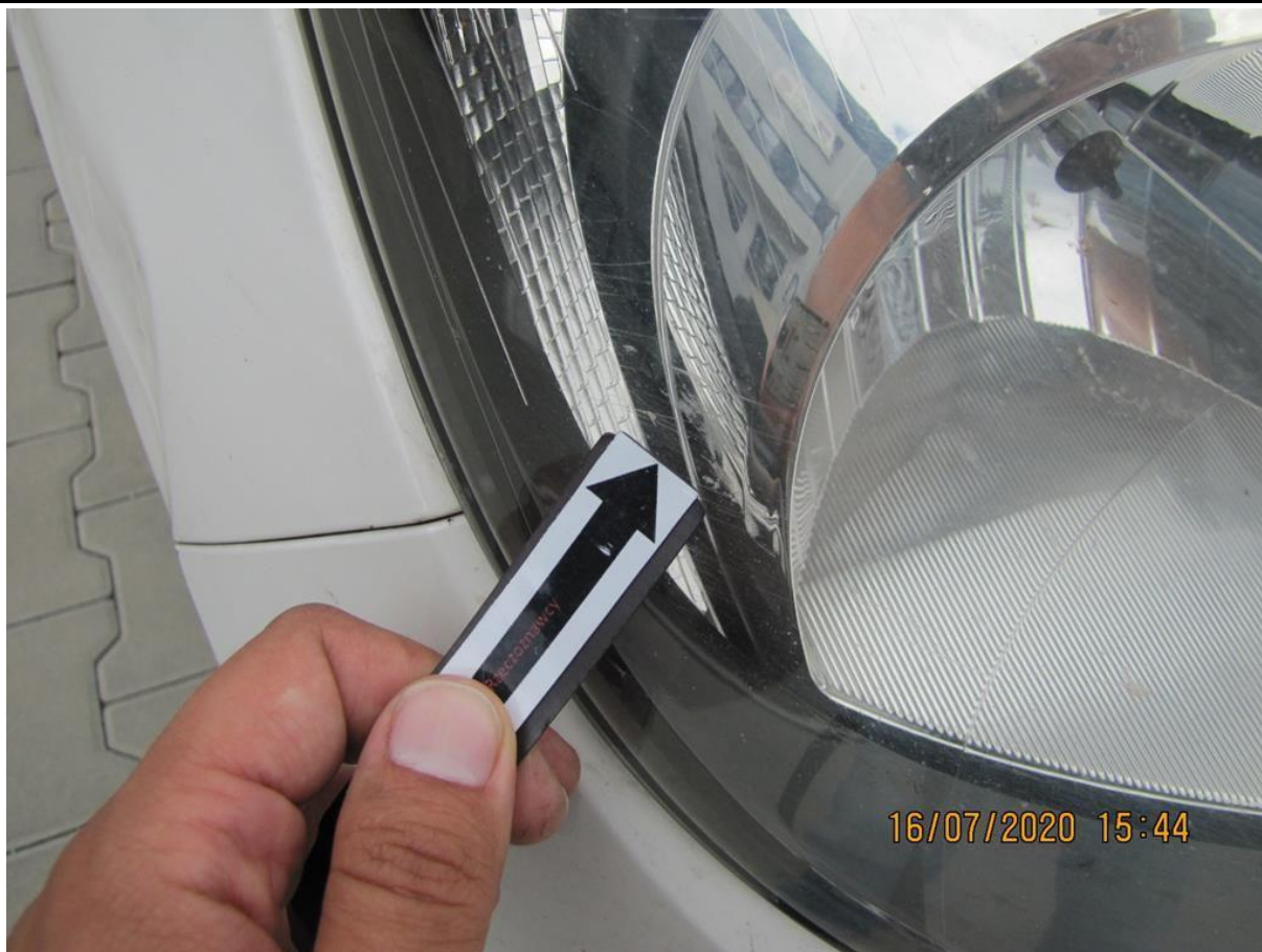
Fot. nr 75