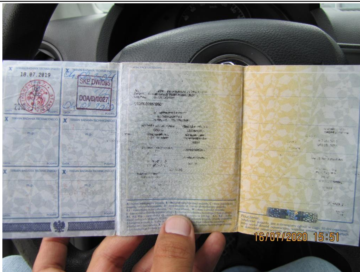
Fot. nr 125