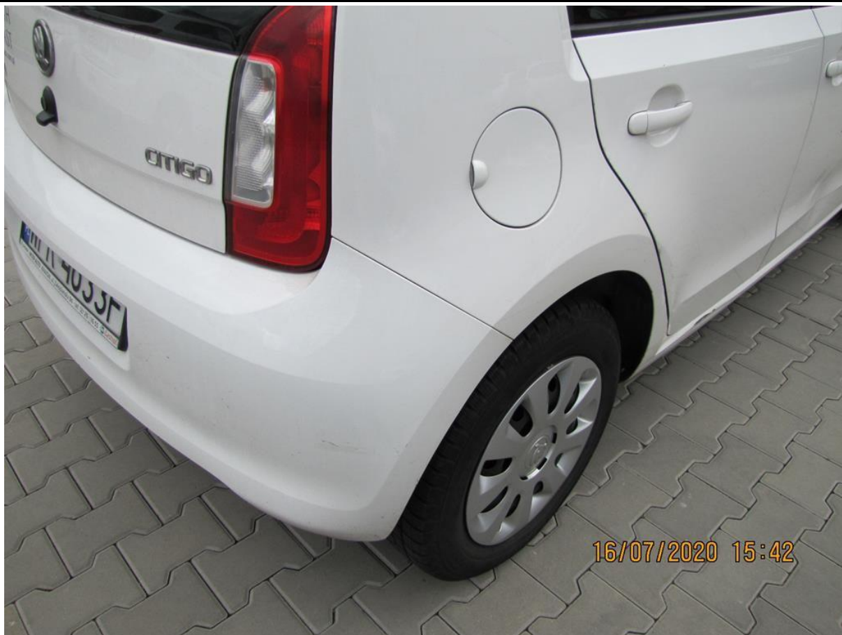
Fot. nr 47