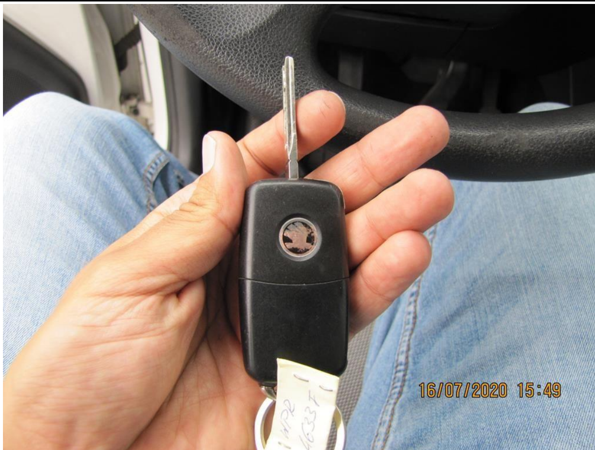
Fot. nr 127

Dokument wystawiony elektronicznie, w tym bez podpisu