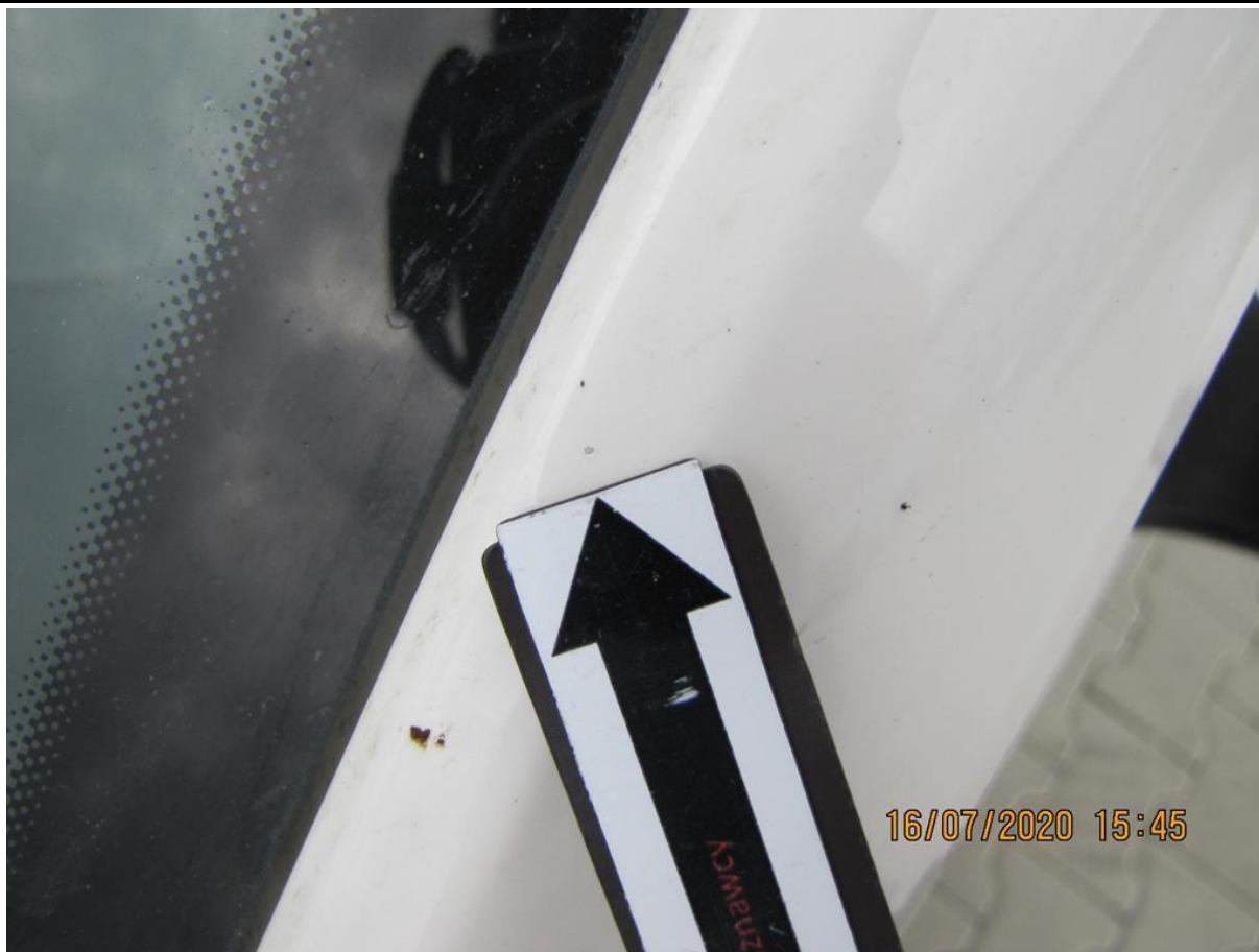
Fot. nr 81