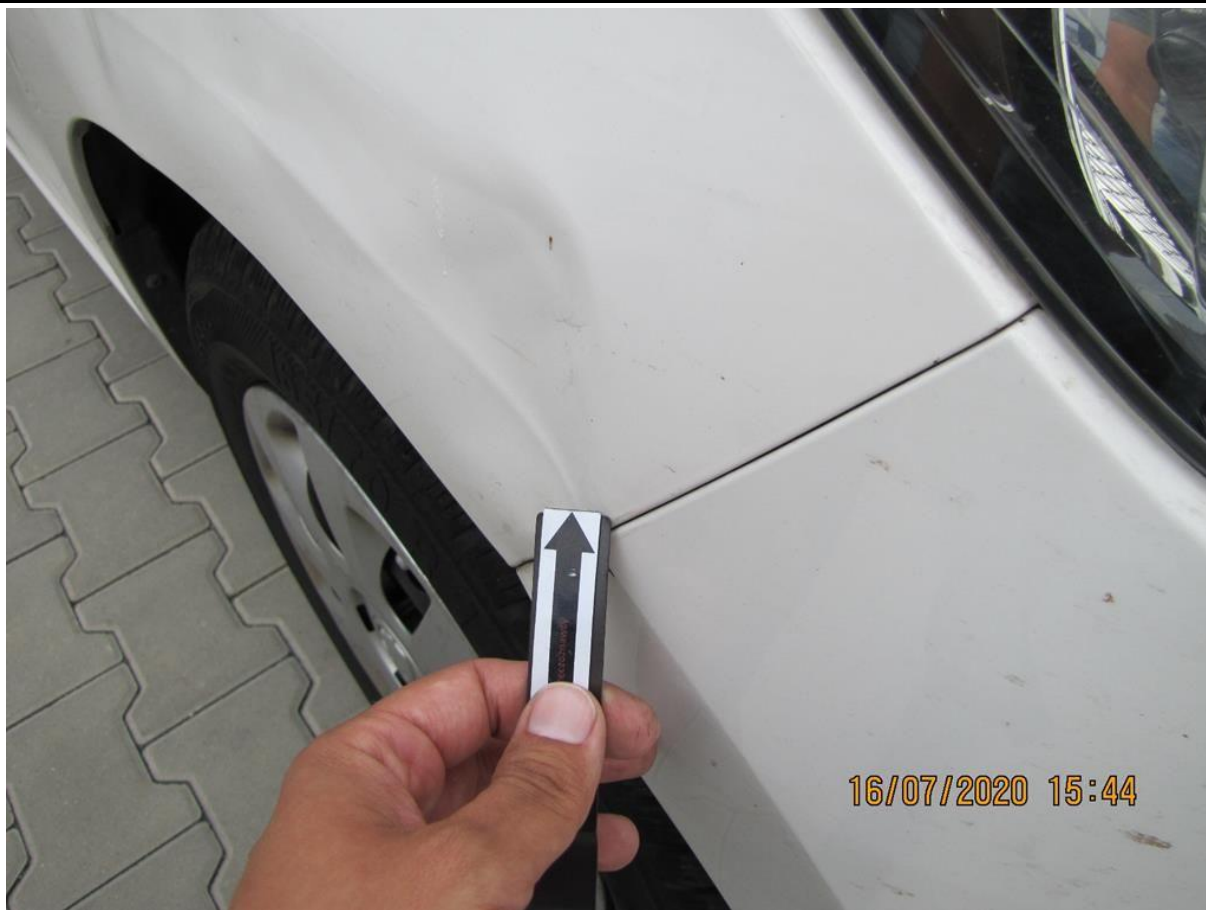
Fot. nr 69