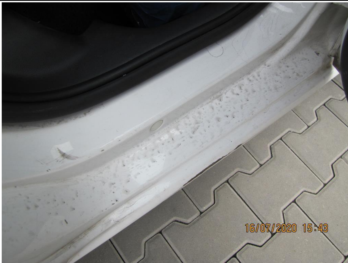
Fot. nr 59