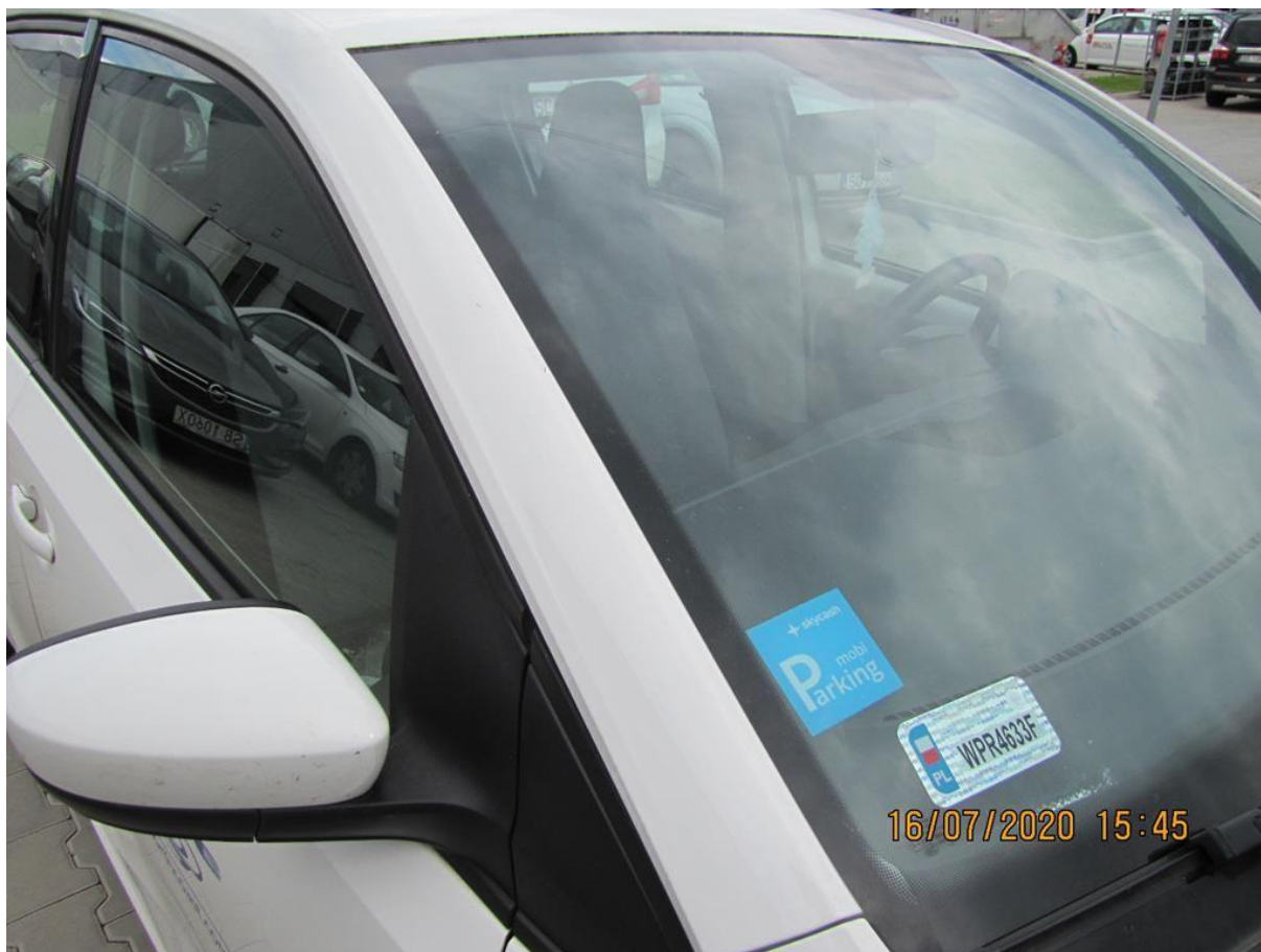
Fot. nr 82