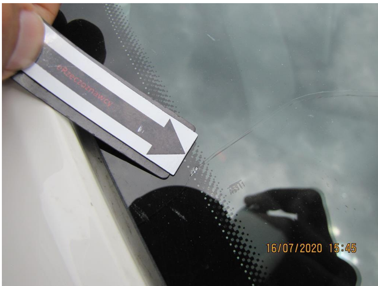
Fot. nr 88