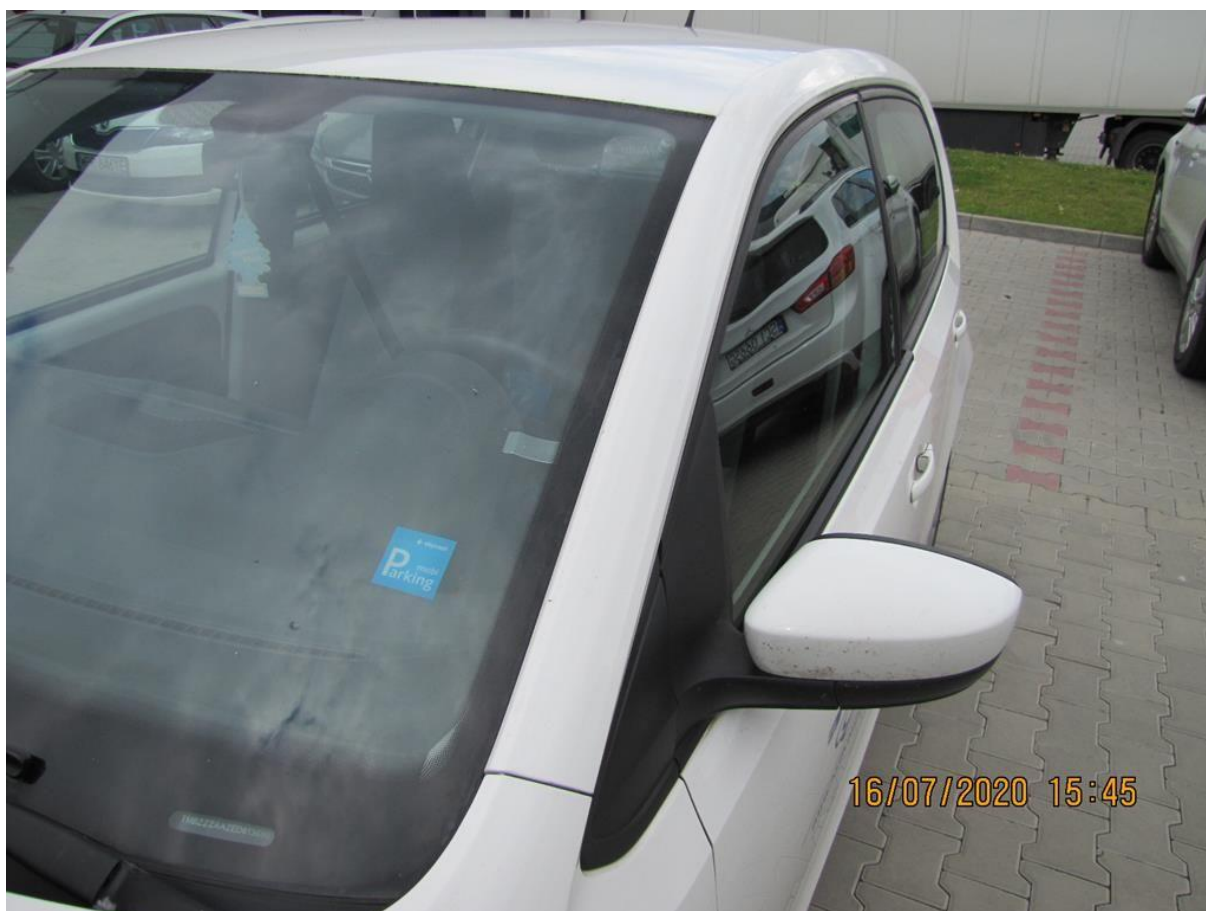
Fot. nr 80