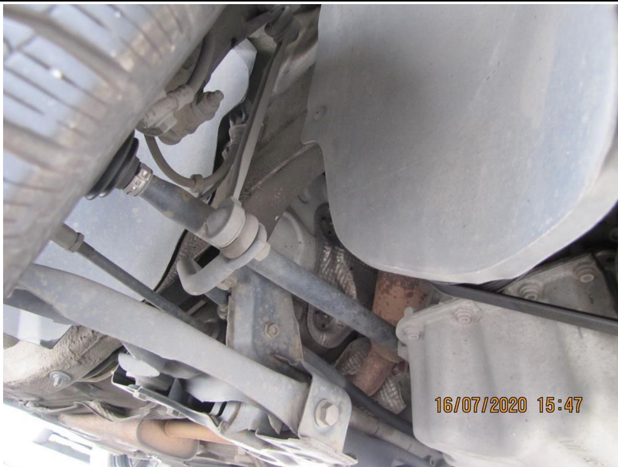
Fot. nr 107