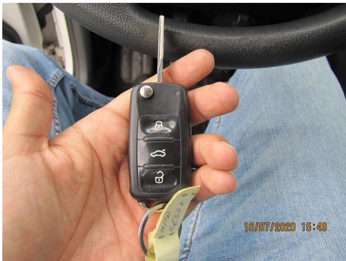
Fot. nr 126