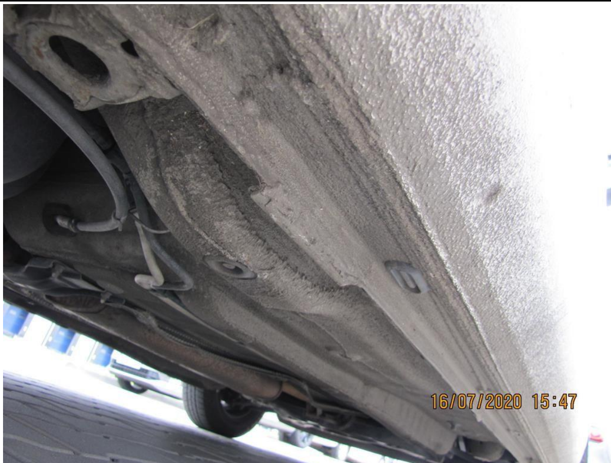
Fot. nr 105