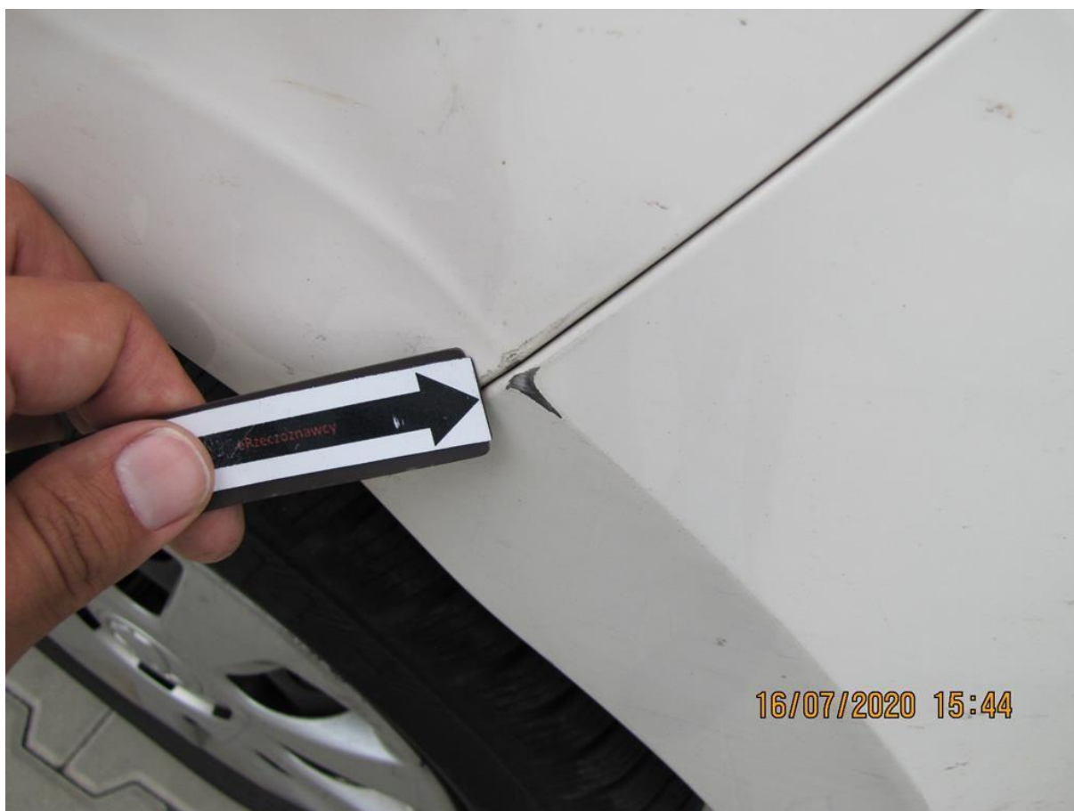
Fot. nr 72