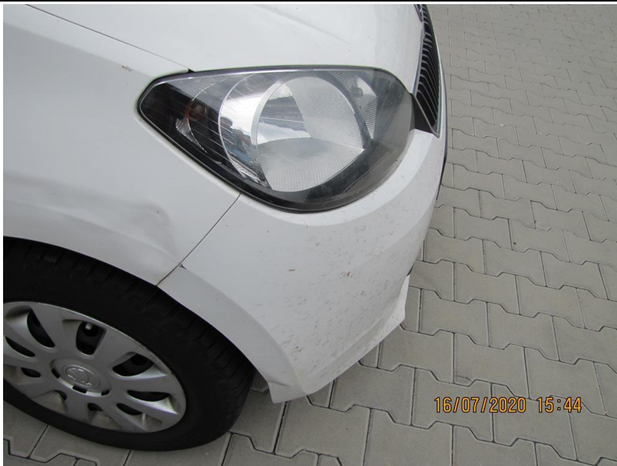
Fot. nr 71