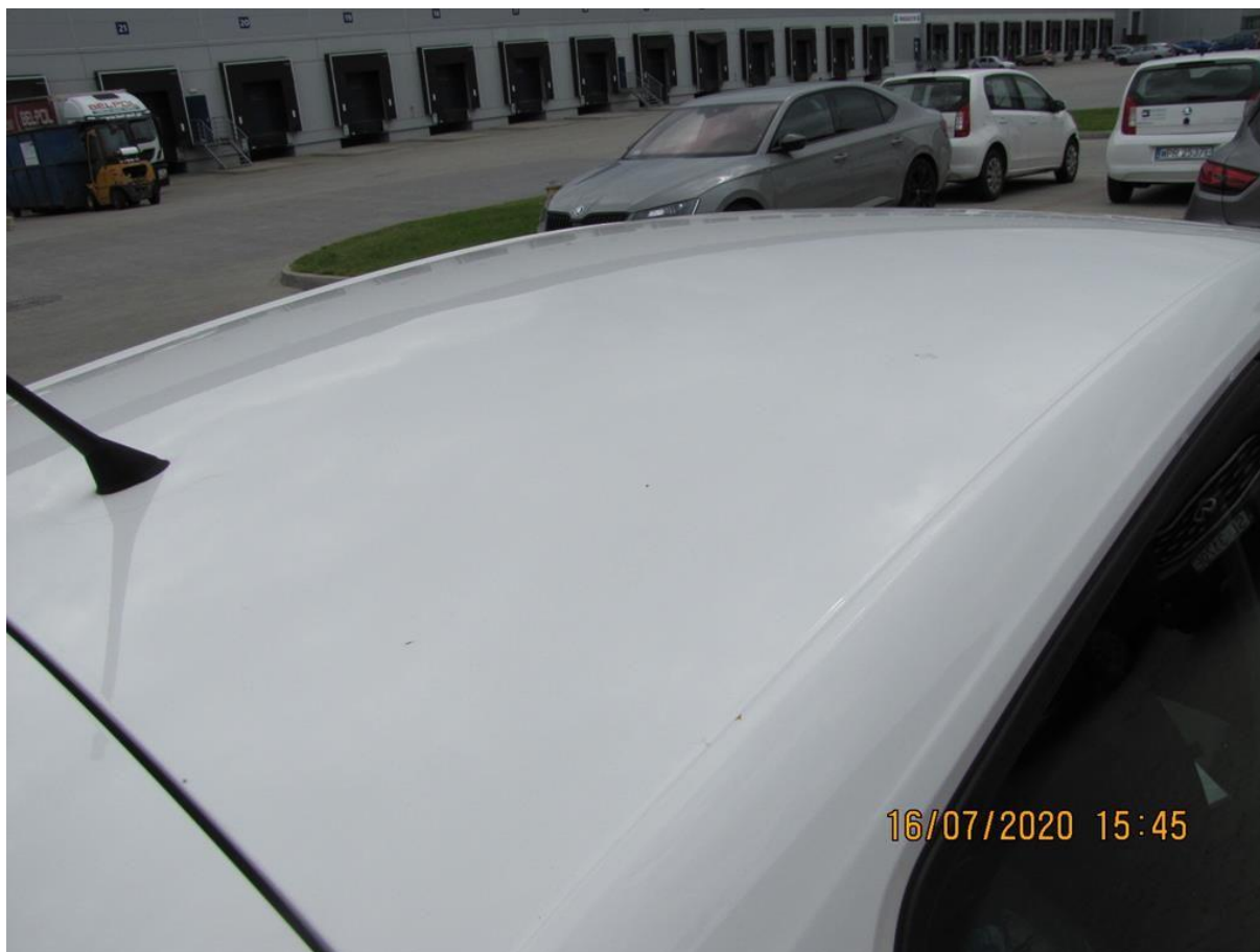
Fot. nr 84