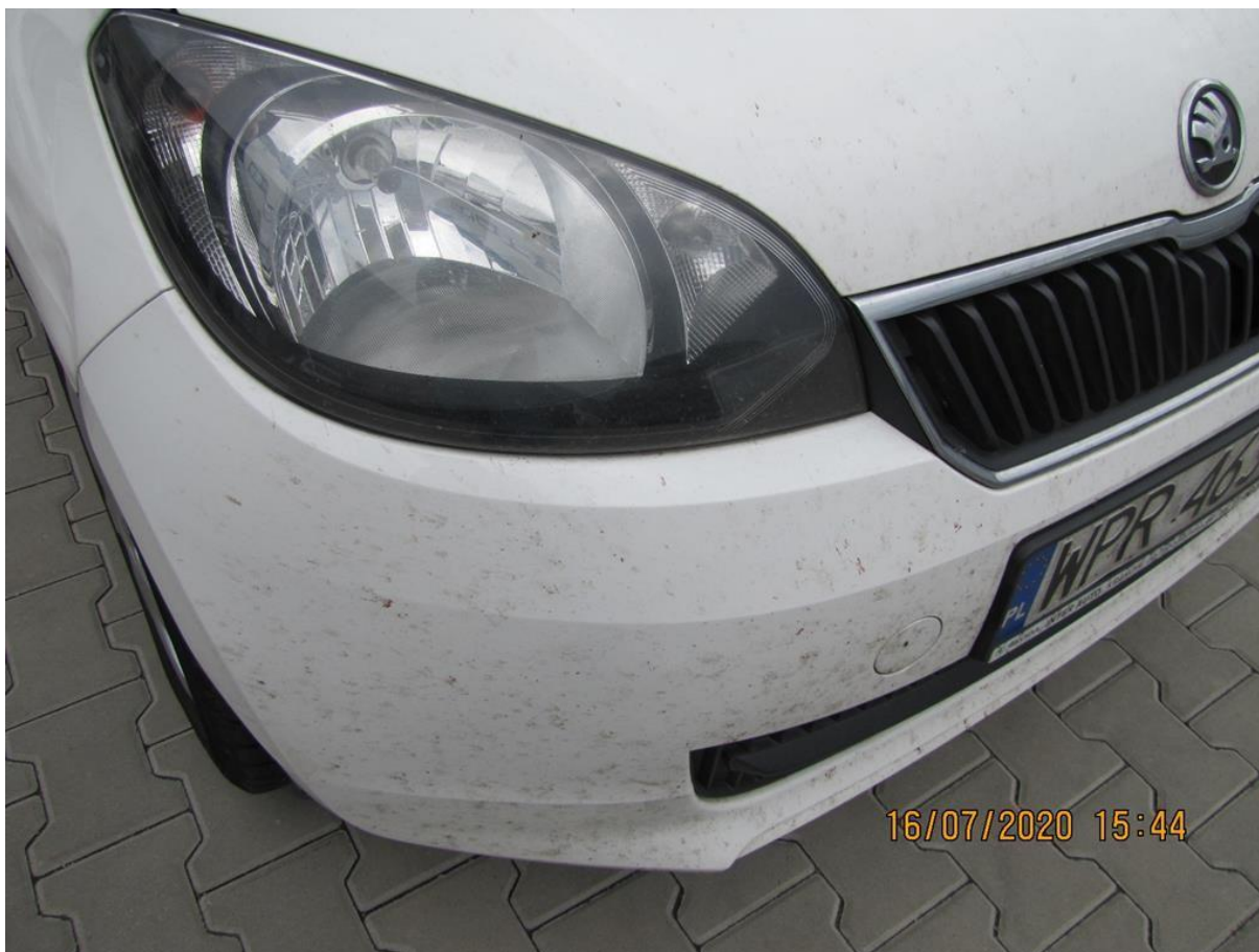
Fot. nr 74