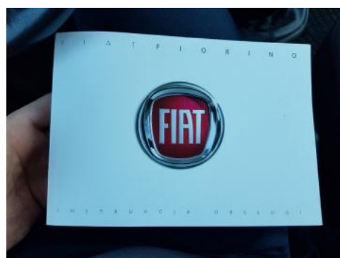
Fot. 24 Instrukcja obsługi