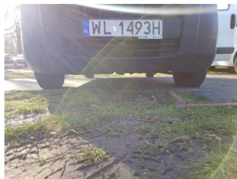
Fot. 18 Spód pojazdu przód