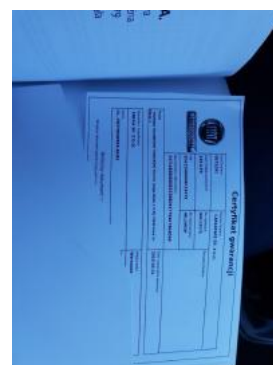
Fot. 22 Książka serwisowa (dane pojazdu)