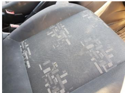
Fot. 36 Fotel prawy (zabrudzenia)