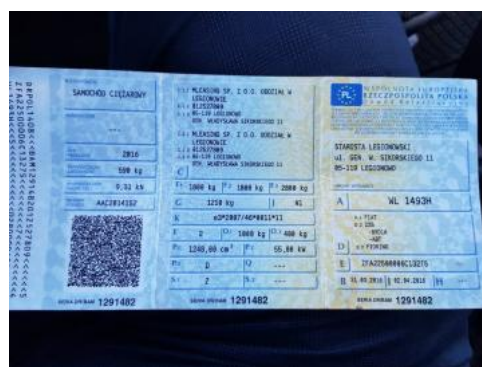
Fot. 20 Dowód rejestracyjny 1. strona