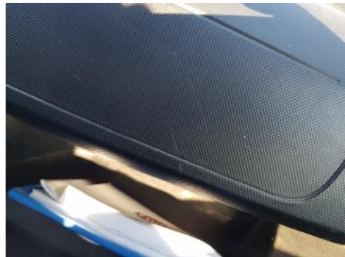
Fot. 34 Deska rozdzielcza (Rysa/Odprysk)