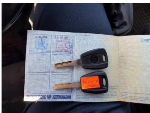
Fot. 21 Dowód rejestracyjny 2. strona / klucze