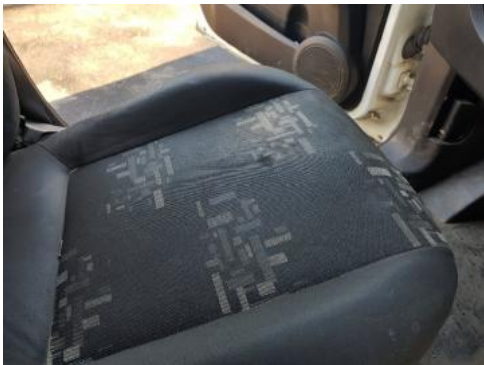
Fot. 33 Fotel lewy (zabrudzenia)