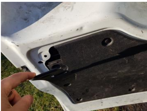
Fot. 37 Wykładzina drzwi tyłu lewe (Pęknięcie/Rozerwanie)