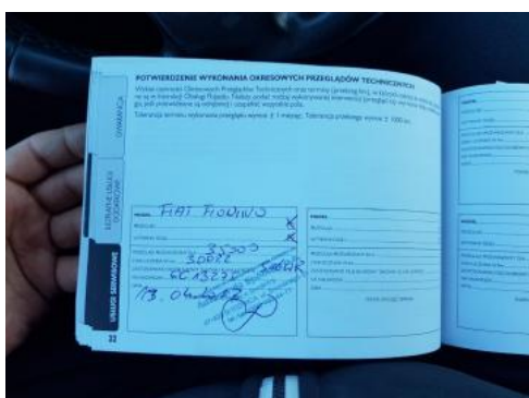
Fot. 23 Książka serwisowa - ostatni przegląd