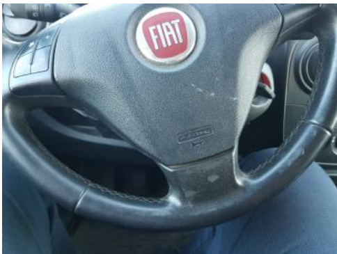
Fot. 35 Koło kierownicy (wytarcia)