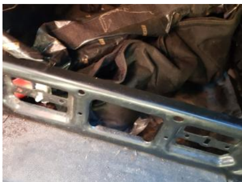
Fot. 17 Koło zapasowe/trójkąt/gaśnica