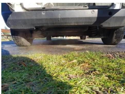
Fot. 19 Spód pojazdu tył