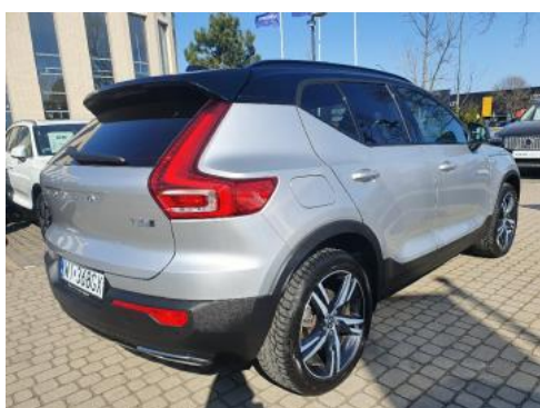
Fot. 3 Prawy bok tył