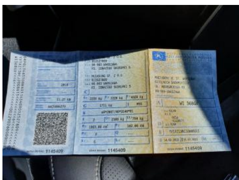
Fot. 21 Dowód rejestracyjny 1. strona