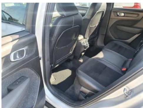
Fot. 11 Widok przez lewe tylne drzwi