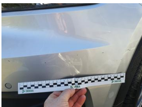
Fot. 27 Zderzak (Rysa/Odprysk)