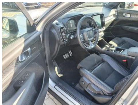
Fot. 10 Widok przez lewe przednie drzwi