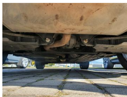
Fot. 20 Spód pojazdu tył