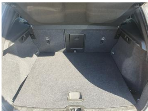
Fot. 17 Bagażnik