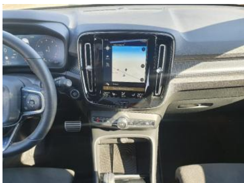
Fot. 13 Konsola środkowa