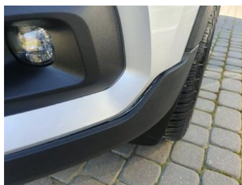
Fot. 28 Zderzak (Inne)