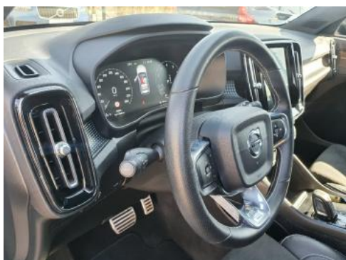
Fot. 15 Kierownica widok z lewej strony (widoczne przełączniki)