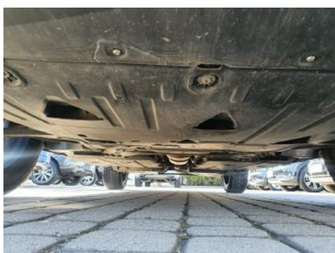
Fot. 19 Spód pojazdu przód