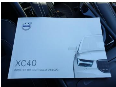
Fot. 25 Instrukcja obsługi