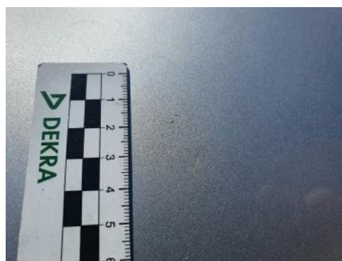
Fot. 30 Pokrywa komory silnika (Rysa/Odprysk)