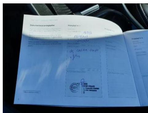
Fot. 24 Książka serwisowa - ostatni przegląd