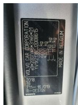
Fot. 8 Tabliczka