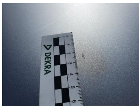
Fot. 32 Pokrywa komory silnika (Rysa/Odprysk 2)