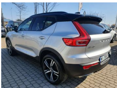
Fot. 5 Lewy bok tył