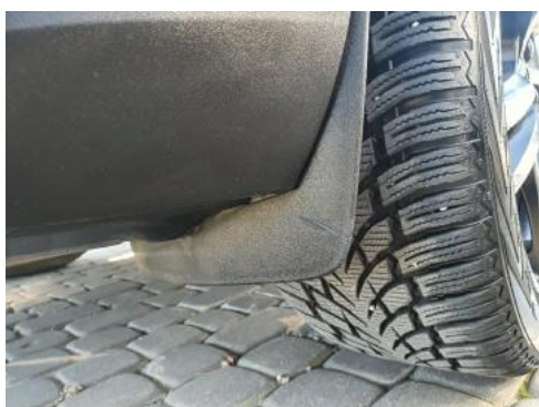
Fot. 29 Spoiler zderzaka przedniego (Rysa/Odprysk)