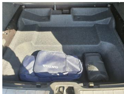
Fot. 18 Koło zapasowe/trójkąt/gaśnica