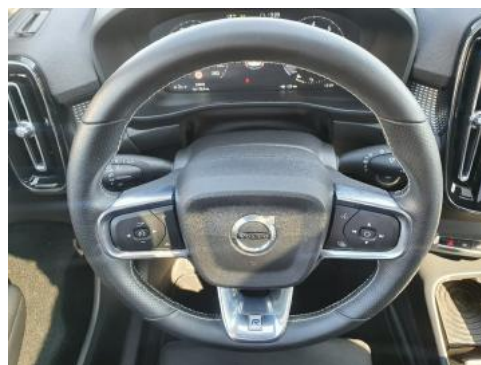
Fot. 26 Zdjęcie do protokołu