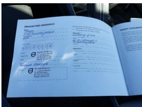
Fot. 23 Książka serwisowa (dane pojazdu)