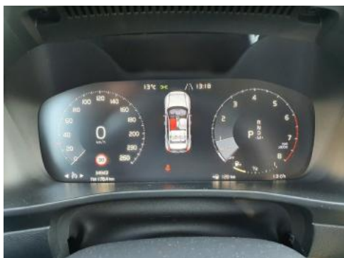
Fot. 9 Wskaźniki /przebieg/paliwo