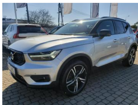
Fot. 6 Lewy bok przód