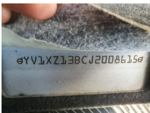
Fot. 7 Pole numerowe