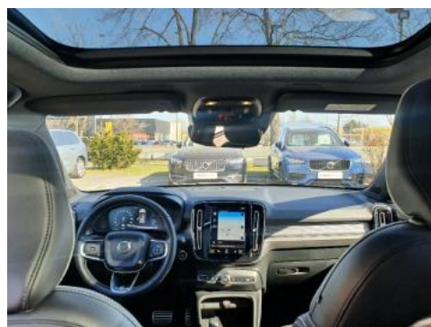
Fot. 12 Widok z tylnego siedzenia