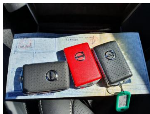
Fot. 22 Dowód rejestracyjny 2. strona / klucze