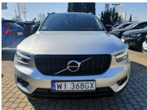
Fot. 1 Przód