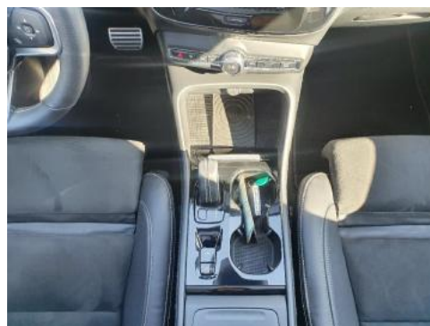
Fot. 14 Tunel środkowy