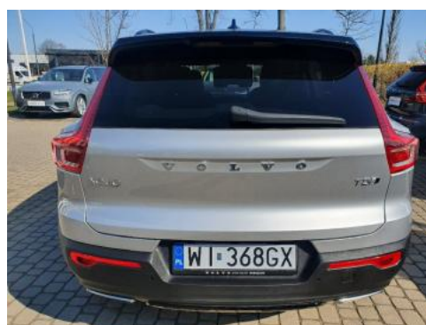
Fot. 4 Tył