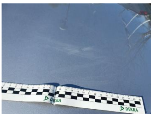
Fot. 31 Pokrywa komory silnika (Rysa/Odprysk 1)