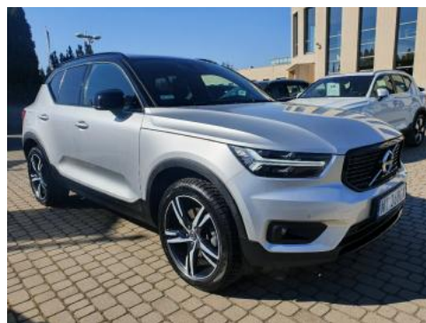
Fot. 2 Prawy bok przód