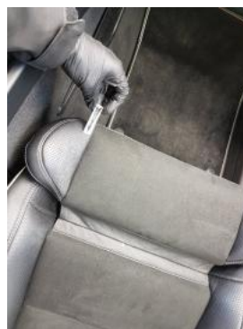
Fot. 42 Fotel prawy (Zdjęcie poglądowe 1)