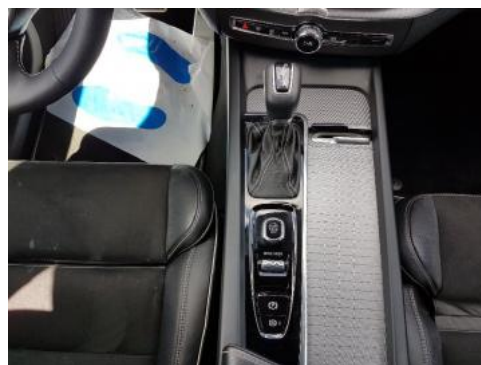
Fot. 14 Tunel środkowy