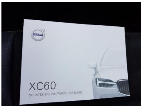
Fot. 25 Instrukcja obsługi