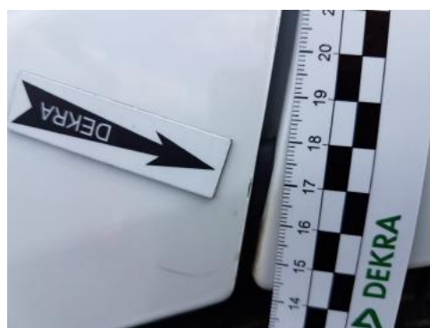
Fot. 32 Drzwi tylne lewe (Rysa/Odprysk)