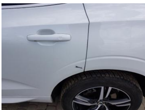
Fot. 31 Drzwi tylne lewe (Zdjęcie poglądowe 1)