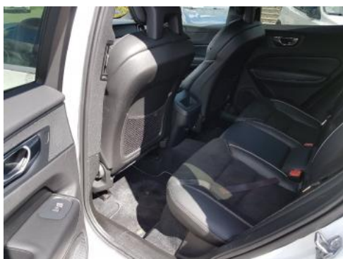
Fot. 11 Widok przez lewe tylne drzwi