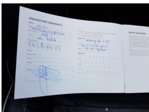
Fot. 23 Książka serwisowa (dane pojazdu)