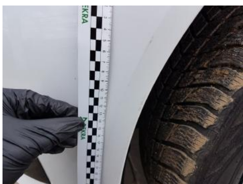
Fot. 27 Zderzak (Rysa/Odprysk)