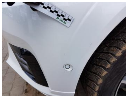
Fot. 26 Zderzak (Zdjęcie poglądowe 1)