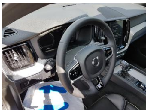
Fot. 15 Kierownica widok z lewej strony (widoczne przełączniki)