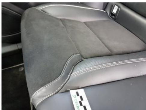
Fot. 41 Kanapa tylna (Inne 2)