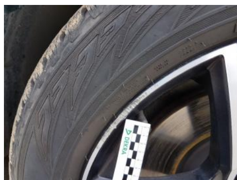
Fot. 30 Felga przednia prawa (Rysa/Odprysk)