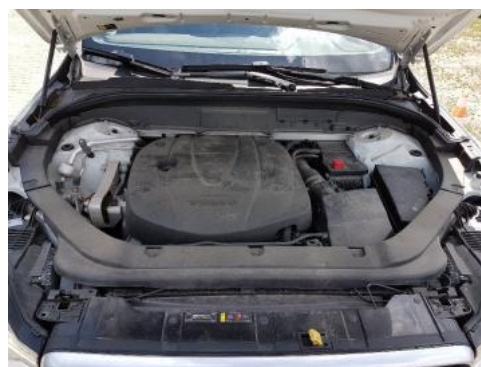
Fot. 16 Komora silnika