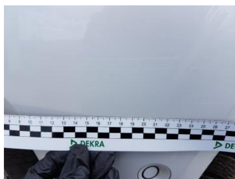
Fot. 28 Zderzak (Rysa/Odprysk 1)