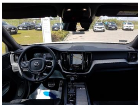
Fot. 12 Widok z tylnego siedzenia