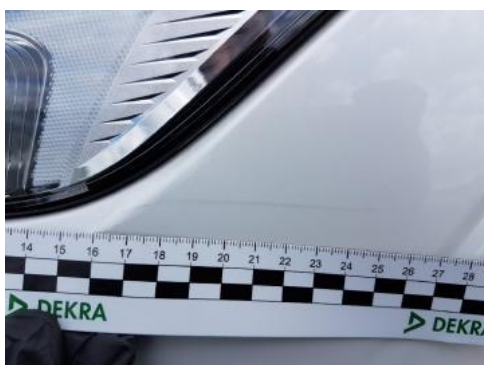
Fot. 29 Zderzak (Rysa/Odprysk 2)