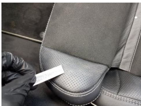
Fot. 43 Fotel prawy (Inne)