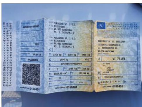
Fot. 23 Dowód rejestracyjny 1. strona