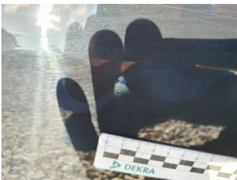
Fot. 37 Drzwi tylne lewe (wady lakiernicze)