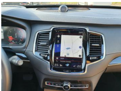
Fot. 13 Konsola środkowa