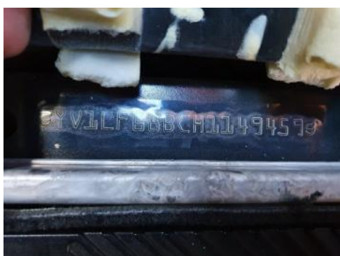
Fot. 7 Pole numerowe