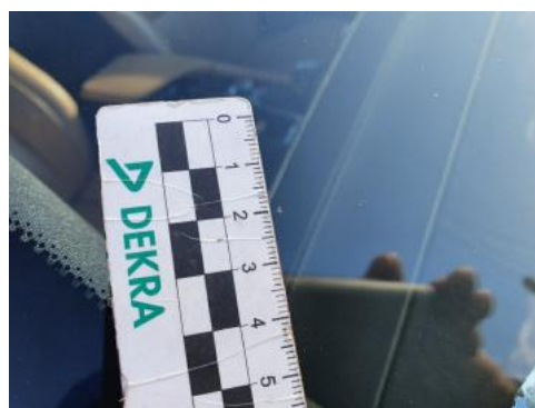
Fot. 30 Szyba czołowa (Rysa/Odprysk)