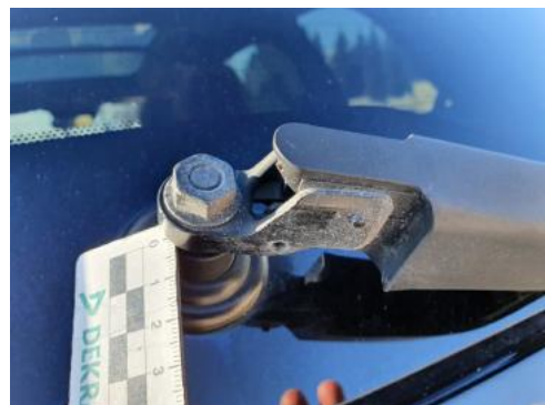
Fot. 36 Ramię tylnej wycieraczki (niekompletne)