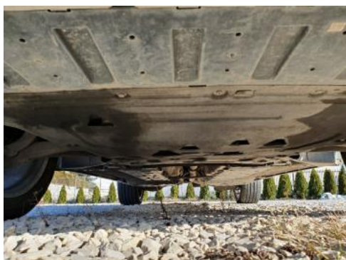
Fot. 21 Spód pojazdu przód