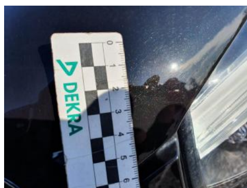
Fot. 28 Pokrywa komory silnika (Rysa/Odprysk)