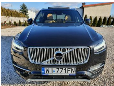
Fot. 1 Przód