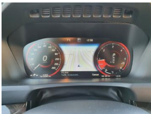
Fot. 9 Wskaźniki /przebieg/paliwo