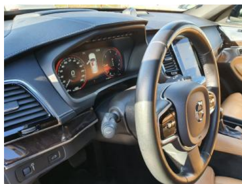
Fot. 16 Kierownica widok z lewej strony (widoczne przełączniki)