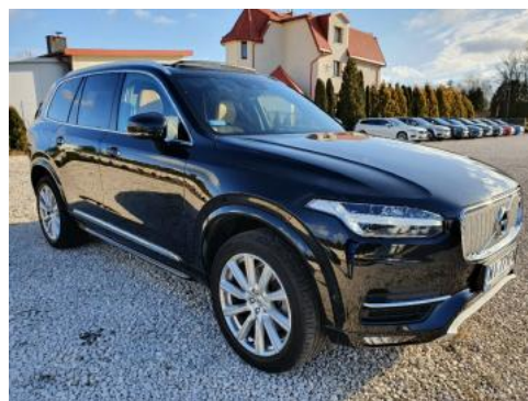
Fot. 2 Prawy bok przód