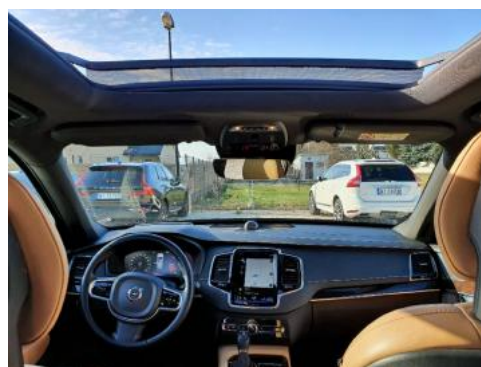
Fot. 12 Widok z tylnego siedzenia