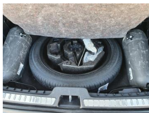
Fot. 20 Koło zapasowe/trójkąt/gaśnica