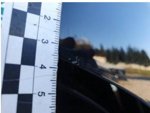
Fot. 35 Drzwi tylne prawe (Rysa/Odprysk 1)