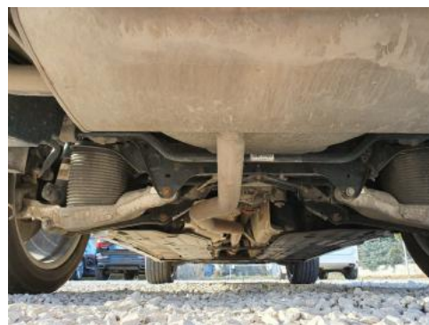
Fot. 22 Spód pojazdu tył