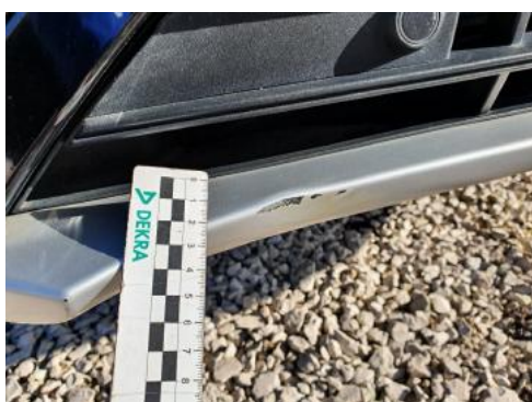
Fot. 27 Zderzak (Wgniecie./Odształ. 2)