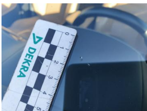
Fot. 31 Szyba czołowa (Rysa/Odprysk 1)