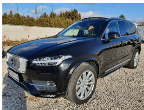
Fot. 6 Lewy bok przód