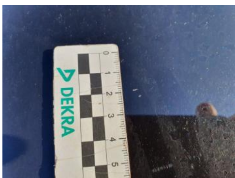
Fot. 29 Pokrywa komory silnika (Rysa/Odprysk 1)