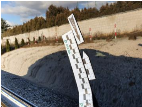
Fot. 33 Drzwi przednie prawe (Wgniecie./Odształ.)