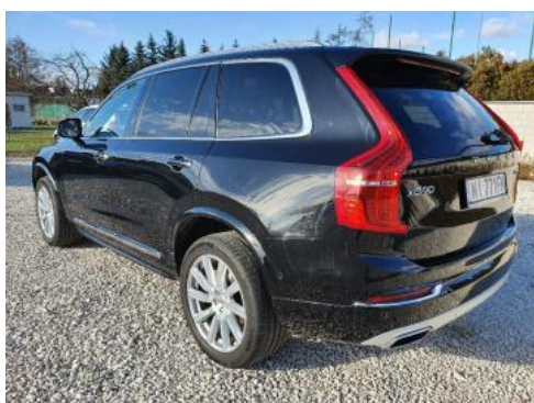
Fot. 5 Lewy bok tył