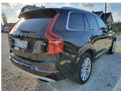
Fot. 3 Prawy bok tył