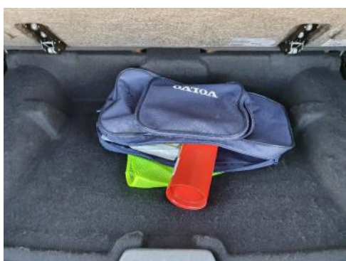
Fot. 19 Koło zapasowe/trójkąt/gaśnica