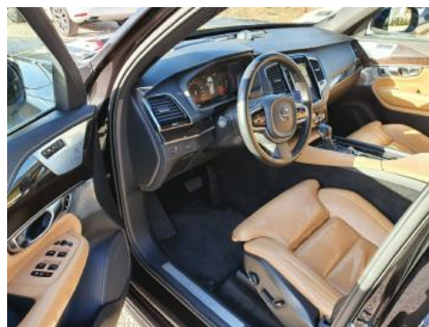
Fot. 10 Widok przez lewe przednie drzwi