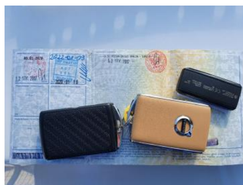
Fot. 24 Dowód rejestracyjny 2. strona / klucze