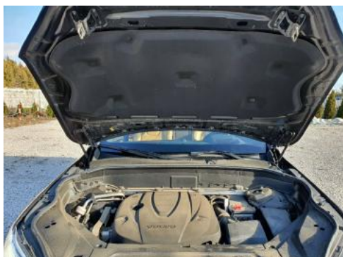
Fot. 17 Komora silnika