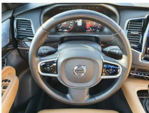
Fot. 15 Zdjęcie do protokołu