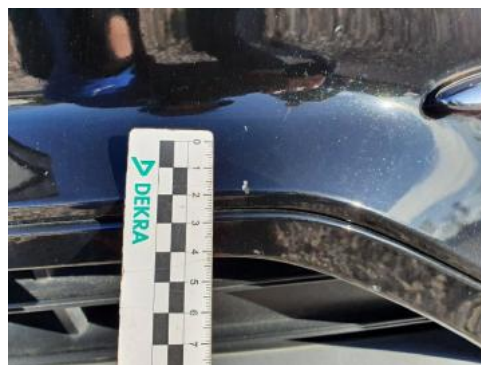
Fot. 26 Zderzak (Wgniecie./Odształ. 1)