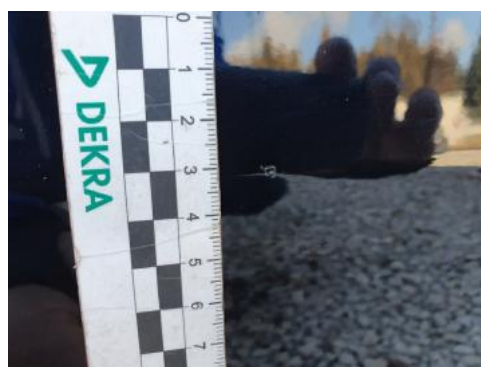
Fot. 32 Drzwi przednie prawe (Rysa/Odprysk)