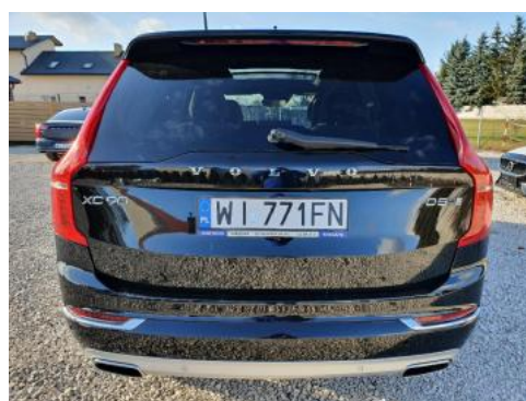
Fot. 4 Tył