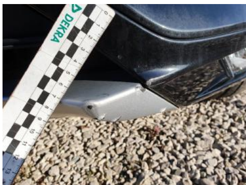
Fot. 25 Zderzak (Wgniecie./Odształ.)