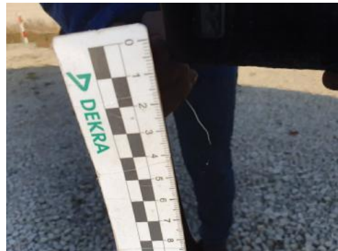
Fot. 34 Drzwi tylne prawe (Rysa/Odprysk)