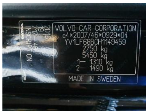
Fot. 8 Tabliczka