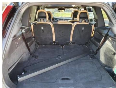
Fot. 18 Bagażnik