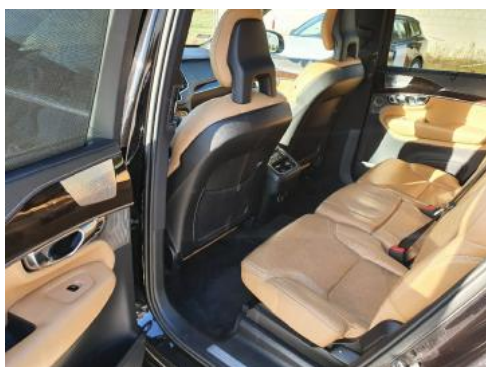
Fot. 11 Widok przez lewe tylne drzwi