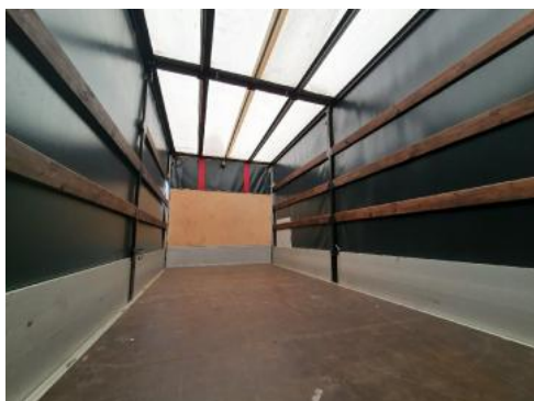
Fot. 17 Bagażnik