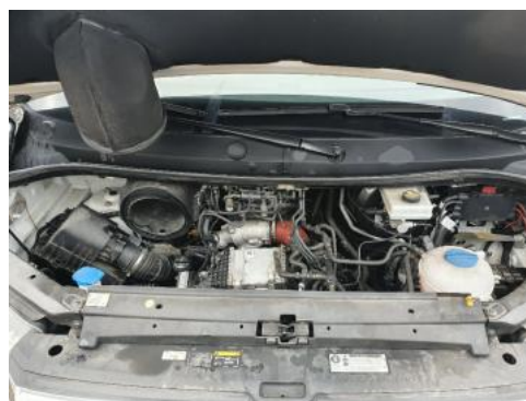
Fot. 16 Komora silnika