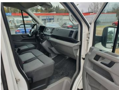
Fot. 11 Widok przez lewe tylne drzwi