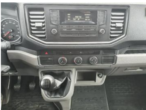
Fot. 13 Konsola środkowa