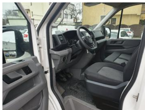
Fot. 10 Widok przez lewe przednie drzwi