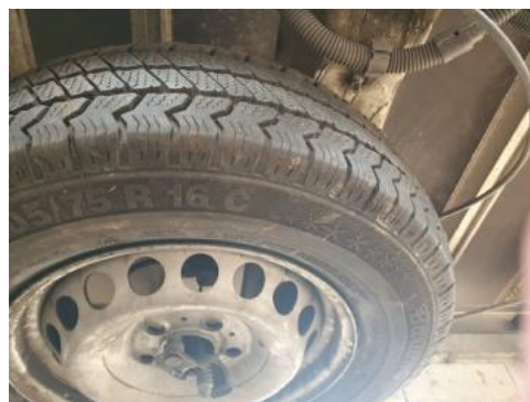
Fot. 18 Koło zapasowe/trójkąt/gaśnica