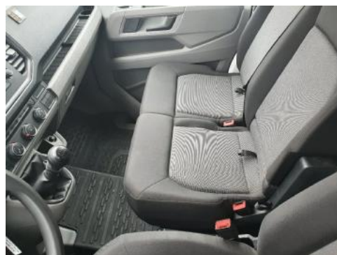
Fot. 14 Tunel środkowy