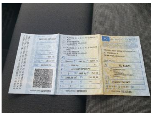
Fot. 21 Dowód rejestracyjny 1. strona