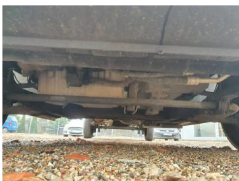
Fot. 19 Spód pojazdu przód