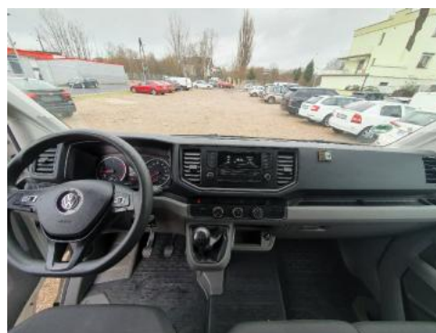
Fot. 12 Widok z tylnego siedzenia