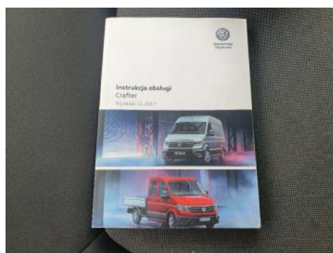
Fot. 24 Instrukcja obsługi