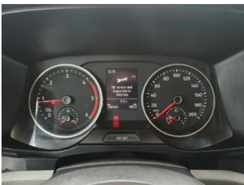
Fot. 9 Wskaźniki /przebieg/paliwo