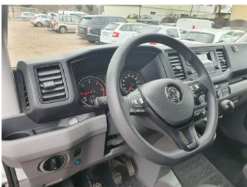
Fot. 15 Kierownica widok z lewej strony (widoczne przełączniki)