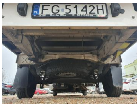
Fot. 20 Spód pojazdu tył