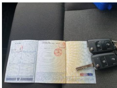
Fot. 22 Dowód rejestracyjny 2. strona / klucze