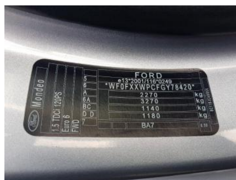
Fot. 8 Tabliczka