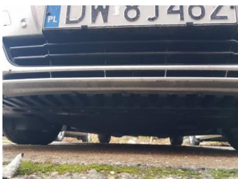
Fot. 19 Spód pojazdu przód