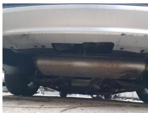
Fot. 20 Spód pojazdu tył