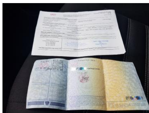
Fot. 22 Dowód rejestracyjny 2. strona / klucze