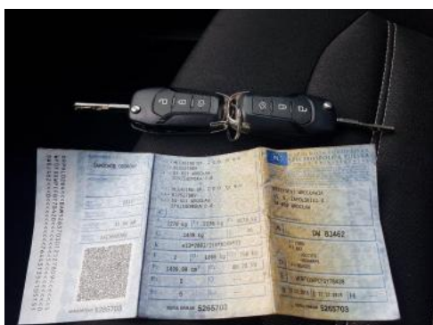
Fot. 21 Dowód rejestracyjny 1. strona