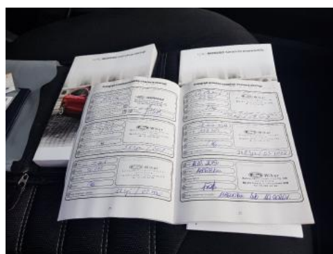
Fot. 24 Książka serwisowa - ostatni przegląd