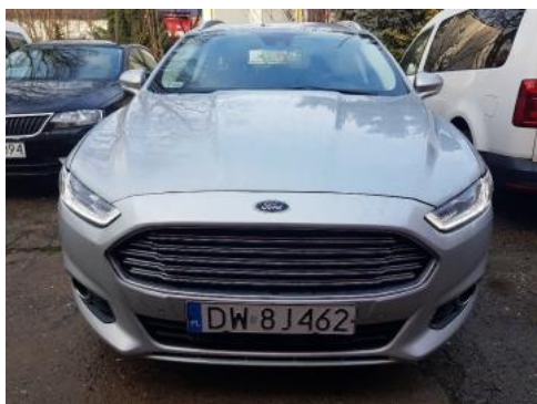
Fot. 1 Przód