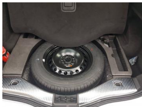
Fot. 18 Koło zapasowe/trójkąt/gaśnica