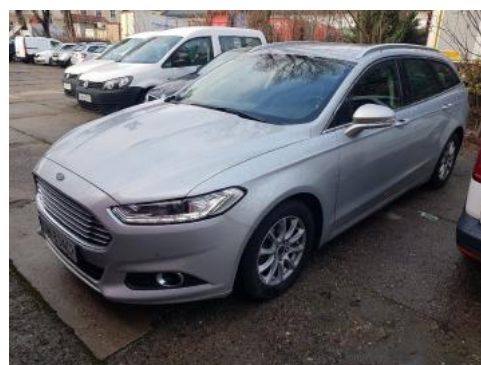
Fot. 6 Lewy bok przód