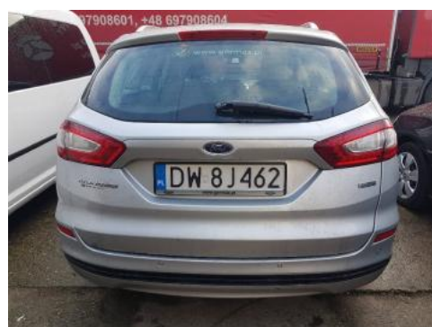
Fot. 4 Tył