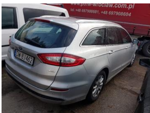
Fot. 3 Prawy bok tył