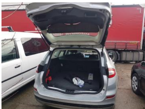
Fot. 17 Bagażnik