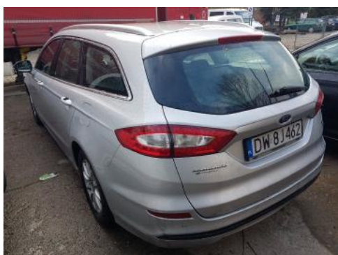
Fot. 5 Lewy bok tył