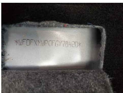
Fot. 7 Pole numerowe