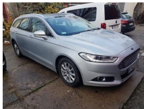
Fot. 2 Prawy bok przód