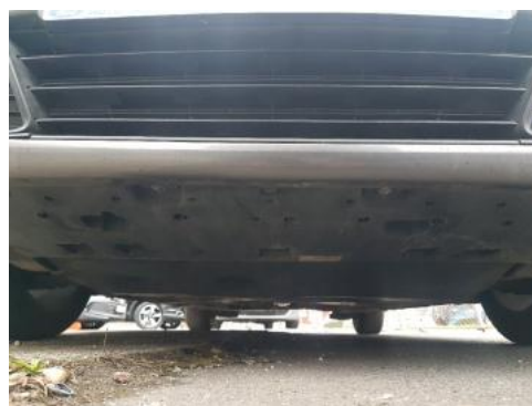
Fot. 20 Spód pojazdu przód