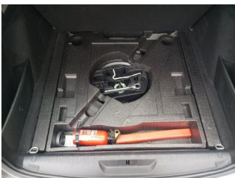
Fot. 19 Koło zapasowe/trójkąt/gaśnica