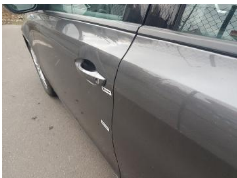
Fot. 31 Drzwi przednie lewe (Zdjęcie pogładowe 1)