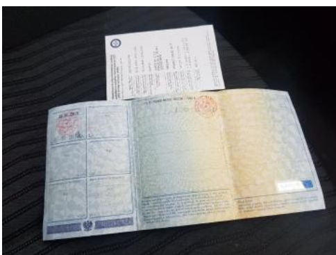
Fot. 23 Dowód rejestracyjny 2. strona / klucze