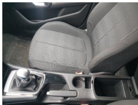
Fot. 14 Tunel środkowy