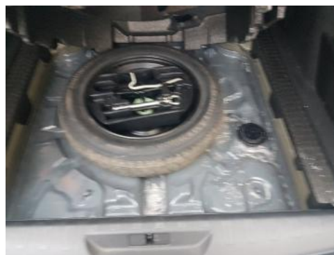
Fot. 18 Koło zapasowe/trójkąt/gaśnica