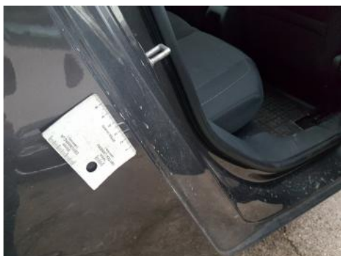
Fot. 29 Błotnik tylny prawy/ściana boczna prawa (Zdjęcie pogładowe 1)