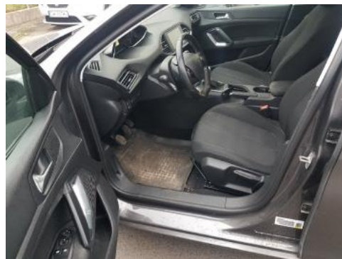
Fot. 10 Widok przez lewe przednie drzwi