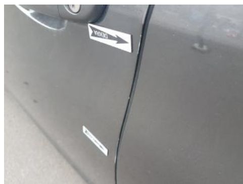
Fot. 32 Drzwi przednie lewe (Rysa/Odprysk)