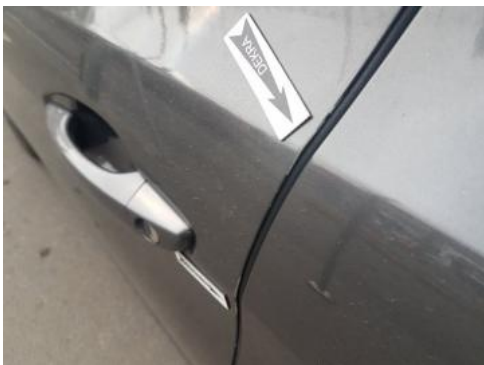
Fot. 33 Drzwi przednie lewe (Rysa/Odprysk 2)