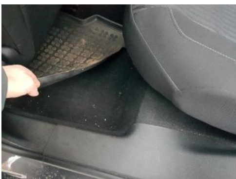
Fot. 35 Zabrudzenia