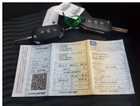
Fot. 22 Dowód rejestracyjny 1. strona