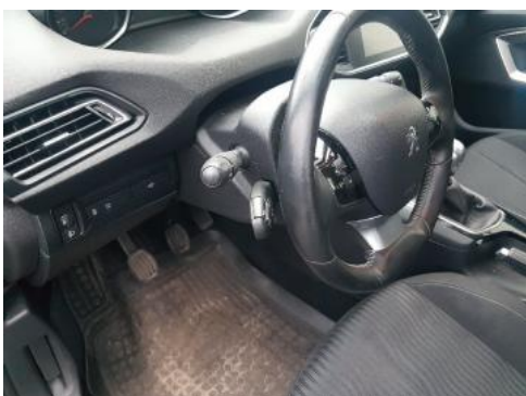
Fot. 15 Kierownica widok z lewej strony (widoczne przełączniki)