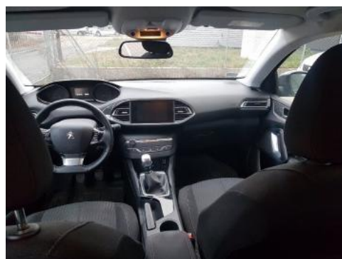
Fot. 12 Widok z tylnego siedzenia