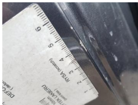
Fot. 30 Błotnik tylny prawy/ściana boczna prawa (Rysa/Odprysk)