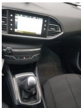
Fot. 13 Konsola środkowa