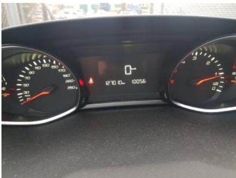
Fot. 9 Wskaźniki /przebieg/paliwo