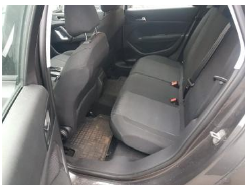
Fot. 11 Widok przez lewe tylne drzwi