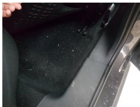
Fot. 36 Zabrudzenia