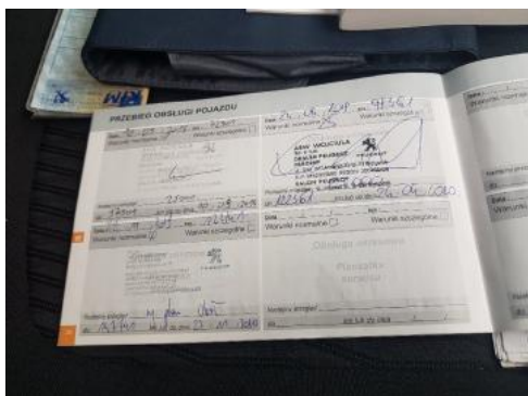
Fot. 25 Książka serwisowa - ostatni przegląd