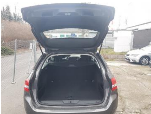
Fot. 17 Bagażnik