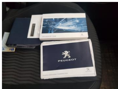
Fot. 26 Instrukcja obsługi