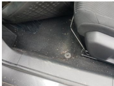
Fot. 34 Zabrudzenia