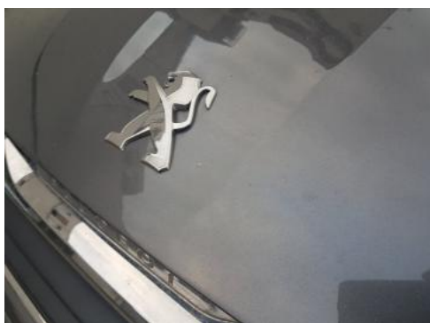
Fot. 27 Pokrywa komory silnika (Zdjęcie pogładowe 1)