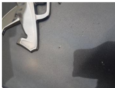
Fot. 28 Pokrywa komory silnika (Rysa/Odprysk)