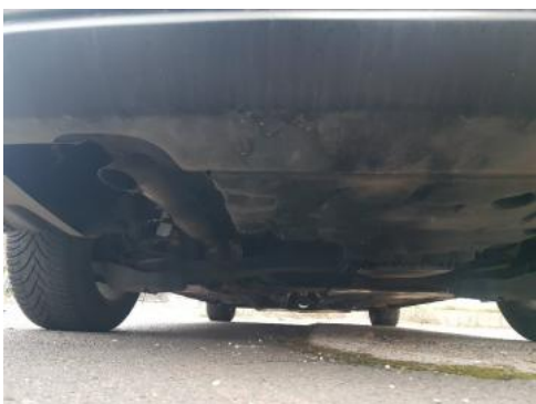
Fot. 21 Spód pojazdu tył