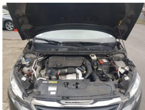
Fot. 16 Komora silnika