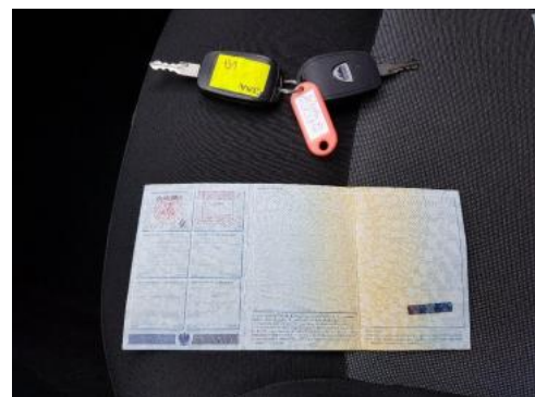
Fot. 22 Dowód rejestracyjny 2. strona / klucze