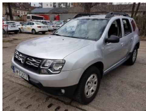
Fot. 6 Lewy bok przód