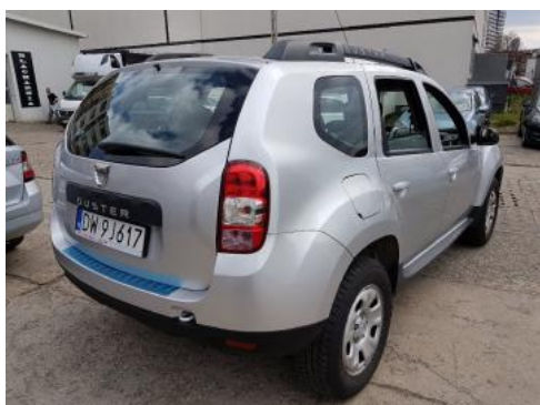
Fot. 3 Prawy bok tył