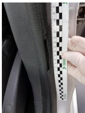
Fot. 41 Uszczelka drzwi przednich lewych (Pęknięcie/Rozerwanie)