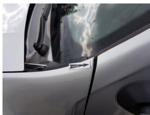
Fot. 36 Błotnik przedni lewy (Zdjęcie pogładowe 1)