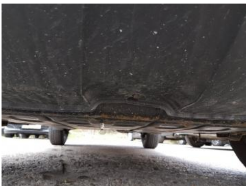
Fot. 19 Spód pojazdu przód