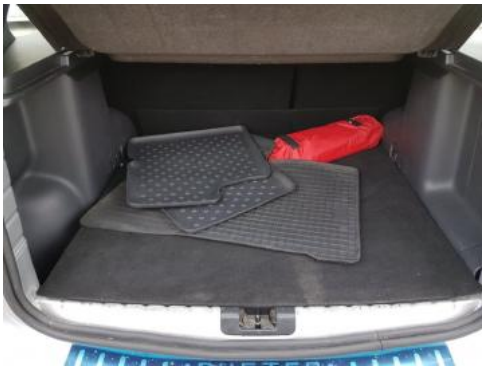
Fot. 17 Bagażnik