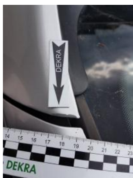
Fot. 37 Błotnik przedni lewy (Rysa/Odprysk)