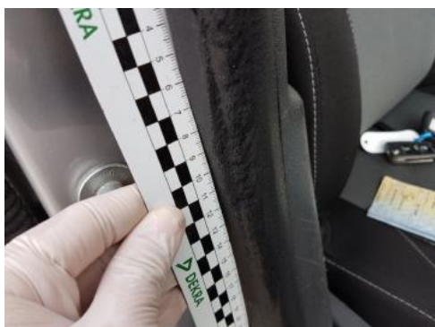
Fot. 47 Uszczelka drzwi przednich prawych (przetarcie)