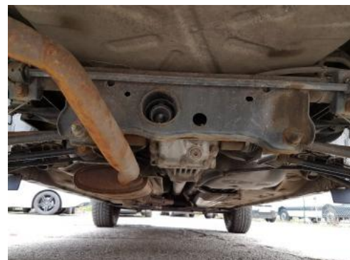
Fot. 20 Spód pojazdu tył