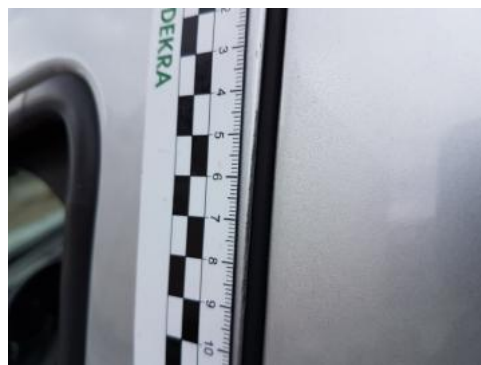
Fot. 34 Drzwi przednie lewe (Rysa/Odprysk)