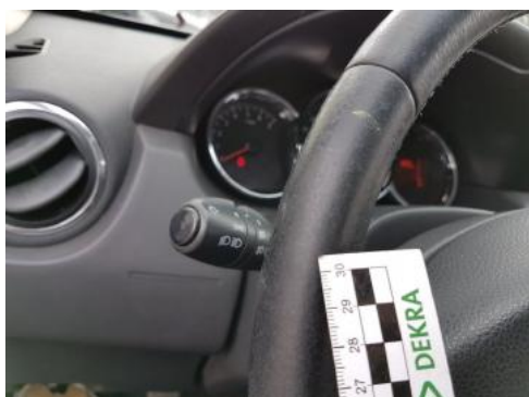
Fot. 43 Koło kierownicy (wytarcia)