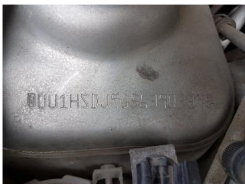
Fot. 7 Pole numerowe