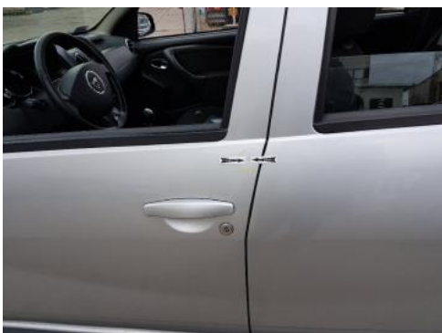
Fot. 33 Drzwi przednie lewe (Zdjęcie pogładowe 1)