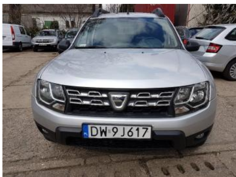
Fot. 1 Przód