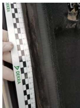
Fot. 48 Uszczelka drzwi przednich prawych (przetarcie)