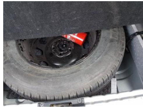
Fot. 18 Koło zapasowe/trójkąt/gaśnica