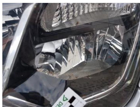
Fot. 38 Reflektor lewy (zabrudzenia)