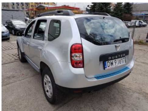
Fot. 5 Lewy bok tył