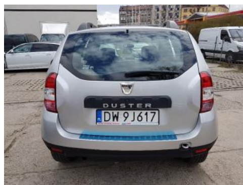
Fot. 4 Tył