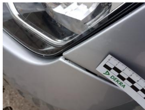
Fot. 26 Zderzak (Zdjęcie poglądowe 1)