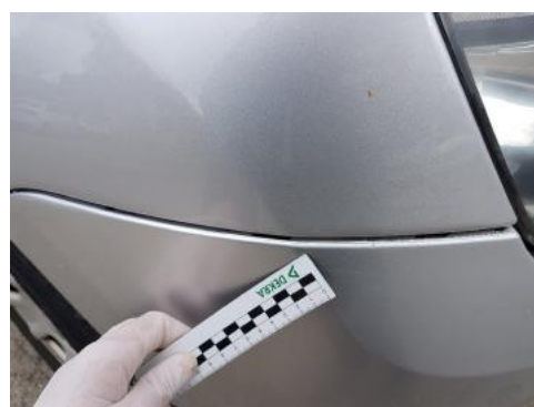
Fot. 28 Zderzak (nieprawidłowe zamocowanie)