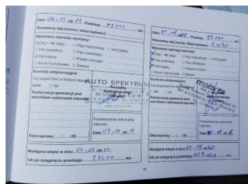
Fot. 24 Książka serwisowa - ostatni przegląd