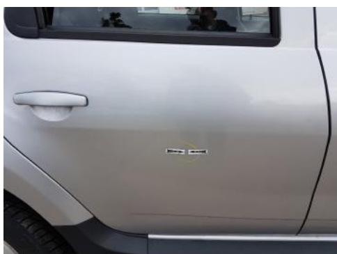
Fot. 29 Drzwi tylne prawe (Zdjęcie poglądowe 1)