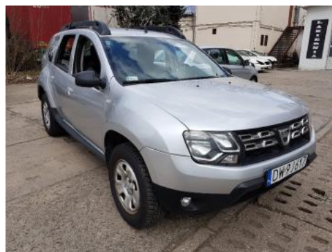
Fot. 2 Prawy bok przód