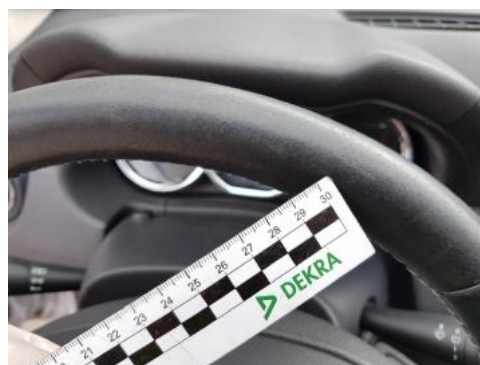
Fot. 44 Koło kierownicy (wytarcia)