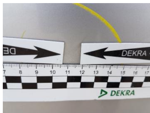
Fot. 30 Drzwi tylne prawe (Wgniecie./Odształ.)