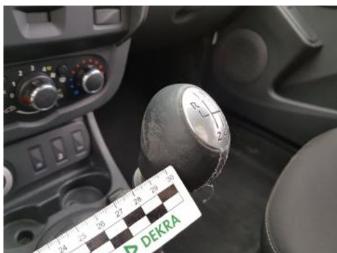
Fot. 45 galka_dzwigni_zmiany_biegow (wytarcia)