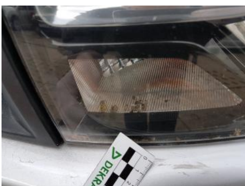
Fot. 39 Reflektor lewy (nieszczelność)