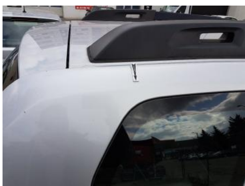
Fot. 31 Błotnik tylny prawy/ściana boczna prawa (Zdjęcie poglądowe 1)