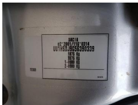
Fot. 8 Tabliczka