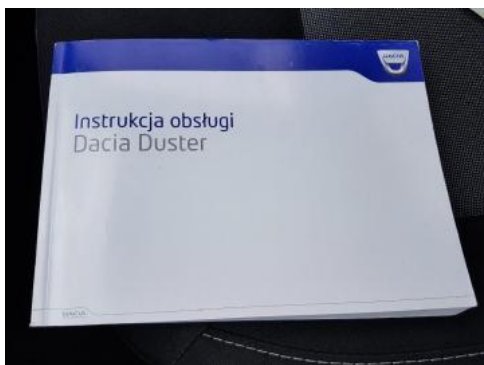
Fot. 25 Instrukcja obsługi