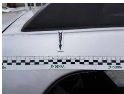
Fot. 32 Błotnik tylny prawy/ściana boczna prawa (Rysa/Odprysk)