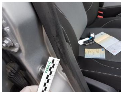
Fot. 46 Uszczelka drzwi przednich prawych (Zdjęcie poglądowe 1)