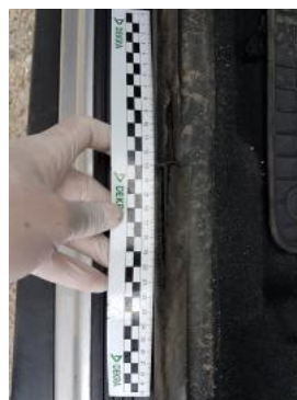
Fot. 42 Uszczelka drzwi przednich lewych (Pęknięcie/Rozerwanie 1)