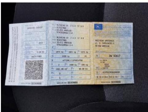
Fot. 21 Dowód rejestracyjny 1. strona