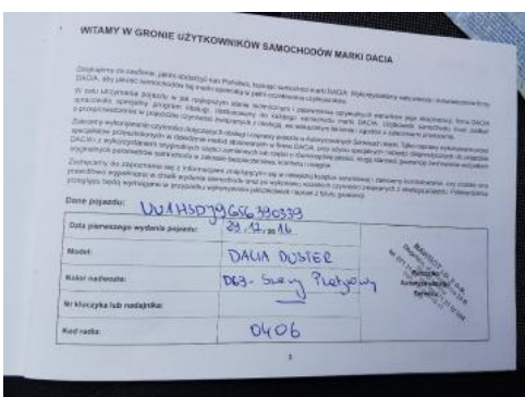
Fot. 23 Książka serwisowa (dane pojazdu)