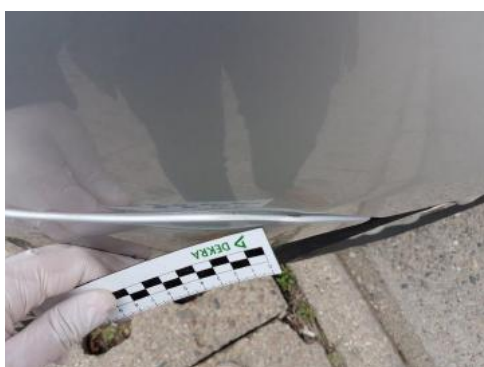
Fot. 27 Zderzak (nieprawidłowe zamocowanie)