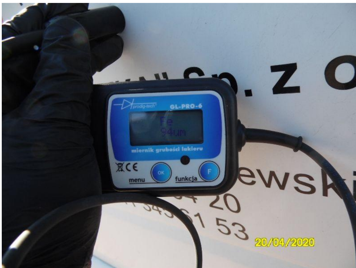
Fot. nr 72