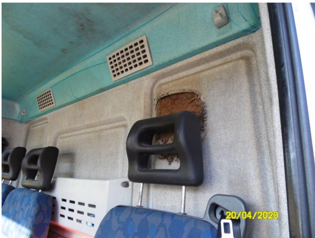
Fot. nr 68