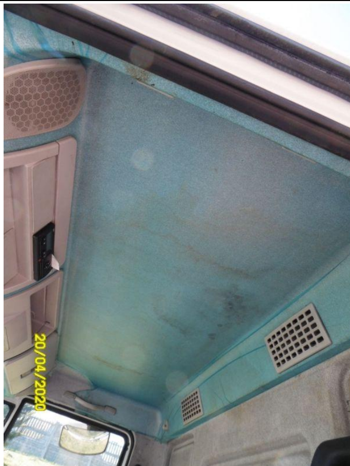
Fot. nr 67