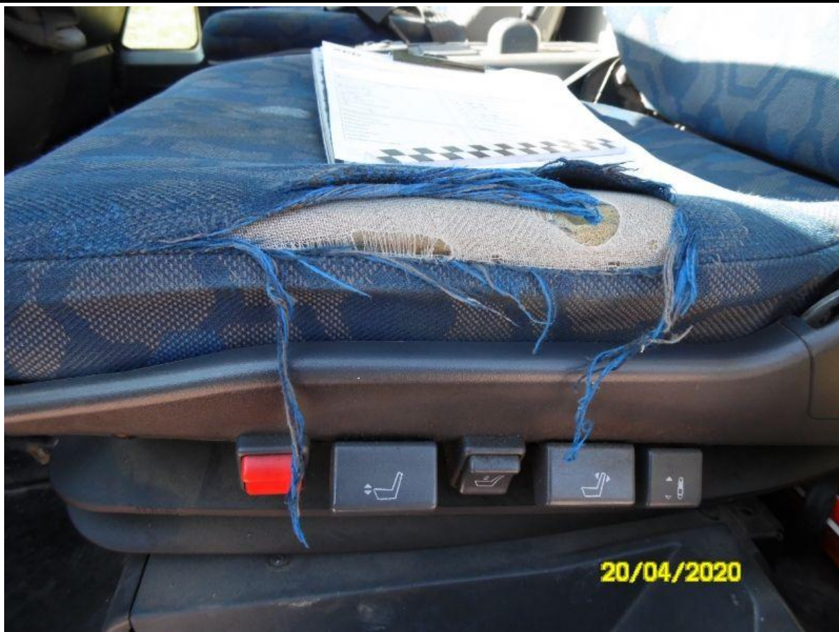
Fot. nr 65