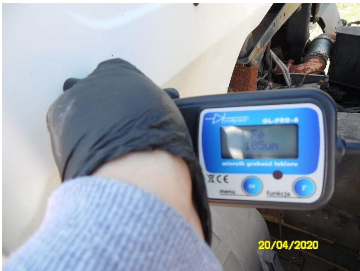
Fot. nr 74