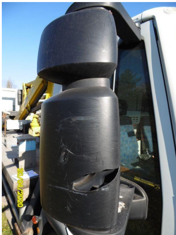
Fot. nr 62