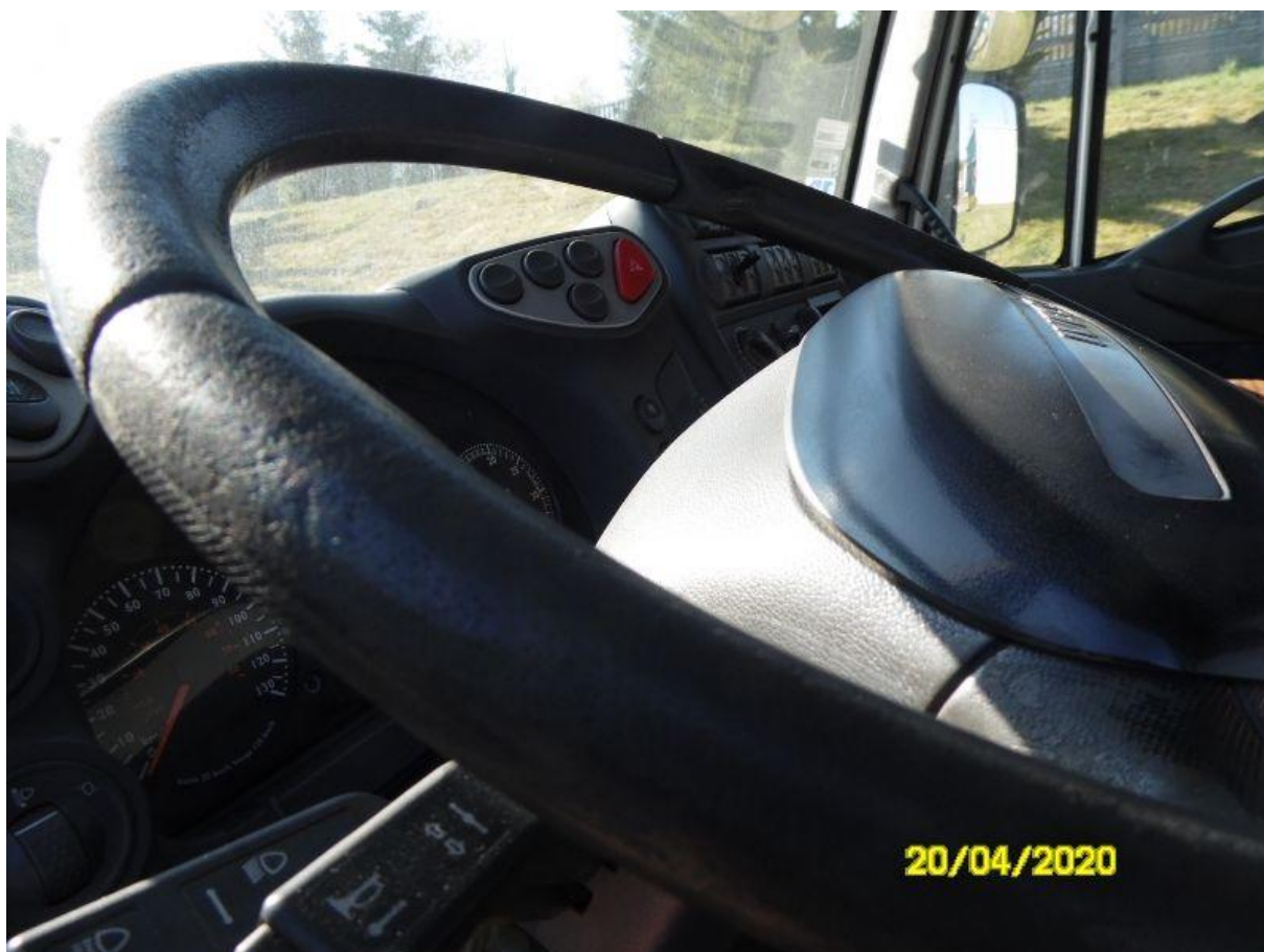
Fot. nr 66