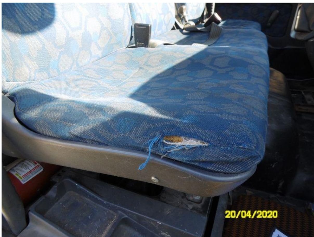
Fot. nr 70