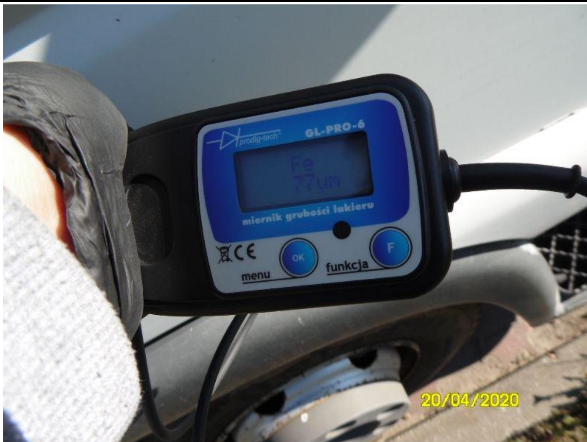
Fot. nr 75