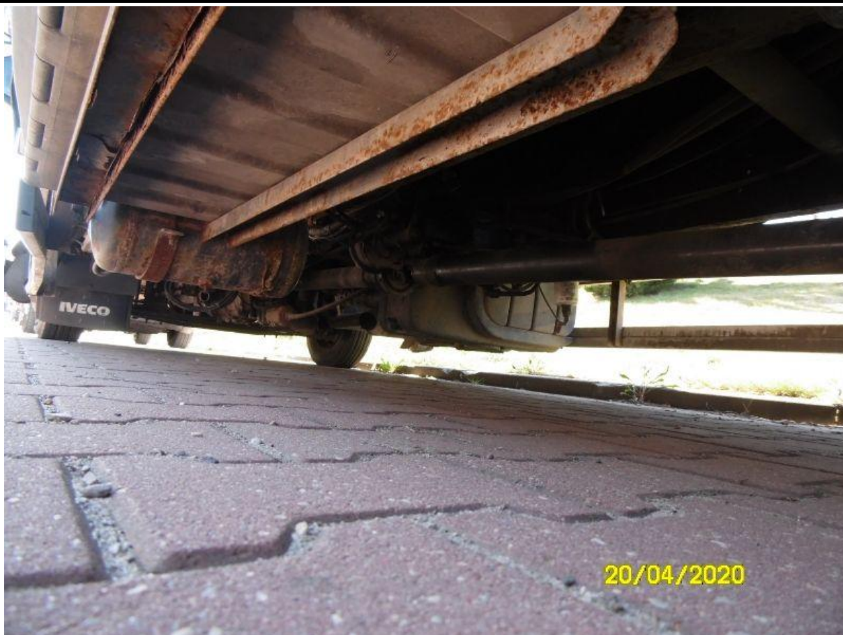
Fot. nr 71