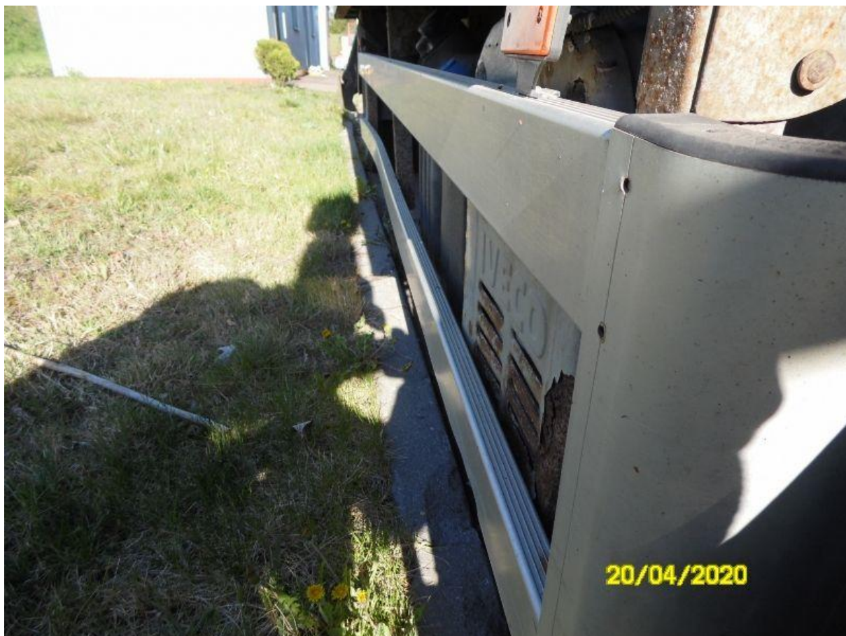
Fot. nr 64