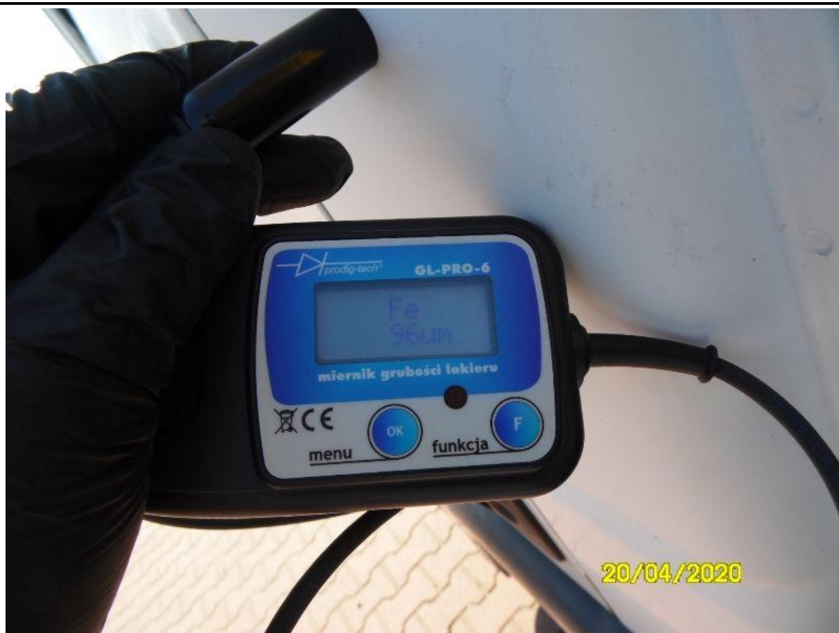
Fot. nr 73