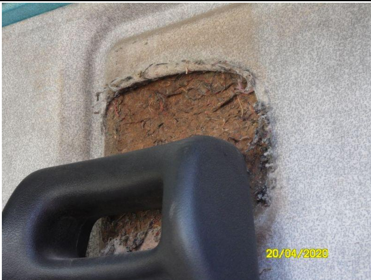
Fot. nr 69