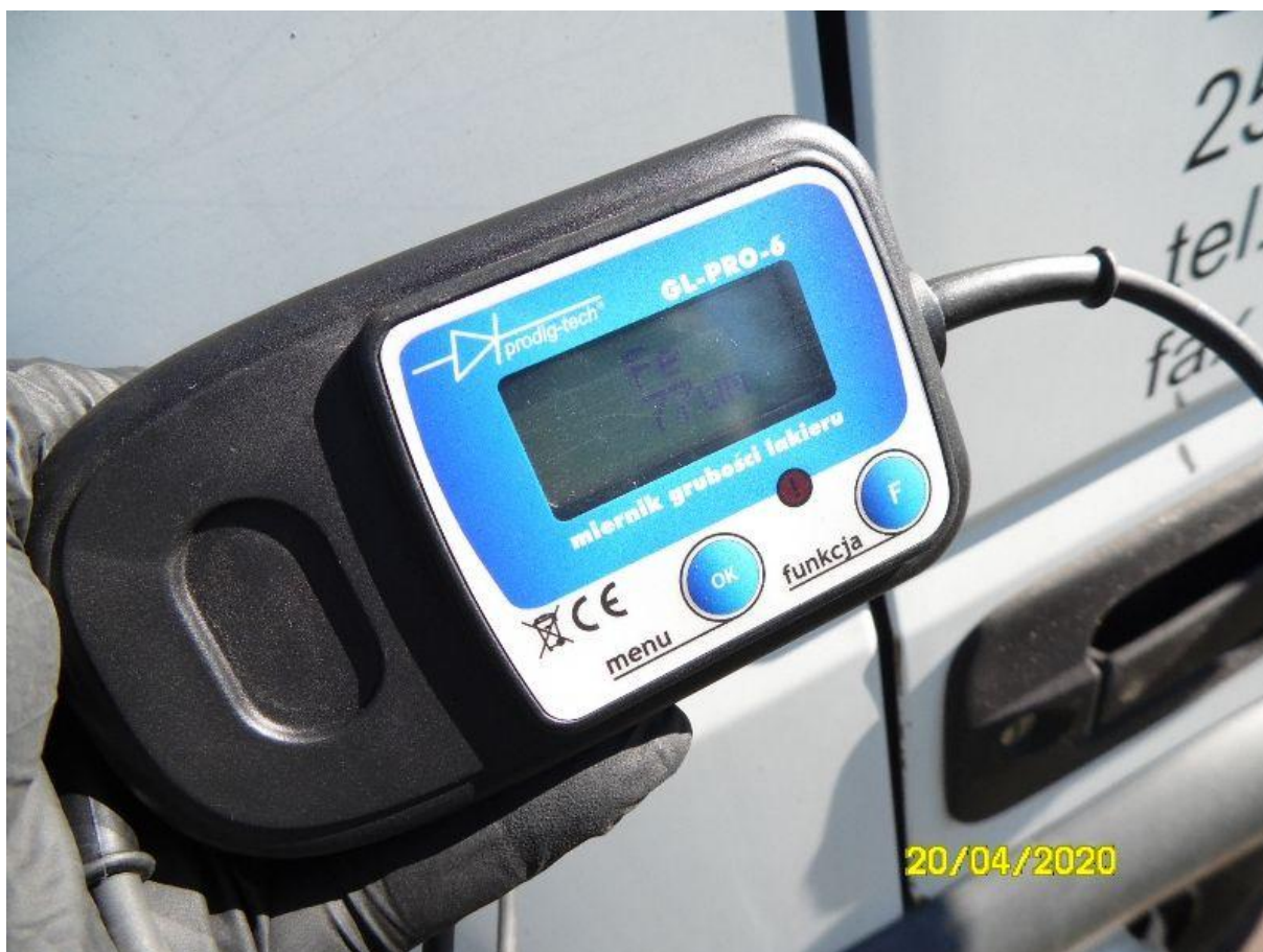
Fot. nr 76

Dokument wystawiony elektronicznie, wa ny bez podpisu