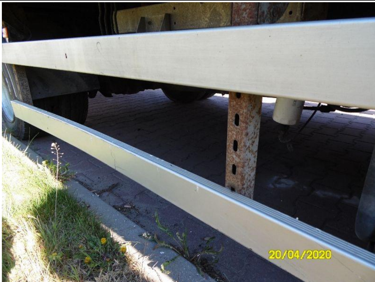
Fot. nr 63